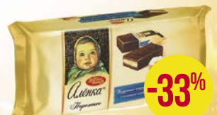
Вафли КОРОВКА, со вкусом топлёного молока, 150 г