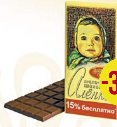
Шоколад молочный АЛЕНКА, с разноцветным драже/ Много молока/ С фундуком/Классический, 100 г