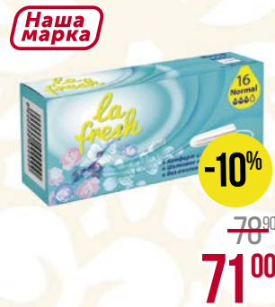
Тампоны LA FRESH® , Нормал, 16 шт.