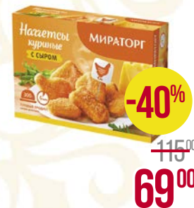
Наггетсы куриные МИРАТОРГ , С сыром, 300 г