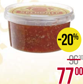
ХРЕНОДЕР (Уральский разносол), 400 г