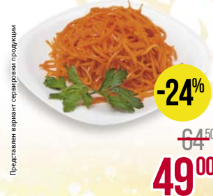
Салат КОРЕЯНА , Морковь по-корейски, 500 г