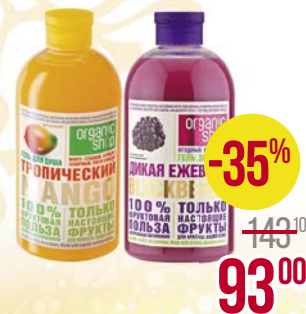
Гель для душа ОРГАНИК ШОП , Манго/ Ежевика, 500 мл