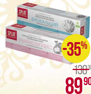
Паста зубная СПЛАТ ПРОФЭШНЛ , Отбеливание плюс/ Биокальций/ Ультракомплекс/ Лечебные травы/ Актив, 100 мл