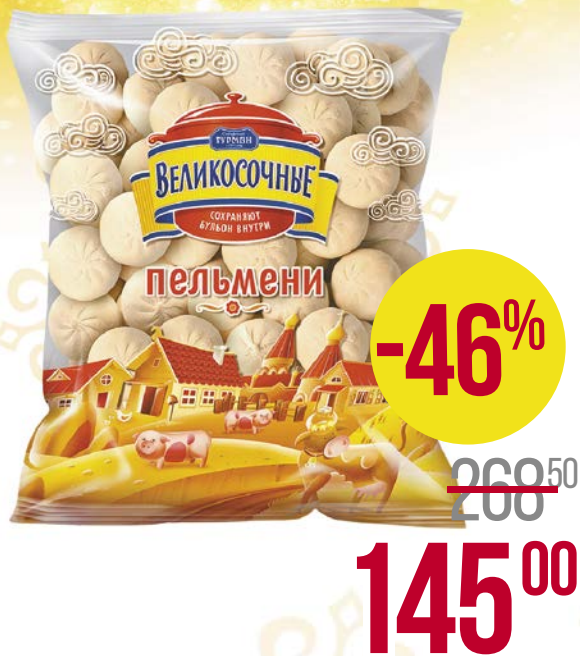
Пельмени ВЕЛИКОСОЧНЫЕ (Сибирский Гурман), 1 кг