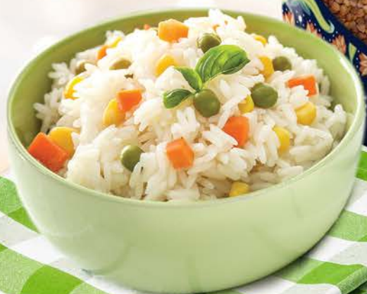
Рис ЗДОРОВЫЙ СТИЛЬ пропаренный, 900 г