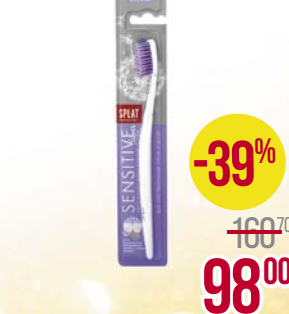
Щетка зубная СПЛАТ , Профешнл сенситив средней жесткости, 1 шт.