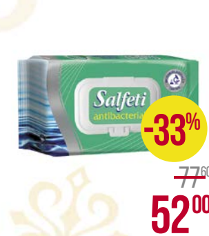
Салфетки влажные САЛФЕТИ , антибактериальные, 72 шт.