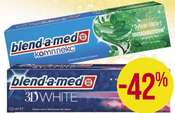
Зубная паста BLEND-A-MED® , Комплекс с ополаскивателем Свежесть трав/ Комплекс, отбеливание, мята/ 3D Вайт: Бодрящая свежесть/ Арктическая свежесть/ Нежная мята, 100 мл