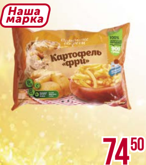
Картофель фри СЕМЕЙНЫЕ СЕКРЕТЫ , Необжаренный, 900 г