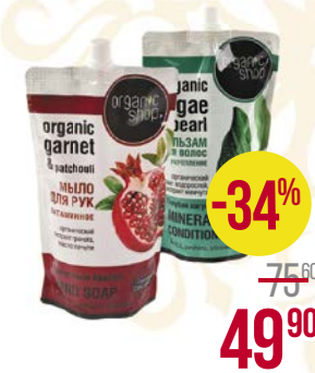
Мыло жидкое ОРГАНИК ШОП , Барбадосское Алоэ/ Гранатовый браслет, 500 мл