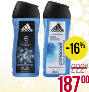
Гель для душа ADIDAS® , Спорт Энерджи, За 1/ Гет Реди/ УЕФА Чемпионс/ Климакул/ УЕФА арена элзиш/ Айс Драйв/ Афте спорт, 3 в 1, 250 мл