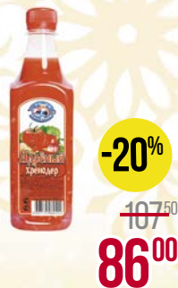
Хренодер ХОЛОДУШКА , Ядреный (Продтехнологии), 500 г