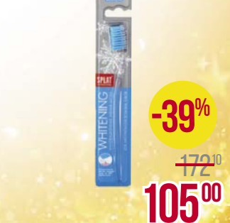
Щетка зубная СПЛАТ , Профешнл Уайтнинг, средней жесткости, 1 шт.