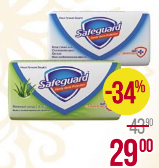
Мыло SAFEGUARD® , антибактериальное: Освежающее/Классическое белое/Алоэ, 90 г