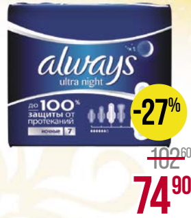
Прокладки ALWAYS® , Ультра Найт, 6 шт.