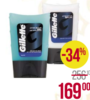
GILLETTE® , Сириес. Гель после бритья: Питательный и тонизирующий/ Для чувствительной кожи/ Бальзам после бритья: Для чувствительной кожи, 75 мл