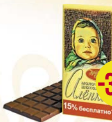
Шоколад молочный АЛЕНКА, с разноцветным драже/ Много молока/ С фундуком/Классический, 100 г