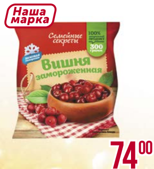
Вишня СЕМЕЙНЫЕ СЕКРЕТЫ , замороженная, без косточек, 300 г