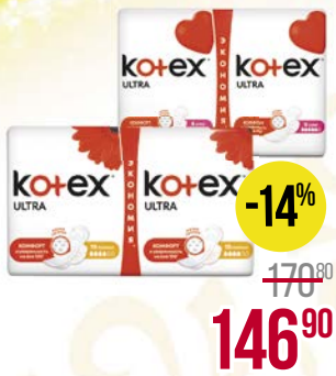
Прокладки КОТЕКС , Ультра. Супер, 16 шт./ Нормал, 20 шт.