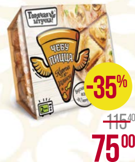
Чебуцица ГОРЯЧАЯ ШТУЧКА , Куричка по-итальянски, 250 г