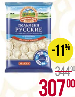
Пельмени РУССКИЕ , Свинина-говядина (Мишкинский продукт), 800 г