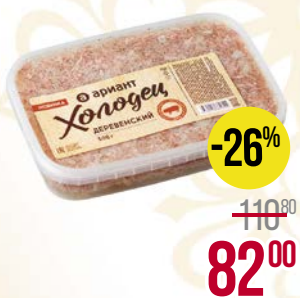
Холодец ДЕРЕВЕНСКИЙ (Ариант Агро), 500 г