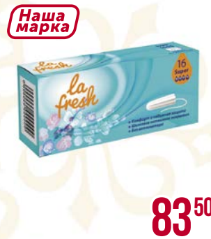
Тампоны LA FRESH® , Супер, 16 шт.