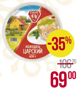
Холодец ЦАРСКИЙ (МПК Ромкор), 400 г