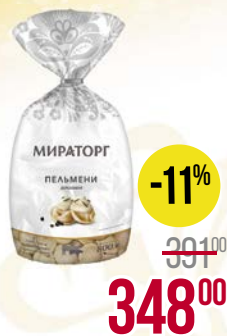
Пельмени МИРАТОРГ , Домашние. Свинина-говядина, 800 г