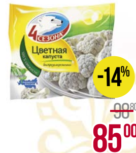
Капуста цветная 4 СЕЗОНА , 400 г