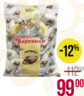
Вареники БРАТЦЫ , с картофелем (Уральские Пельмени), 900 г