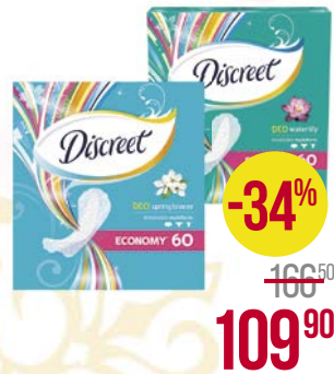
Прокладки DISCREET® , Ежедневные: Водная лилия/ Весенний бриз/ Дышащие/Део Ирресистбл, 60 шт.