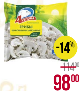
Шампиньоны 4 СЕЗОНА , заморо- женные, резаные, 400 г