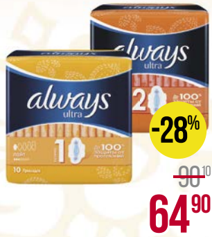
Прокладки ALWAYS® , Ультра: Нормал, 10 шт./ Лайт, 10 шт./ Супер, 8 шт./ Найт, 7 шт.