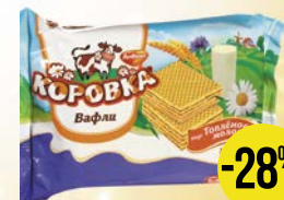
Вафли КОРОВКА, Глазированные, 50 г