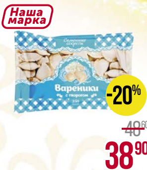
Вареники СЕМЕЙНЫЕ СЕКРЕТЫ , С творогом, 350 г