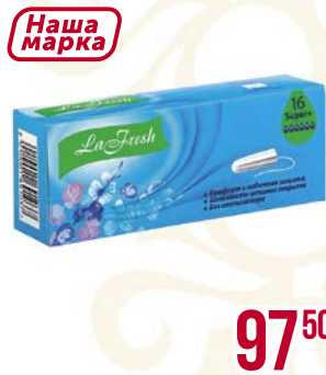
Тампоны LA FRESH® Супер Плюс, 16 шт.