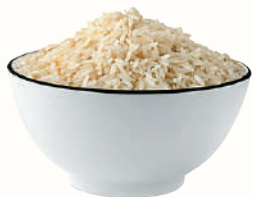
РИС ШЛИФОВАННЫЙ КРУГЛОЗЕРНЫЙ, 1 КГ