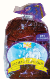
ХЛЕБ "МОНАСТЫРСКИЙ" "ВОЛХОВХЛЕБ", 300 ГР