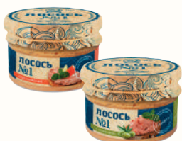
ЛОСОСЬ "РУБЛЕННЫЙ №1", 180 ГР