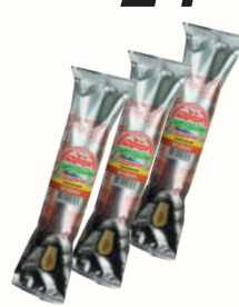
МОРОЖЕНОЕ ПЛОМБИР "СВИТЛОГОРЬЕ" ЭСКИМО ВАНИЛЬНОЕ, 80 ГР