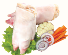
НОГИ СВИНЫЕ С/М, 1 КГ