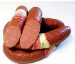
КОЛБАСА "ОДЕССКАЯ" П/К, АНКОН, 1 КГ