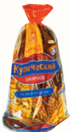
ХЛЕБ "ПЕТРОХЛЕБ" КУПЕЧЕСКИЙ ЗАВАРНОЙ НА РЖАНОМ СОЛОДЕ, "ВОЛХОВХЛЕБ", 500 ГР