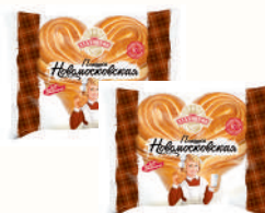
ПЛЮШКА "НОВОМОСКОВСКАЯ" "АЛАДУШКИН", "ДАРНИЦА", 200 ГР