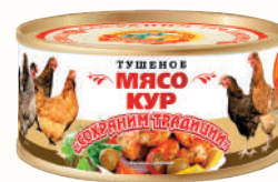
МЯСО КУРЫ, 300 ГР