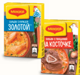
БУЛЬОН "МАГГИ": КУРИНЫЙ ЗОЛОТОЙ; ГОВЯЖИЙ НА КОСТОЧКЕ, 8 КУБ., 80 ГР