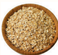
ХЛОПЬЯ ОВСЯНЫЕ "ГЕРКУЛЕС", 1 КГ