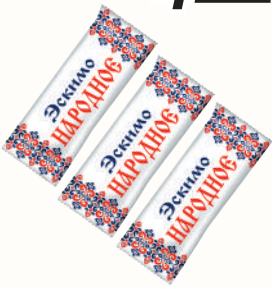
МОРОЖЕНОЕ "ЭСКИМО НАРОДНОЕ" ВАНИЛЬНОЕ, 50 ГР