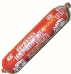
СЕРВЕЛАТ "НАРОДНЫЙ" ЕВРОКОМ, В/К, 1 КГ