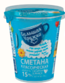
СМЕТАНА "БОЛЬШАЯ КРУЖКА" ЛЕГКАЯ 15%, 315 ГР