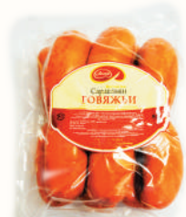
САРДЕЛЬКИ "ГОВЯЖЬИ" ОХЛ., АНКОН, 1 КГ