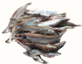
МОЙВА С/М, 1 КГ