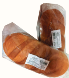
БАТОН НАРЕЗНОЙ 1 СОРТ "ВОЛХОВХЛЕБ", 300 ГР