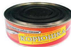
КОРЮШКА В ТОМАТНОМ СОУСЕ, 230 ГР