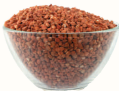
КРУПА ГРЕЧНЕВАЯ ЯДРИЦА, 1 КГ