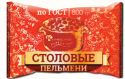
ПЕЛЬМЕНИ "СТОЛОВЫЕ" "КУЛИНАРНЫЕ РЕШЕНИЯ", 800 ГР