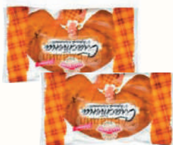
ИЗДЕЛИЕ СДОБНОЕ "СЛАСТЕНА" С НАЧИНОКой СО ВКУСОМ ВАРЕНОЙ СГУЩЕНКИ, "ДАРНИЦА", 230 ГР