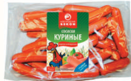
СОСИСКИ "КУРИНЫЕ" ОХЛ., ВНМД, 1 КГ