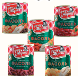
ФАСОЛЬ "ФРАУ МАРТА" В АССОРТИМЕНТЕ, 310 ГР