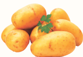
КАРТОФЕЛЬ КРУПНЫЙ, 1 КГ