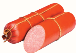
СЕРВЕЛАТ "ЮБИЛЕЙНЫЙ" В/К, ЛАДОГА, 1 КГ