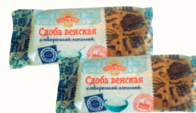
СДОБА "ВЕНСКАЯ" "АЛАДУШКИН" С ТВОРОЖНОЙ НАЧИНОКой, "ДАРНИЦА", 180 ГР