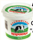
ПРОДУКТ СМЕТАННЫЙ "АЛЬПИЙСКАЯ КОРОВКА" 15%, 900 ГР