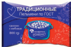
ПЕЛЬМЕНИ "ТРАДИЦИОННЫЕ" "КУЛИНАРНЫЕ РЕШЕНИЯ", 800 ГР