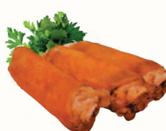
НОГИ ГОВЯЖЬИ С/М, 1 КГ