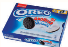
ПЕЧЕНЬЕ "ОРЕО" С КАКАО И ДВОЙНОЙ НАЧИНКОЙ С ВАНИЛЬНЫМ ВКУСОМ, 170 ГР