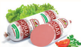
КОЛБАСА "НОВАЯ" САВА, ВАР., 1 КГ