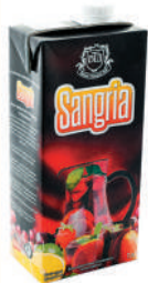
ВИНО ФРУКТОВОЕ "САНГРИЯ", 1 л