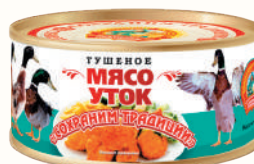
МЯСО УТОК, 300 ГР