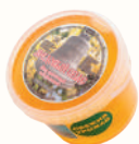
МЕД "МЕДОВЫЙ СПАС" ЛИПОВЫЙ, 700 ГР