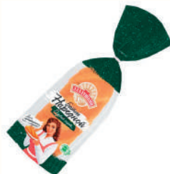
БАТОН "АЛАДУШКИН" НАРЕЗНОЙ "ДАРНИЦА", 350 ГР