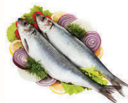
СЕЛЬДЬ С/С, 1 КГ