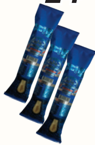
МОРОЖЕНОЕ ПЛОМБИР "СВИТЛОГОРЬЕ" ЭСКИМО ДВУХСЛОЙНОЕ, 80 ГР