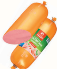
КОЛБАСА "ДОКТОРСКАЯ" НОВИНКА ВНМД, ВАР., 400 ГР