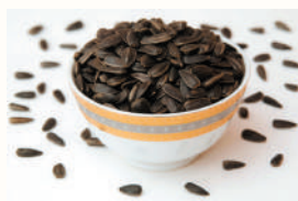
СЕМЕНА ПОДСОЛНЕЧНИКА НЕОЧИЩЕННЫЕ, 1 КГ