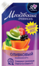
МАЙОНЕЗ "МОСКОВСКИЙ ПРОВАНСАЛЬ" ОЛИВКОВЫЙ, 67%, 390 МЛ