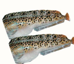
ЗУБАТКА С/М, 1 КГ