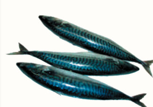
СКУМБРИЯ С/М, 1 КГ