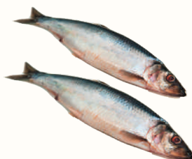
СЕЛЬДЬ С/М, 1 КГ