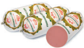
КОЛБАСА "МУСУЛЬМАНСКАЯ" ВАР., САВА, 1 КГ