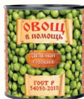
ГОРОШЕК ЗЕЛЕНый "ОВОЩ В ПОМОЩЬ", 310 ГР