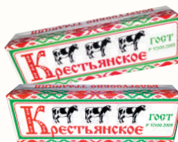
СПРЕД "КРЕСТЬЯНСКОЕ" РАСТИТЕЛЬНО-ЖИРОВОЙ, 60%, 450 ГР