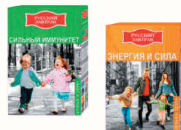
СМЕСЬ ХЛОПЬЕВ "РУССКИЙ ЗАВТРАК" СИЛЬНЫЙ ИММУНИТЕТ, ЭНЕРГИЯ И СИЛА, 240 ГР