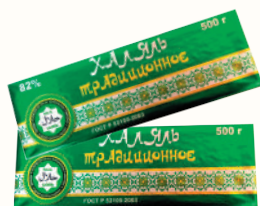
СПРЕД "ХАЛЯЛЬ ТРАДИЦИОННОЕ" РАСТИТЕЛЬНО-ЖИРОВОЙ 82%, 500 ГР