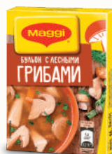
БУЛЬОН "МАГГИ" С ЛЕСНЫМИ ГРИБАМИ, 8 КУБ., 80 ГР