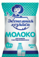
МОЛОКО ПИТЬЕВОЕ "ЭКОНОМНАЯ ХОЗЯЙКА" 1,5%, 900 ГР