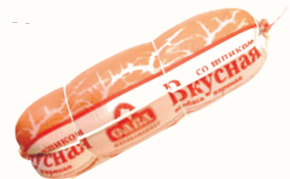
КОЛБАСА "ВКУСНАЯ СО ШПИКОМ" ВАР., САВА, 1 КГ