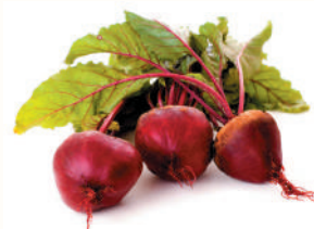
СВЕКЛА, 1 КГ