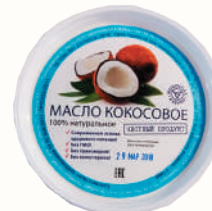
МАСЛО "КОКОСОВОЕ", 450 ГР