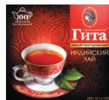
ЧАЙ "ПРИНЦЕССА ГИТА" ИНДИЙСКИЙ ЧЕРНЫЙ БАЙХОВЫЙ, 100 ПАК. Б/Я