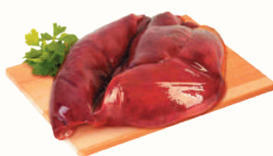
ПЕЧЕНЬ СВИНАЯ С/М, 1 КГ