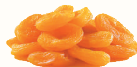
КУРАГА, 1 КГ