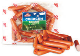
СОСИСКИ "ВЕНСКИЕ" ОХЛ., САВА, 1 КГ