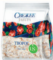
ТВОРОГ "СВЕЖЕЕ ЗАВТРА", 1,8%, 400 ГР