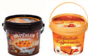
СГУЩЕНКА "БЕЛА СЛАДА": "ВАРЕНАЯ С САХАРОМ" 12%, 400 ГР; "МЯГКАЯ КАРАМЕЛЬ" С САХАРОМ 5%, 400 ГР