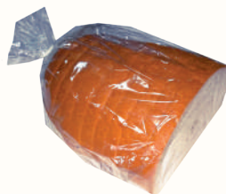
ХЛЕБ "БОКАТО" "ВОЛХОВХЛЕБ", 300 ГР