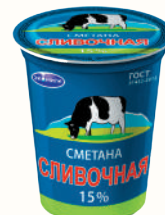
СМЕТАНА "СЛИВОЧНАЯ" 15%, 400 ГР