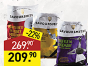
Чипсы SAVOURSMITHS в ассортименте, 150 г, Великобритания