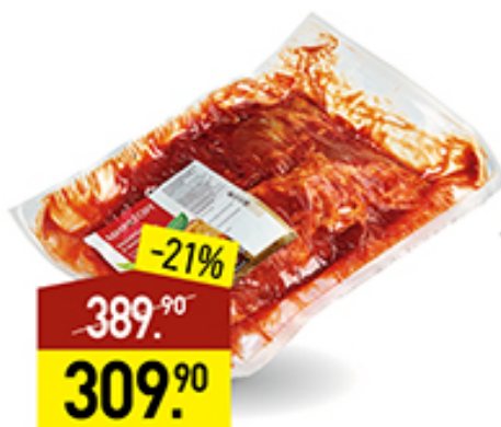
Лопатка свиная МИРАТОРГ б/к, в маринаде, в пакете для запекания, 1 кг