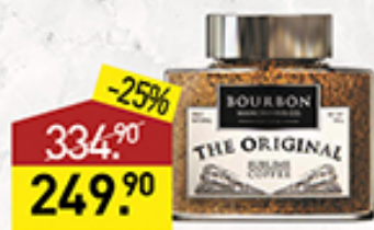
Кофе BOURBON original, 100 г