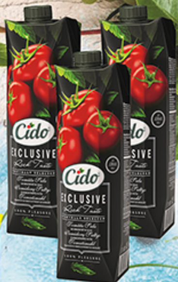
Сок CIDO томатный, 1 л, Латвия