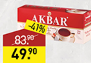
Чай АКБАР черный, 25 пакетиков