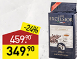
Кофе CAFFE EXCELSIOR молотый, 100% арабика, 250 г, Италия