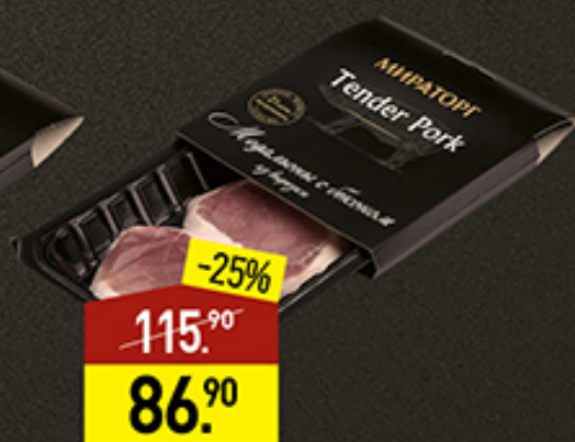
Медальоны с беконом из свинины МИРАТОРГ Tender Pork, 250 г