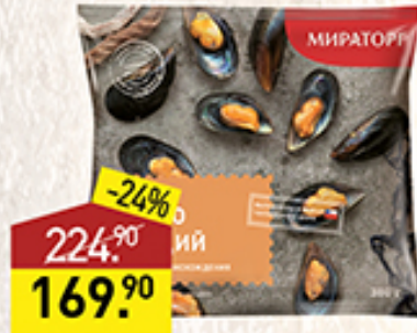
Отборное мясо мидий ВИТАМИН с/м, 380 г