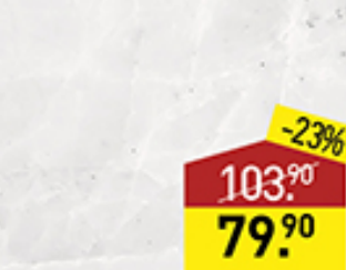
Цикорий ЗДОРОВЬЕ 100 г