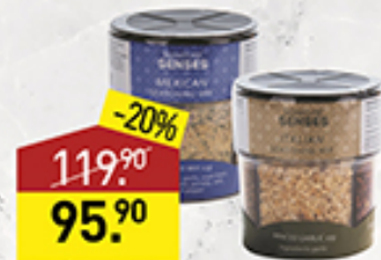
Специи SIGNATURE SENSES в ассортименте, 41-54 г, Китай