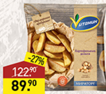
Картофельные дольки ВИТАМИН Мираторг, 600 г