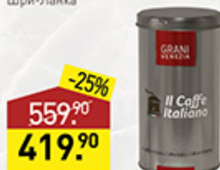
Кофе IL CAFFE ITALIANO зерновой, 250 г, Италия