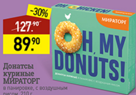
Донаты куриные МИРАТОРГ в панировке, с воздушным рисом, 210 г