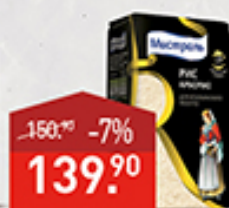
Рис МИСТРАЛЬ Арборио, 500 г