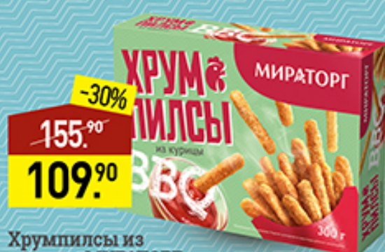
Хрумпылы из курицы МИРАТОРГ Барбекю, 300 г