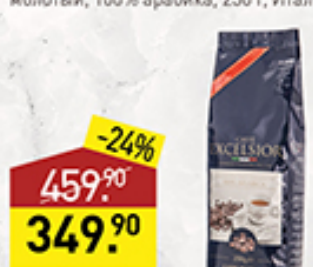
Кофе CAFFE EXCELSIOR зерновой, 100% арабика, 250 г, Италия