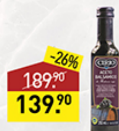
Уксус бальзамический CIRIO 250 мл, Италия