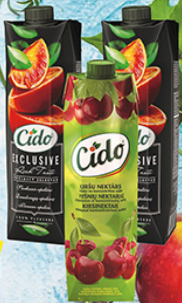
Нектар CIDO вишневый, красный апельсин, 1 л, Латвия