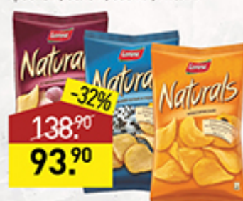
Чипсы LORENZ в ассортименте, 100 г, Польша