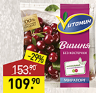
Викшня ВИТАМИН Мираторг, без косточки, 300 г