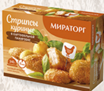
Стрипсы куриные МИРАТОРГ в картофельной панировке, 340 г