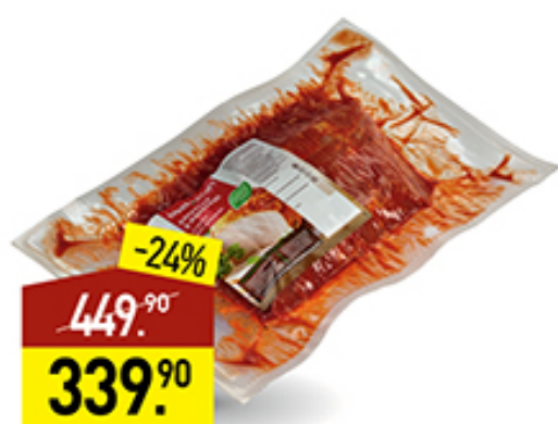
Карбонад свиной МИРАТОРГ б/к, в маринаде, в пакете для запекания, 1 кг