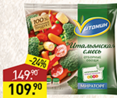
Смесь Итальянская ВИТАМИН Мираторг, 400 г