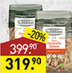
Изделия макаронные SGAMBARO рифленые перья, тривеллине, 500 г, Италия