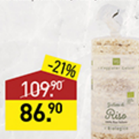
Галеты рисовые IL VIAGGIATOR GOLOSO 120 г, Италия