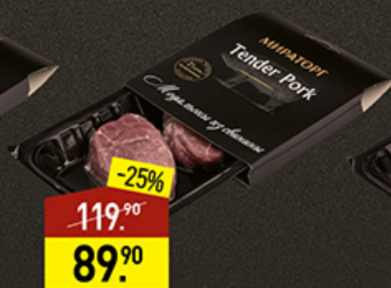
Медальоны из свинины МИРАТОРГ Tender Pork, 250 г