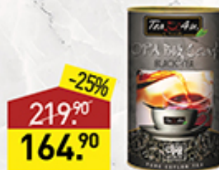
Чай 4 TEA U черный/зеленый, 100 г, Шри-Ланка