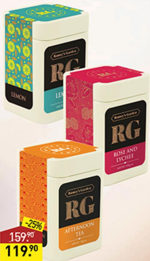
Чай R.G. в ассортименте, 20 г, Шри-Ланка

Мода и качество - ключевые слова продукции RG. Каждый аромат разработан мастером чайного искусства.