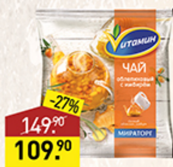
Чай ВИТАМИН Мираторг, облепиховый, с имбирем, 300 г