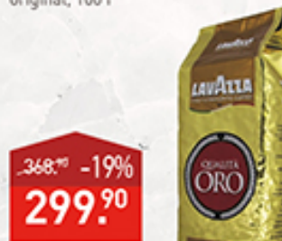
Кофе ORO Lavazza зерно, 250 г