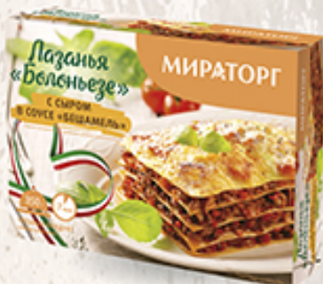
Лазанья Болоньезе МИРАТОРГ с сыром, в соусе Бешамель, 350 г