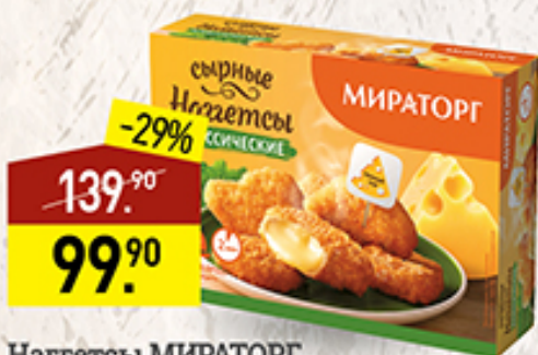
Наггетсы МИРАТОРГ сырные, классические, 300 г