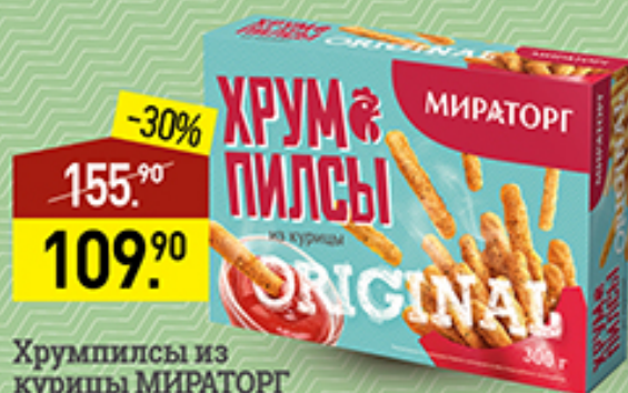
Хрумпылы из курицы МИРАТОРГ Оригинал, 300 г