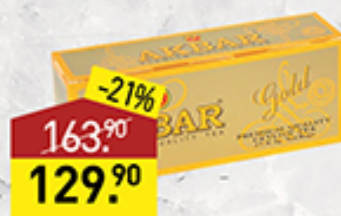
Чай АКБАР черный, gold, 100 г