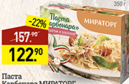
Паста Карбонара МИРАТОРГ с сыром и беконом, 350 г