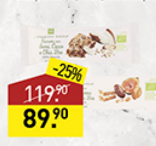
Батончик-мюсли IL VIAGGIATOR GOLOSO в ассортименте, 30 г, Италия