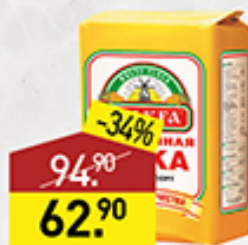
Мука пшеничная в/с, 2 кг