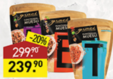
Мюсли HIS POWER/ ENERGETIC/THIN функционального назначения, 400 г