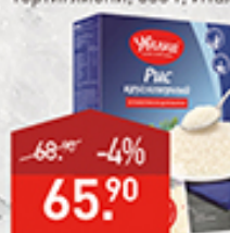
Рис УВЕЛКА варочные пакеты, 5*80 г