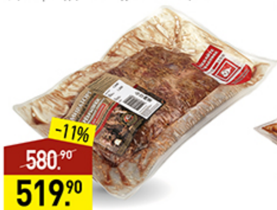
Ребрышки МИРАТОРГ мраморная говядина, для запекания, 1 кг