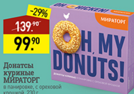
Донаты куриные МИРАТОРГ в панировке, с ореховой крошкой, 230 г