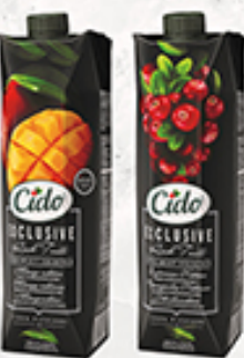
Нектар CIDO клюквенный, манго, 1 л, Латвия