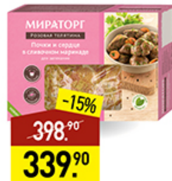
Почки и сердце МИРАТОРГ Розовая телятина, в сливочном маринаде, для запекания, 800 г