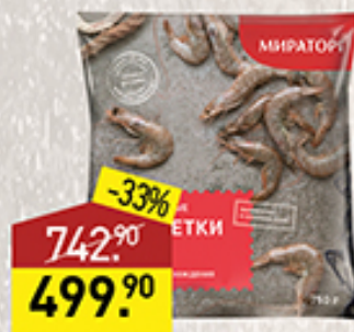
Креветки ВИТАМИН неочищенные, 70/90, 750 г