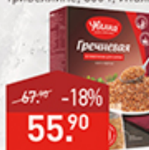
Гречка УВЕЛКА варочные пакеты, 5*80 г