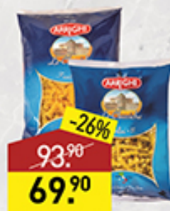
Изделия макаронные ARRIGHI фузилли, фузиллини, тортиглиони, 500 г, Италия