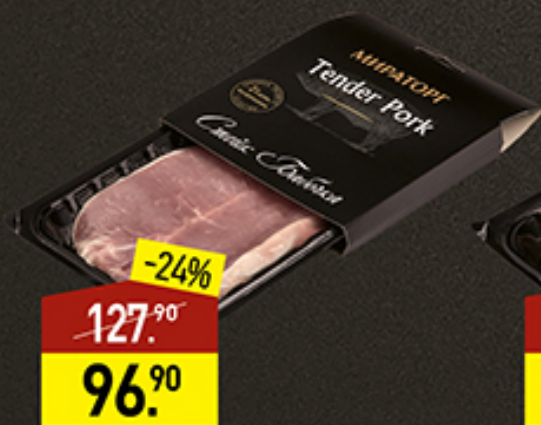
Стейк из свинины Бабочка МИРАТОРГ Tender Pork, 250 г