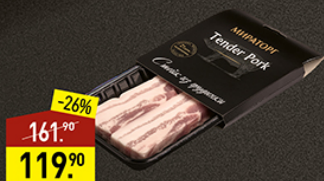
Стейк из грудинки свиной МИРАТОРГ Tender Pork, 360 г

Для Tender Pork мы выбрали свинину особой породы PIC, которая вызревала в течение 3 недель. В результате получается нежное и сочное мясо с особым вкусом и мягкой текстурой. Tender Pork – это свинина отличного качества, которая станет изысканным деликатесом на вашем столе.