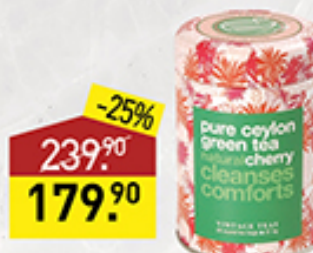
Чай VINTAGE TEAS зеленый со вкусом вишни, 37,5 г, Шри-Ланка