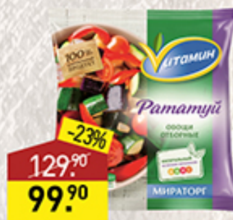
Смесь овощная Рататуй ВИТАМИН Мираторг, 400 г