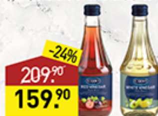
Уксус винный CIRIO красный, белый, 500 мл, Италия