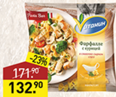
Фарфалле ВИТАМИН Мираторг, с курицей в сливочном соусе, 400 г