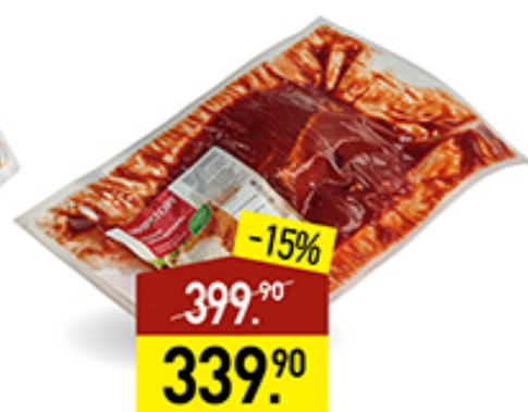
Окорок свиной МИРАТОРГ Дворянский, в брусничном соусе, без кости, в пакете для запекания, 1 кг