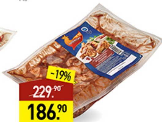
Крыло цыпленка-бройлера МИРАТОРГ в маринаде Сацебели, для запекания, 1 кг