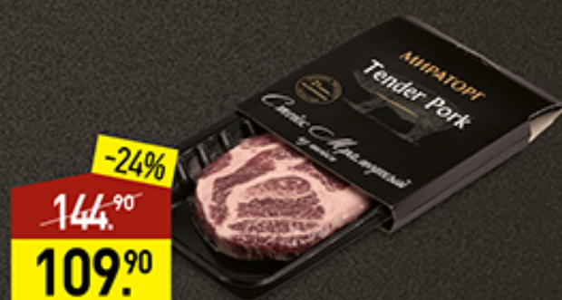
Стейк из шейки свиной Мраморный МИРАТОРГ Tender Pork, 280 г