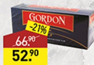
Чай ГОРДОН черный, 25 пакетиков