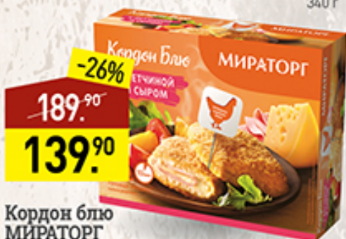
Кордон блю МИРАТОРГ с ветчиной и сыром, 405 г