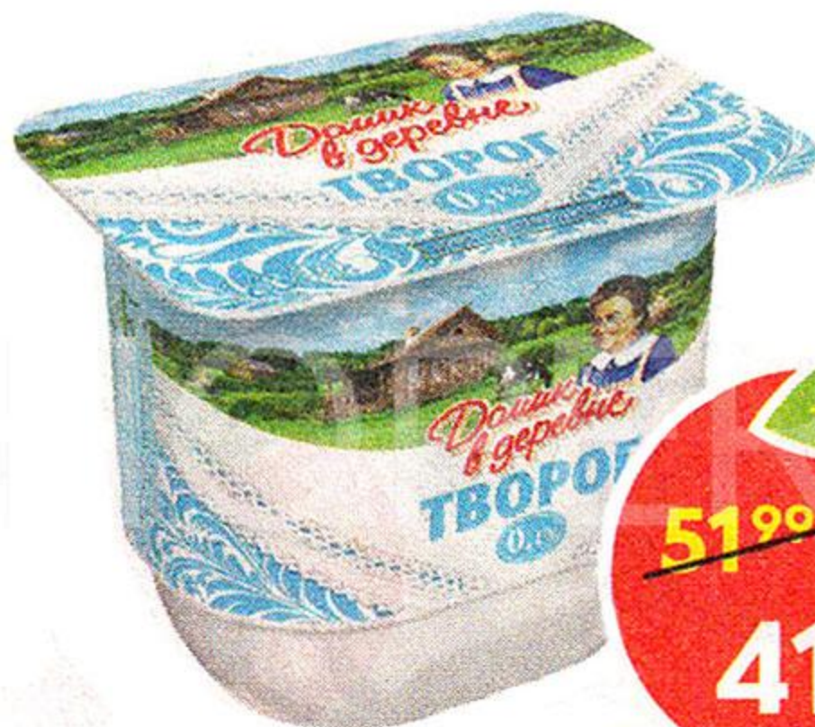
Творог мягкий, Домик в Деревне, 0,1%, 180 г