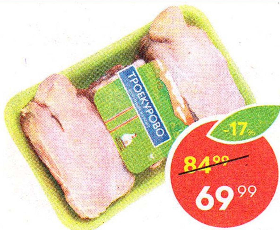
Набор для супа, Троекурово, 1 кг