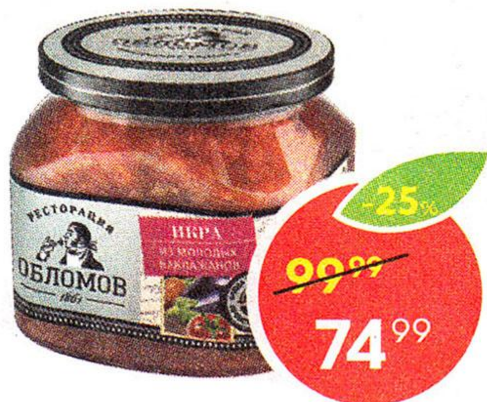
Икра из молодых баклажан, Ресторация обломов, 420 г