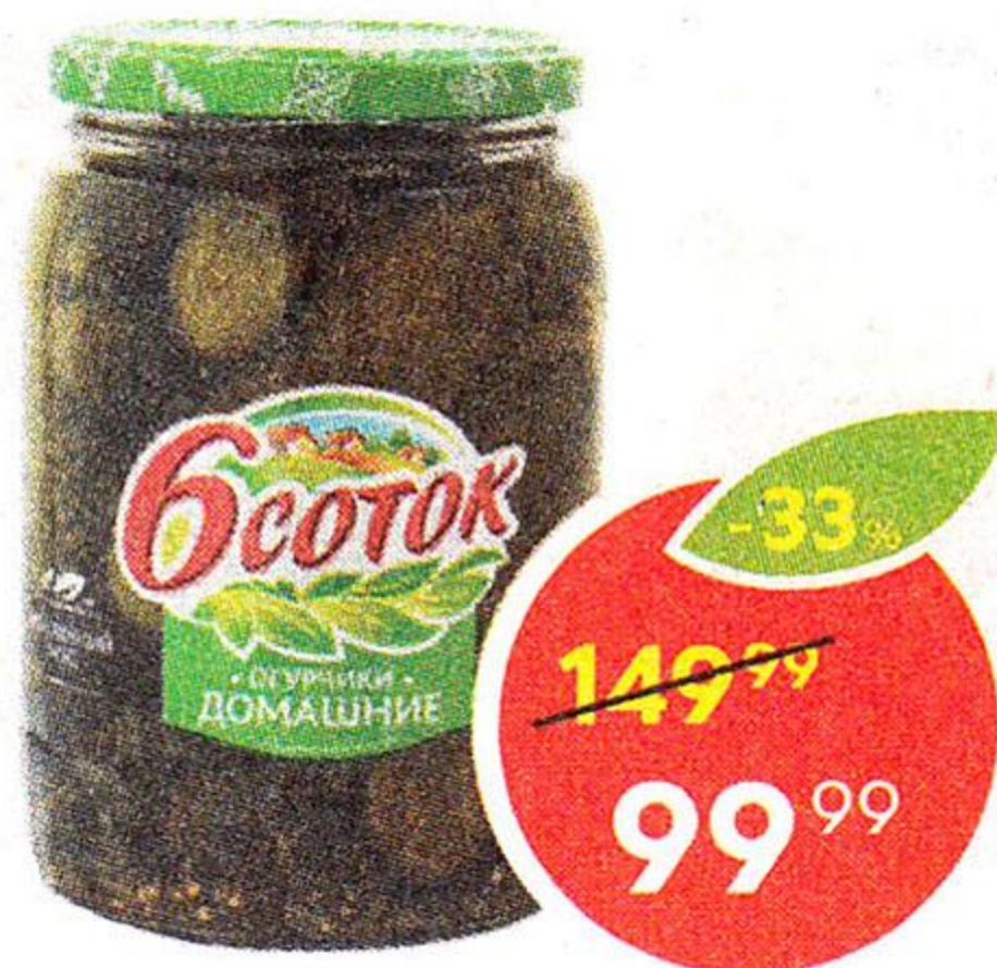
Огурцы домашние, 6 Соток, 720 мл