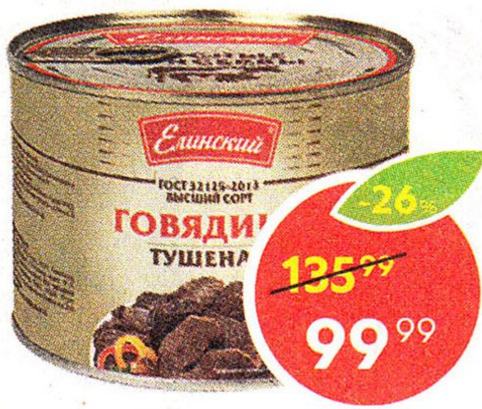
Говядина тушеная, высший сорт, ГОСТ, Елинский МК, 525 г