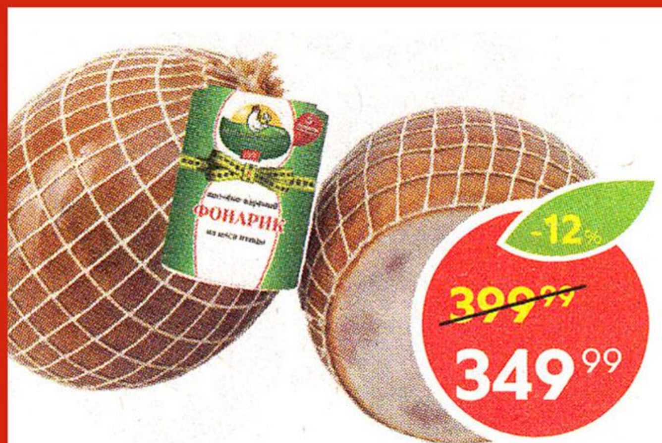
Фонарик из мяса цыпленка, Чебаркульская Птица, 1 кг