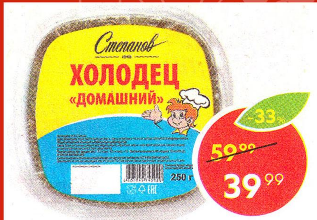
Холодец Домашний, Степанов, 250 г