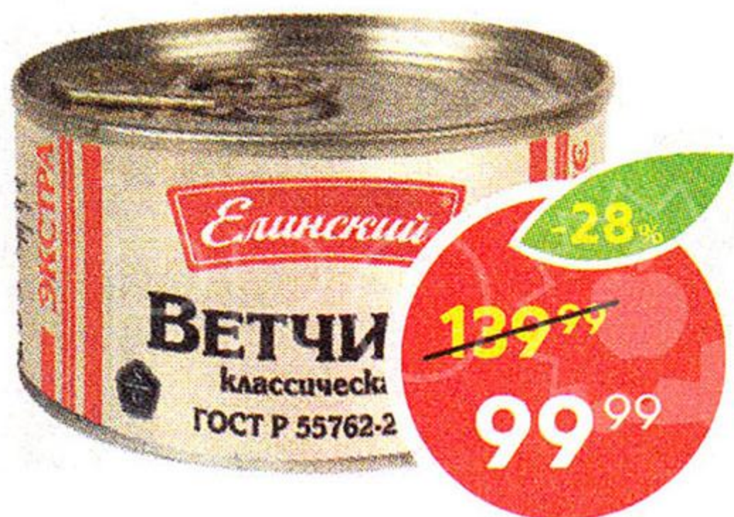
Ветчина Экстра, ГОСТ, Елинский ПК, 325 г