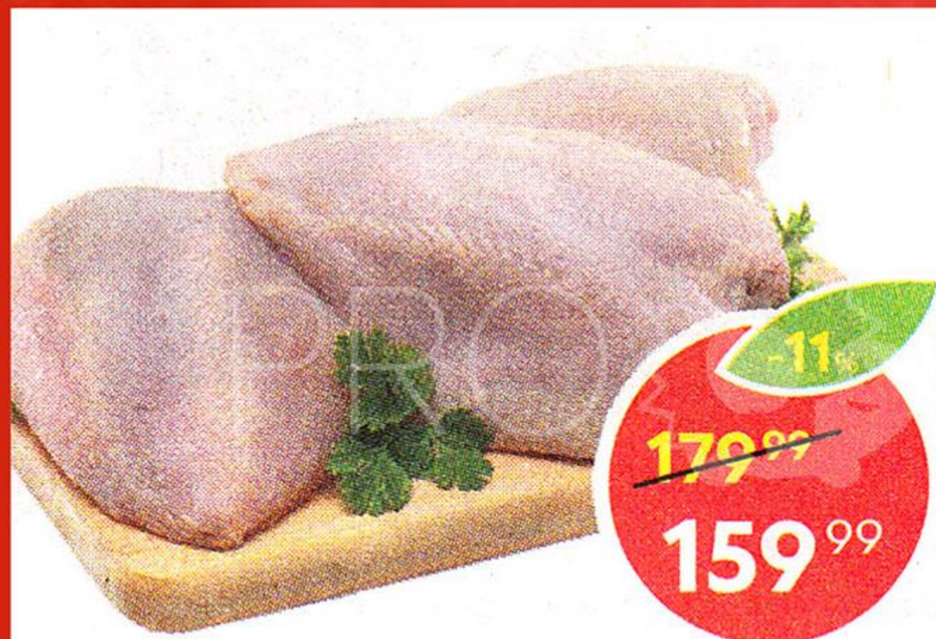
Грудка, куриная, 1 кг