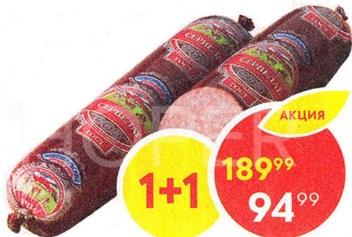
Сервелат, варено-копченый, Новоуральский МД, 300 г