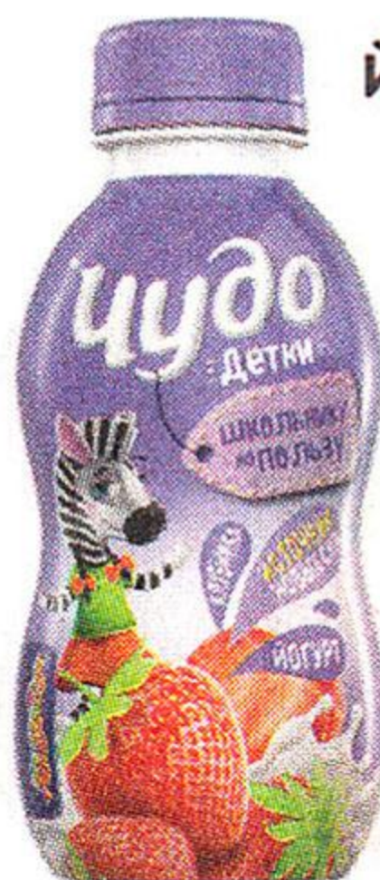
Йогурт Чудо Детки, питьевой, клубничный, 2,2%, 200 г