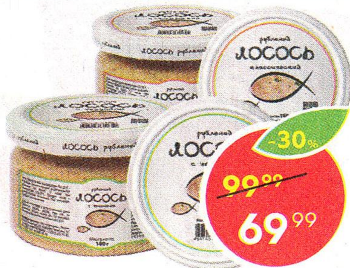
Лосось тихоокеанский, рубленый, классический; с чесноком, Европром, 180 г