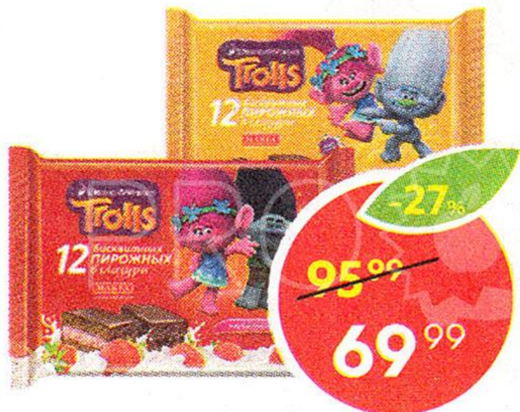
Пирожное Trolls, банановый десерт; клубничный мусс, Маффа, 216 г