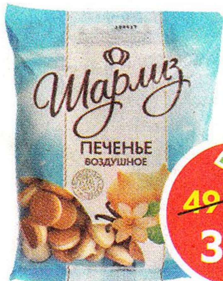
Печенье Шарлиз, Воздушное, 200 г