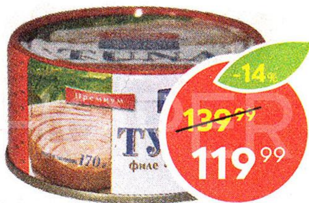
Филе Тунца, натуральное, Морской котик, 170 г