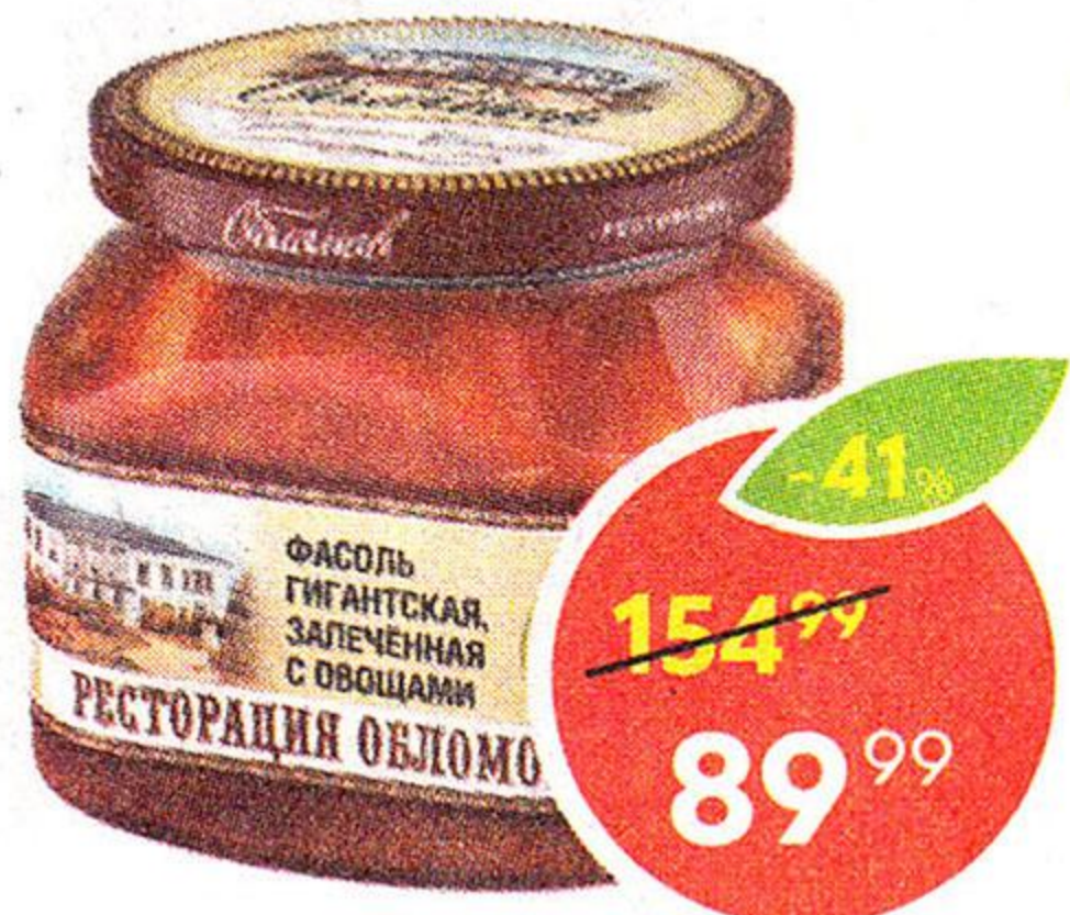
Фасоль Ресторация Обломов, гигантская, с овощами, 430 г