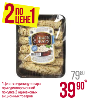
Блинчики С ПЫЛУ С ЖАРУ , с творогом, 360 г