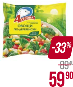
Смесь овощная 4 СЕЗОНА , Овощи по-деревенски, замороженные, 400 г