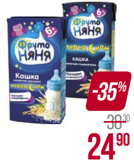
Каша молочная** ФРУТОНЯ, 5 злаков-персик/ Пшеничная/ Мультизлаковая/ Гречневая с яблоком/ Рисовая, 200 г