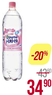
Вода детская** ФРУТОНЯ, 1,5 л