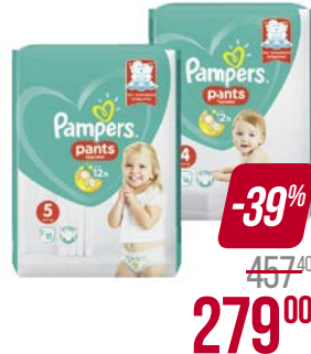
Подгузники-трусики PAMPERS®, Пэнтс: Макси (9-15 кг) 16 шт./ Джуниор (12-17 кг) 15 шт.