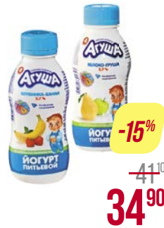
Йогурт питьевой** АГУША, Засыпай-ка, Яблоко-мелисса/ Яблоко-груша/ Клубника-банан, 200 г