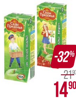
Сок** САДЫ ПРИДОНЬЯ, Яблоко-грушевый/ Зеленое яблоко/ Яблоко прямого отжима/ Мультифруктовый/ Яблоко-персик/ Яблоко-шиповник/ Яблоко-вишня/ Яблоко-виноград, 200 мл