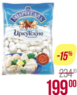
Пельмени МИРИТАЛЬ , Иркутские, говяжьи, 900 г