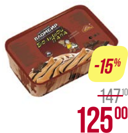
Мороженое БОЛЬШОЙ ПАПА , Пломбир шоколадный, 450 г