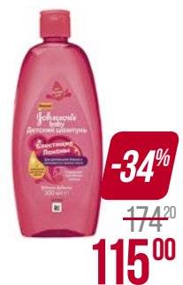
Шампунь JOHNSON'S® BABY, Блестящие локоны, 300 мл