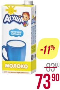
Молоко** АГУША, Ультрапастеризованное, 3,2%, 925 мл