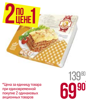
Лазанья ЗОЛОТОЙ ПЕТУШОК , мясная, 370 г