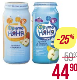
Пюре** ФРУТОНЯ, Яблоко-банан со сливками/ Яблоко-персик/ Яблоко со сливками и сахаром/ Из яблок со сливками и сахаром/ Из яблок и груш со сливками и сахаром/ Из яблок/ Из груш и яблок, 250 г