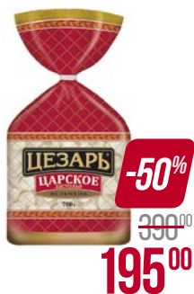
Пельмени ЦЕЗАРЬ , Царское застолье, 750 г