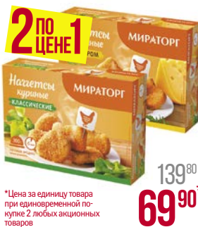
Наггетсы куриные МИРАТОРГ , Классические/С сыром, 300 г