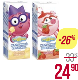
Коктейль молочный СМЕШАРИКИ, Ванильное мороженое/ Клубника, 200 г