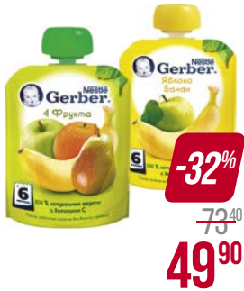
Пюре** ГЕРБЕР, Яблоко-банан/ 4 фрукта, 90 г