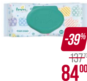
Салфетки влажные PAMPERS®, Беби фреш, детские, 64 шт.