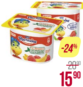
Йогурт РАСТИШКА, Клубника/ Малина-банан/ Яблоко-груша, 110 г