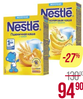
Каша молочная** НЕСТЛЕ, Овсяная, груша-банан/ Мультизлаковая, яблоко-банан/ Пшеничная с тыквой, 220 г