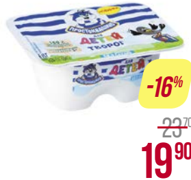
Творог ПРОСТОКВАШИНО, детский, без сахара, 3,8%, 100 г