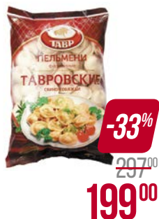
Пельмени ТАВРОВСКИЕ , Фирменные, свинина и говядина (Тавр), 1 кг