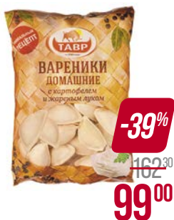
Вареники ТАВР Домашние, картофель и жареный лук, 900 г