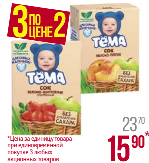
*Цена за единицу товара при одновременной покупке 3 любых акционных товаров Сок** ТЁМА, Груша/ Яблоко-шиповник, осветленный/ Мультифрукт/ Яблоко-персик/ Яблочный/ Яблоко-банан, с мякотью, 200 мл