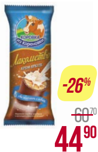
Мороженое КОРОВКА ИЗ КОРЕНОВКИ , Лакомство, крем-брюле, 90 г