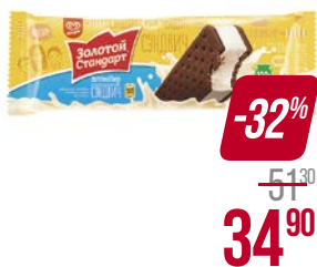
Мороженое ЗОЛОТОЙ СТАНДАРТ , пломбир, шоколад-печенье, 69 г