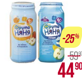
Пюре** ФРУТОНЯ, Яблоко-банан со сливками/ Яблоко-персик/ Яблоко со сливками и сахаром/ Из яблок со сливками и сахаром/ Из яблок и груш со сливками и сахаром/ Из яблок/ Из груш и яблок, 250 г