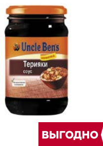
Соус АНКЛ БЕНС , Терияки, 210 г