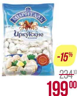
Пельмени МИРИТАЛЬ , Иркутские, говяжьи, 900 г