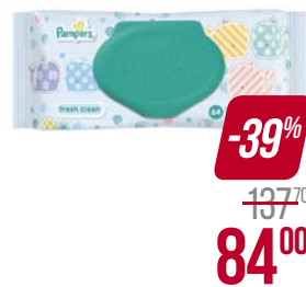
Салфетки влажные PAMPERS®, Беби фреш, детские, 64 шт.