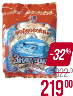
Пельмени ЗИМУШКА , Мордовские, свинина-говядина, 760 г