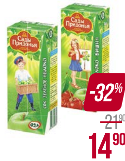
Сок** САДЫ ПРИДОНЬЯ, Яблоко-грушевый/ Зеленое яблоко/ Яблоко прямого отжима/ Мультифруктовый/ Яблоко-персик/ Яблоко-шиповник/ Яблоко-вишня/ Яблоко-виноград, 200 мл