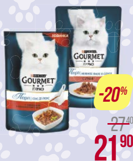
Корм для кошек ГУРМЕ , Перл, в подливке: Говядина/ Курица/ Лосось/ Утка, 85 г