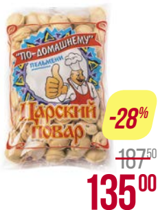
Пельмени ЦАРСКИЙ ПОВАР , По-домашнему, свино-говяжьи (ООО Блиц), 900 г