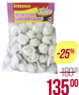
Пельмени СИБИРСКИЕ , (Отрадные ООО), 900 г