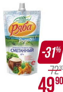
Майонез РЯБА , Сметанный провансаль, 67%, 372 г