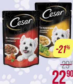
Корм для собак ЦЕЗАРЬ , Курица-зеленые овощи/ Говядина-овощи / Ягненок-овощи/ Говядина-кролик-шпинат, 100 г