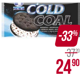
Мороженое КОЛД КОАЛ , с шоколадом в печенье (Челны-Холод), 80 г