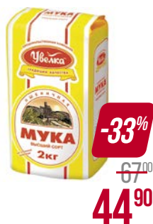
Мука пшеничная УВЕЛКА , Высший сорт, 2 кг