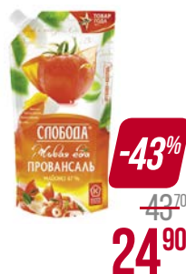
Майонез СЛОБОДА , Провансаль, 67%, 220 г