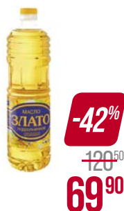
Масло подсолнечное ЗЛАТО , Рафинированное, дезодорированное, 1 л