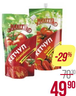
Кетчуп МАХЕЕВЪ , Томатный/Шашлычный/ Татарский/ Чили/ Лечо, 500 г