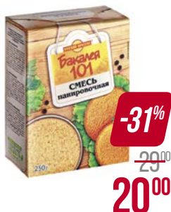
Смесь панировочная БАКАЛЕЯ 101 (РУСПРОД ОАО), 250 г