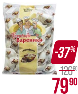
Вареники БРАТЦЫ , с картофелем (Уральские Пельмени), 900 г