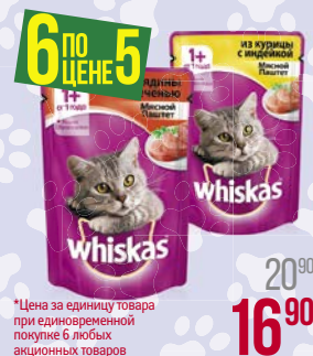
Корм для кошек ВИСКАС , В ассортименте***, 85 г