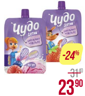
Йогурт питьевой ЧУДО ДЕТКИ, Клубника-малина/ Малина-черника и пломбир, 85 г