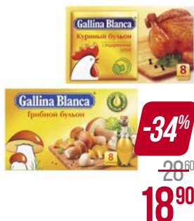
Бульон ГАЛИНА БЛАНКА , Куриный/ Грибной, 80 г