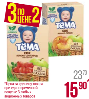
*Цена за единицу товара при одновременной покупке 3 любых акционных товаров Сок** ТЁМА, Груша/ Яблоко-шиповник, осветленный/ Мультифрукт/ Яблоко-персик/ Яблочный/ Яблоко-банан, с мякотью, 200 мл