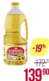
Масло подсолнечное КОРОНА ИЗОБИЛИЯ , рафинированное, дезодорированное, 1,7 л