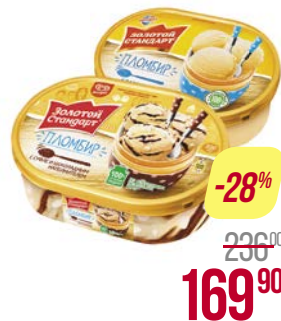
Пломбир ЗОЛОТОЙ СТАНДАРТ , Классический/Суфле и шоколадный наполнитель, 475 г