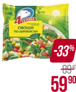
Смесь овощная 4 СЕЗОНА , Овощи по-деревенски, замороженные, 400 г