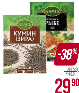
Приправа КАМИС , К курице, 30 г; К плову/ К рыбе/ К блюдам из картофеля, 25 г; Кумин (Зира), 15 г