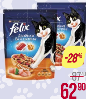
Корм для кошек ФЕЛИКС , Сухой, Двойная вкуснятина: Мясо/ Птица, 300 г