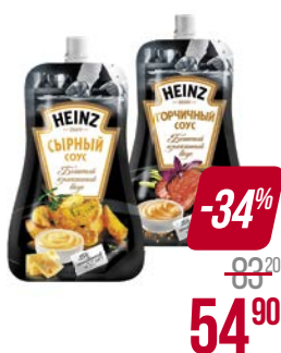
Соус ХАЙНЦ , Сырный/ Горчичный/ Цезарь, 230 г