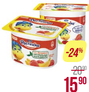
Йогурт РАСТИШКА, Клубника/ Малина-банан/ Яблоко-груша, 110 г