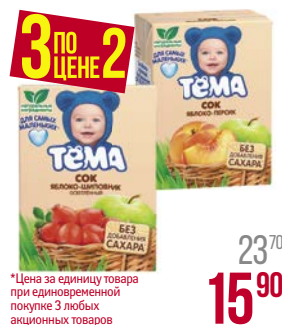
Сок** ТЁМА, Груша/ Яблоко-шиповник, осветленный/ Мультифрукт/ Яблоко-персик/ Яблочный/ Яблоко-банан, с мякотью, 200 мл