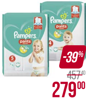
Подгузники-трусики PAMPERS®, Пэнтс: Макси (9-15 кг) 16 шт./ Джуниор (12-17 кг) 15 шт.