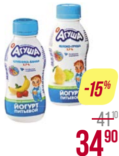
Йогурт питьевой** АГУША, Засыпай-ка, Яблоко-мелисса/ Персик/ Яблоко-груша/ Клубника-банан, 200 г