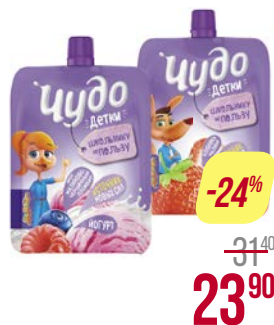
Йогурт питьевой ЧУДО ДЕТКИ, Клубника-малина/ Малина-черника и пломбир, 85 г