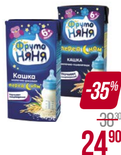
Каша молочная** ФРУТОНЯЯ, 5 злаков-персик/ Пшеничная/ Мультизлаковая/ Гречневая с яблоком/ Рисовая, 200 г