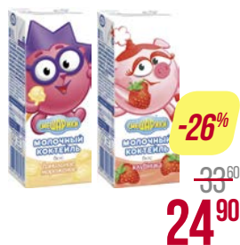
Коктейль молочный СМЕШАРИКИ, Ванильное мороженое/ Клубника, 200 г