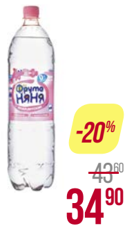
Вода детская** ФРУТОНЯЯ, 1,5 л