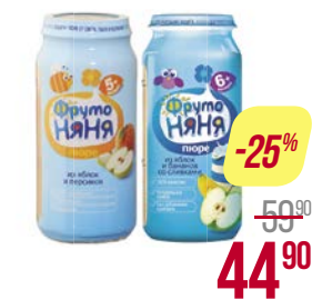
Пюре** ФРУТОНЯЯ, Яблоко-банан со сливками/ Яблоко-персик/ Яблоко со сливками и сахаром/ Из яблоч. со сливками и сахаром/ Из яблоч. и груш. со сливками и сахаром/ Из яблоч./ Из груш и яблоч., 250 г