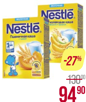
Каша молочная** НЕСТЛЕ, Овсяная, груша-банан/ Мультизлаковая, яблоко-банан/ Пшеничная с тыквой, 220 г