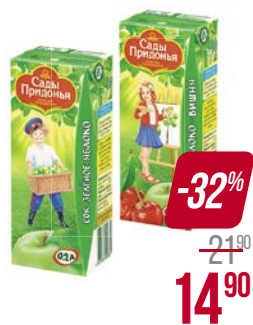
Сок** САДЫ ПРИДОНЬЯ, Яблоко-грушевый/ Зеленое яблоко/ Яблоко прямого отжима/ Мультифруктовый/ Яблоко-персик/ Яблоко-шиповник/ Яблоко-вишня/ Яблоко-виноград, 200 мл