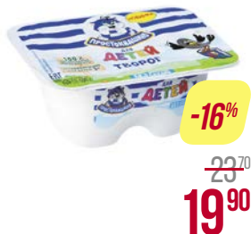
Творог ПРОСТОКВАШИНО, детский, без сахара, 3,8%, 100 г