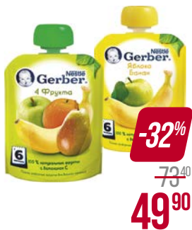
Пюре** ГЕРБЕР, Яблоко-банан/ 4 фрукта, 90 г