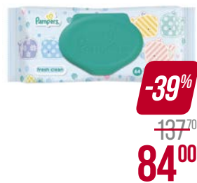
Салфетки влажные PAMPERS®, Беби фреш, детские, 64 шт.