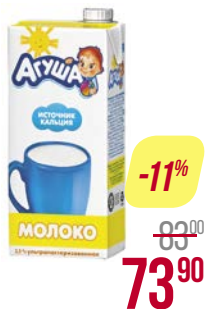
Молоко** АГУША, Ультрапастеризованное, 3,2%, 925 мл