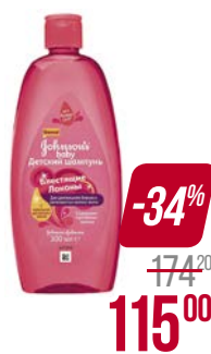
Шампунь JOHNSON'S® BABY, Блестящие локоны, 300 мл