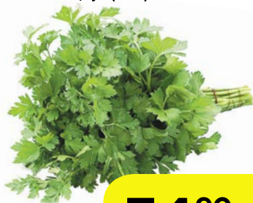
ПЕТРУШКА, 1 уп. (100 г)