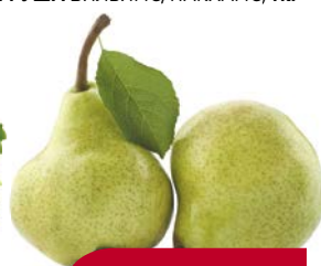
ГРУША ВИЛЬЯМС/ПАКХАМС, 1 кг