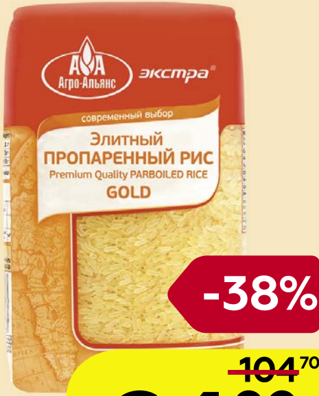
Рис АГРО-АЛЬЯНС, Экстра, Пропаренный, элитный, 900 г