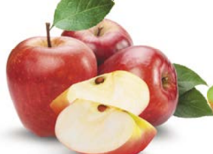
ЯБЛОКИ КРАСНЫЕ, 1 кг