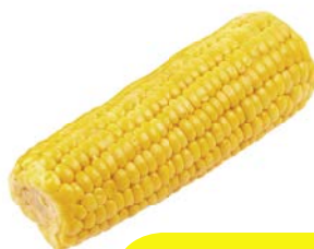
КУКУРУЗА вареная, в в/у, 1 початок (250 г).