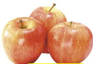
ЯБЛОКИ ГАЛА, 1 кг