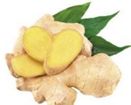
КОРЕНЬ ИМБИРЯ, 1 кг