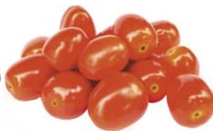
ТОМАТЫ ЧЕРРИ СЛИВКИ Мини 1 уп. (250 г)