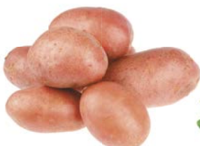
КАРТОФЕЛЬ, красный, 1 кг