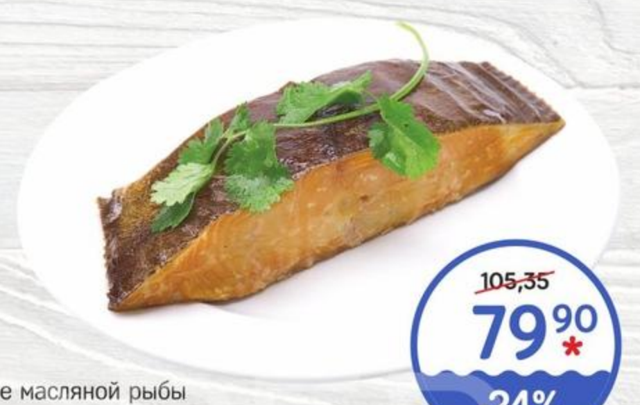
Филе масляной рыбы холодного копчения 100г