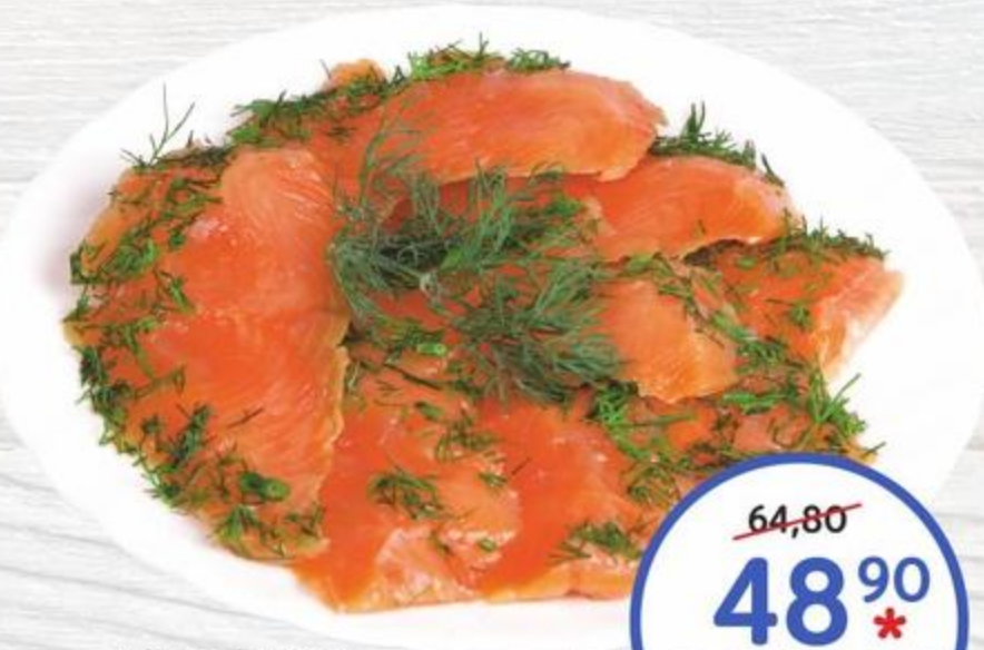
Филе горбуши слабосоленное с укропом 100г