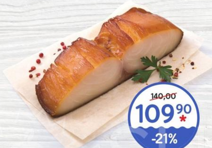
Палтус горячего копчения 100г