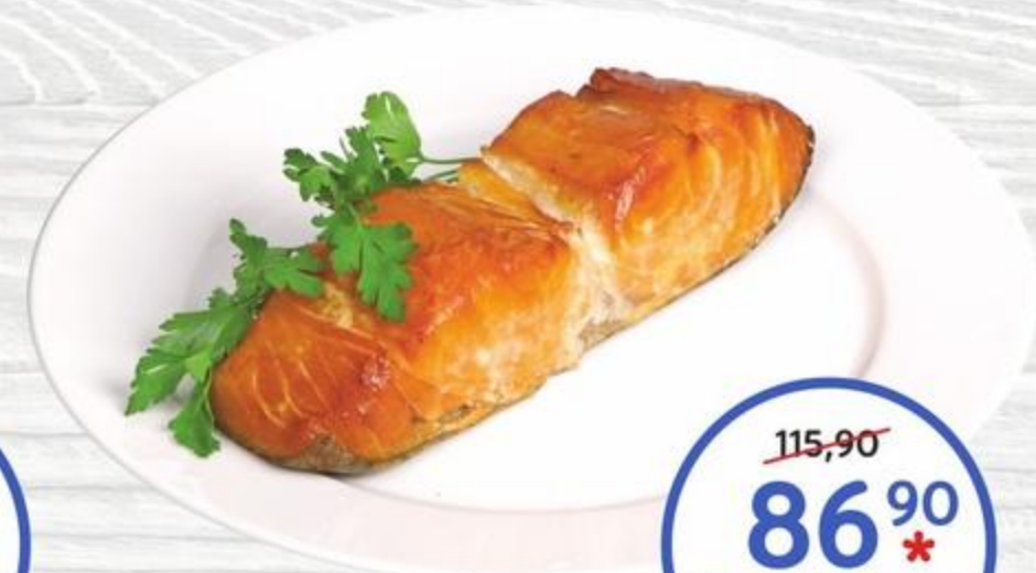
Филе масляной рыбы горячего копчения 100г