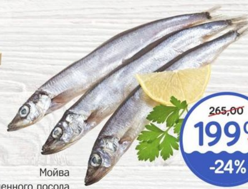
Мойва фирменного посола 1кг