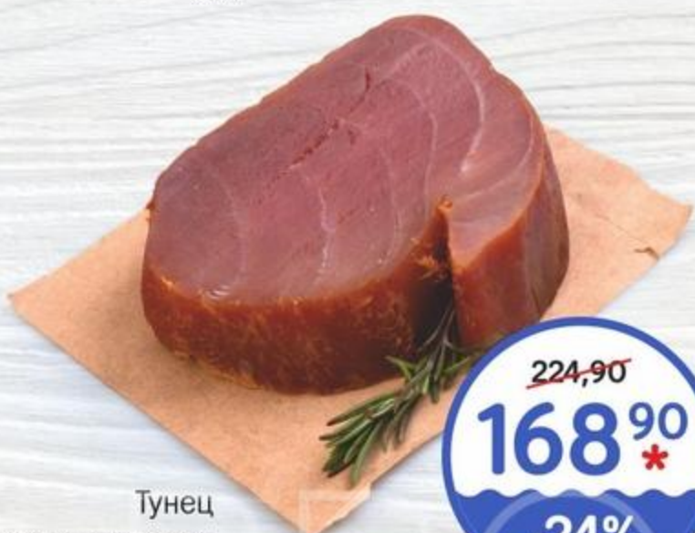
Тунец холодного копчения 100г