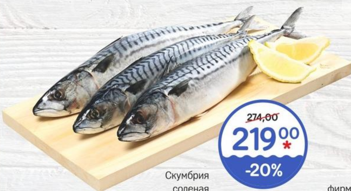
Скумбрия соленая 1кг