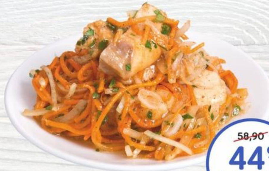
Масляная рыба в остром маринаде 100г