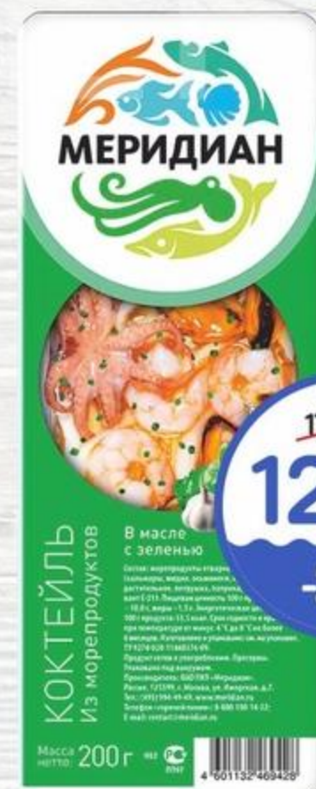
Коктейль из морепродуктов Меридиан в масле с зеленью 200г