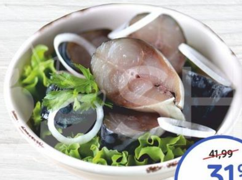
Скумбрия с луком и перцем слабосоленая 100г