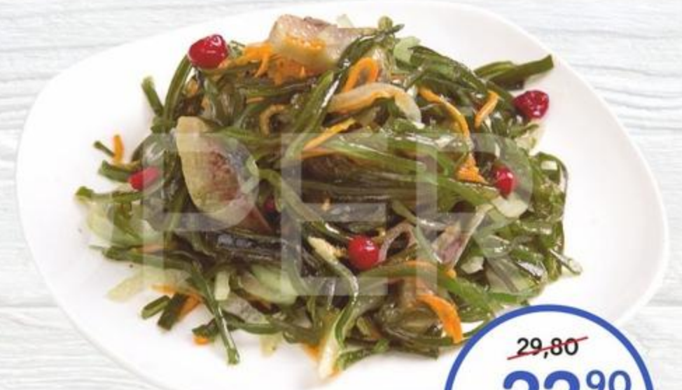
Салат из морской капусты с сельдью 100г