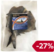
Камбала РЫБА-ХИТ , вяленая, 100 г