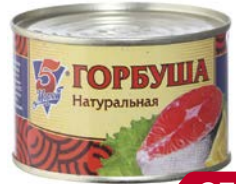
Горбуша 5 МОРЕЙ , натуральная, 245 г