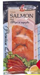
Форель ДИВНЫЙ БЕРЕГ , соленая, ломтики, 100 г