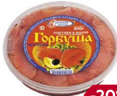
Горбуша ДИВНЫЙ БЕРЕГ , филе кусочки в масле, 200 г