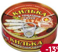
КИЛЬКА , обжаренная, в томатном соусе (РКЗ Вкусные консервы ООО), 240 г