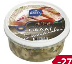
Сельдь САЛАТ ПО-СКАНДИНАВСКИ , в маринаде (Балтийский берег), 180 г