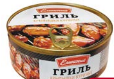
Крылья куриные ЕЛИНСКИЙ ГРИЛЬ , 200 г