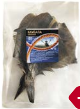
Камбала РЫБА-ХИТ , вяленая, 100 г