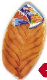
Горбуша ОКЕАН , филе кусочки в масле, 250 г