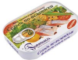
Сельдь атлантическая РАПТИКА , филе-кусочки в пряной заливке, 115 г