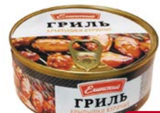
Крылья куриные ЕЛИНСКИЙ ГРИЛЬ , 200 г