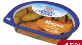
Мидии ВИЧИ , Маринованные, в масле, 200 г