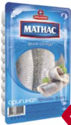
Филе сельди МАТИАС , Оригинал (Санта-Бремор), 250 г