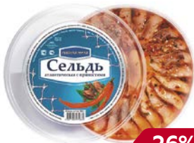
Сельдь РЫБНАЯ МИЛЯ , Филе кусочки в масле с пряностями, 180 г