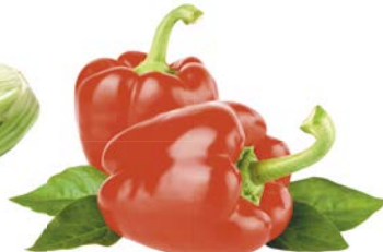
ПЕРЕЦ КРАСНЫЙ, 1 кг