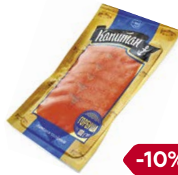
Горбуша КАПИТАН соленая, ломтики, 100 г