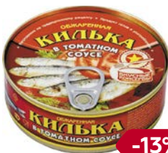
КИЛЬКА , обжаренная, в томатном соусе (РКЗ Вкусные консервы ООО), 240 г