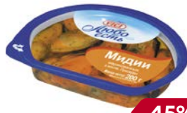
Мидии ВИЧИ , Маринованные, в масле, 200 г