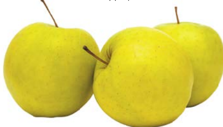
ЯБЛОКИ ГОЛДЕН, 1 кг