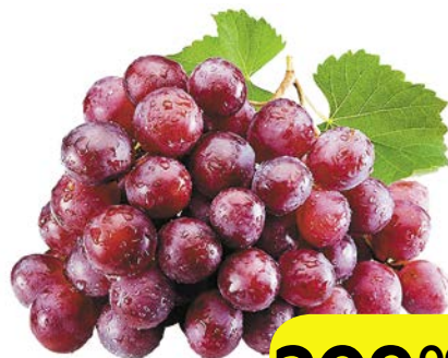
ВИНОГРАД РЕД ГЛОБ, красный, 1 кг