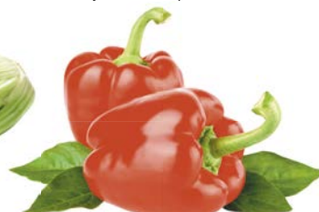
ПЕРЕЦ КРАСНЫЙ, 1 кг