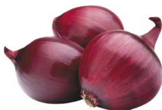
ЛУК РЕПЧАТЫЙ, красный, 1 кг