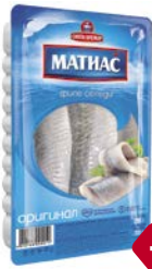
Филе сельди МАТИАС , Оригинал (Санта-Бремор), 250 г