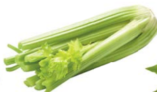
СЕЛЬДЕРЕЙ СТЕБЛЬ, 1 уп. (300-600 г)