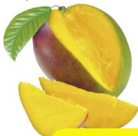
МАНГО, 1 шт.