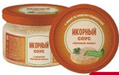
Соус ИКОРНЫЙ , Копченый лосось (Европром), 180 г