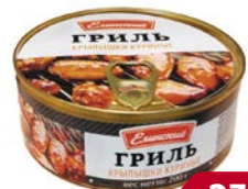
Крылья куриные ЕЛИНСКИЙ Гриль, 200 г