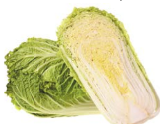
КАПУСТА ПЕКИНСКАЯ, 1 кг