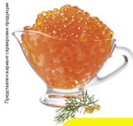
ИКРА лососевая, зернистая, 90 г

Представлены варианты сервировки продукции