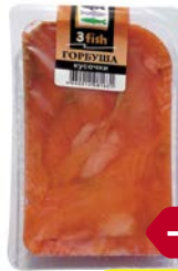
Горбуша ТРИ ФИШ , слабосоленая, филе кусочки для бутерброда, 80 г