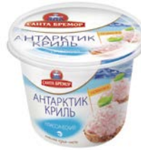
Паста из морепродуктов АНТАРКТИК КРИЛЬ , Классическая, 150 г