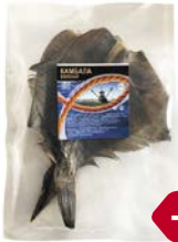
Камбала РЫБА-ХИТ , вяленая, 100 г