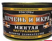
ПЕЧЕНЬ И ИКРА МИНТАЯ , Натуральные, (Полинет ООО), 230 г