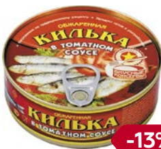
КИЛЬКА , обжаренная, в томатном соусе (РКЗ Вкусные консервы ООО), 240 г