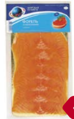
Форель МОРСКАЯ ПЛАНЕТА , Слабосоленая, нарезка, 120 г