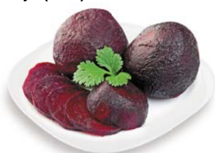
СВЕКЛА, вареная, в в/у, 1 уп. (500 г)