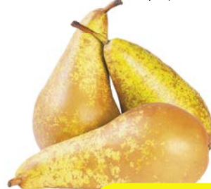
ГРУША КОНФЕРЕНЦИЯ, 1 кг