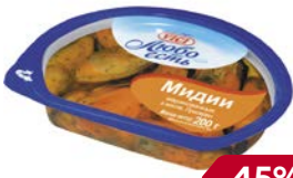
Мидии ВИЧИ , Маринованные, в масле, 200 г