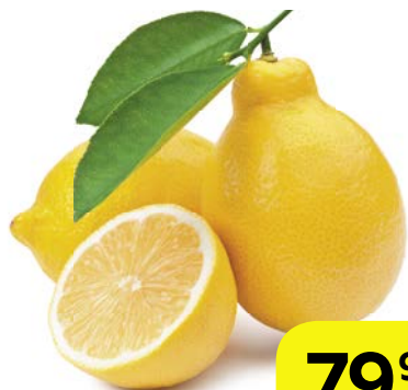
ЛИМОНЫ, 1 кг