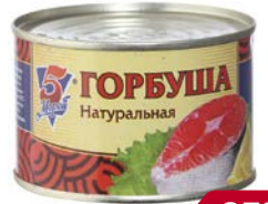
Горбуша 5 МОРЕЙ , натуральная, 245 г