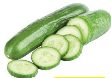
ОГУРЦЫ ГЛАДКИЕ, 1 уп. (600 г)