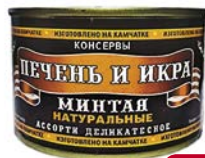
ПЕЧЕНЬ И ИКРА МИНТАЯ , Натуральные, (Полинет ООО), 230 г