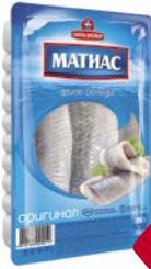
Филе сельди МАТИАС , Оригинал (Санта-Бремор), 250 г