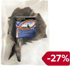
Камбала РЫБА-ХИТ , вяленая, 100 г