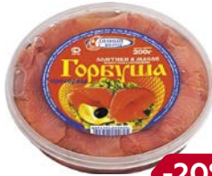
Горбуша ДИВНЫЙ БЕРЕГ , филе кусочки в масле, 200 г