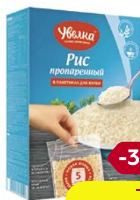
Рис УВЕЛКА , Длиннозерный, шлифованный, 5 пакетиков x 80 г