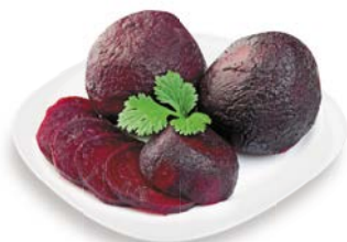
СВЕКЛА, вареная, в в/у, 1 уп. (500 г)