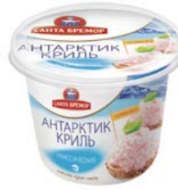
Паста из морепродуктов АНТАРКТИК КРИЛЬ , Классическая, 150 г