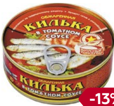
КИЛЬКА , обжаренная, в томатном соусе (РКЗ Вкусные консервы ООО), 240 г