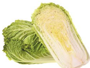
КАПУСТА ПЕКИНСКАЯ, 1 кг