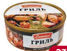
Крылья куриные ЕЛИНСКИЙ Гриль, 200 г