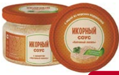
Соус ИКОРНЫЙ , Копченый лосось (Европром), 180 г