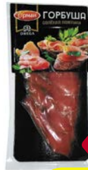
Горбуша ГУРМАН слабосоленая филе ломтики, 100 г