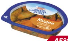
Мидии ВИЧИ , Маринованные, в масле, 200 г