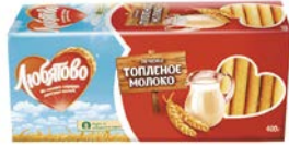
Печенье ЛЮБИТОВО, Топленое молоко, 400 г