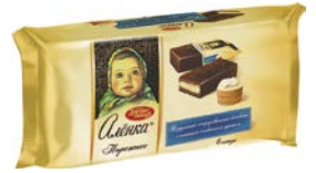
Пирожное бисквитное АЛЕНКА, 240 г