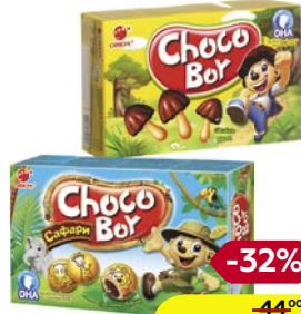
Печенье ЧОКО БОЙ, Грибочки, 45 г/ Сафари, 42 г