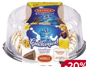
Торт МИРЕЛЬ Сметанин, 800 г