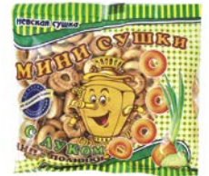
Сушки мини ЧИП&ПОЛИНКИ, с луком, 200 г