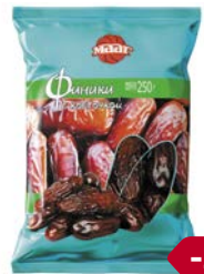
Финики МААГ, С косточкой, 250 г