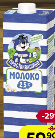
Молоко ПРОСТОКВАШИНО, стерилизованное, 2,5% (Юнимилк), 950 мл