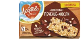
Печенье-мюсли ЛЮБИТОВО, Шоколад/ Клюква-изюм, 120 г