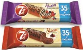
Рулет 7ДЭЙЗ с кремом какао/с кремом лесные ягоды, 300 г