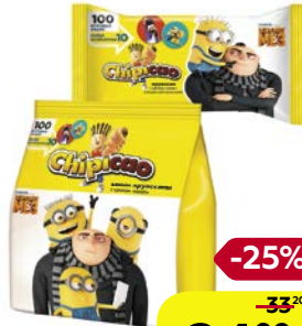
Круассаны ЧИПКАО, Мини, крем Какао, 50 г/ Крем Какао, 60 г