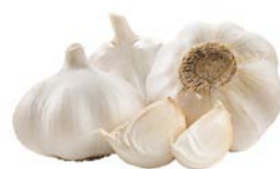
ЧЕШОК, 1 уп. (3 шт.)