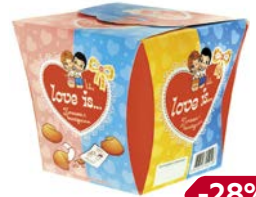
Печенье LOVE IS с предсказанием удачи, 42 г