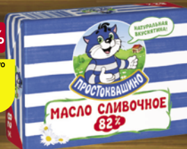
Масло сливочное ПРОСТОКВАШИНО, 82%, 180 г