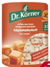
Хлебцы ДОКТОР КЁРNER, Кукурузно-рисовые карамельные, 90 г