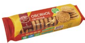
Печенье овсяное ХЛЕБНЫЙ СПАС, Особое, 250 г