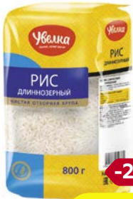
Рис УВЕЛКА , длиннозерный, класси- ческий, 800 г