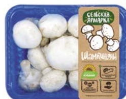
ШАМПИЬОНЫ ФАСОВАННЫЕ, Сельская ярмарка, 1кг