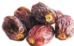
ФИНИКИ, 1 уп. (200 г)