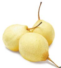
ГРУША КИТАЙСКАЯ, 1кг