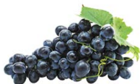
ВИНОГРАД ЧЕРНЫЙ, 1кг