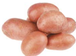
КАРТОФЕЛЬ, красный, 1кг