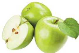
ЯБЛОКИ ГРЕННИ СМИТ, 1кг