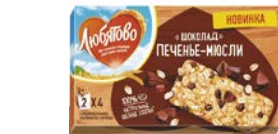
Печенье-мюсли ЛЮБЯТОВО, Шоколад/ Клюква-изюм, 120 г