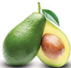
АВОКАДО, 1 шт.