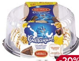
Торт МИРЕЛЬ Сметанин, 800 г