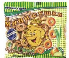
Сушки мини ЧИП&ПОЛИНКИ, с луком, 200 г