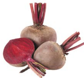
СВЕКЛА, 1 уп. (1 кг)