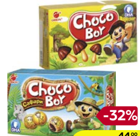
Печенье ЧОКО БОЙ, Грибочки, 45 г/ Сафари, 42 г