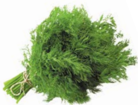
УКРОП, 1 уп. (100 г)