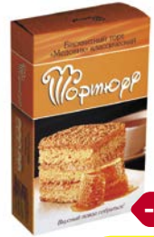
Торт бисквитный ТОРТЮФФ, Медо- вик, классический, 360 г