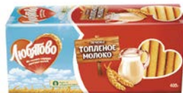
Печенье ЛЮБЯТОВО, Топленое молоко, 400 г