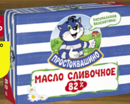
Масло сливочное ПРОСТОКВАШИНО, 82%, 180 г