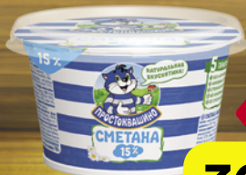
Сметана ПРОСТОКВАШИНО, 15%, 180 г