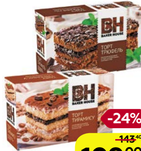
Торт БЕЙКЕР ХАУС, Бисквитный: Тирамису/ Трюфель, 350 г