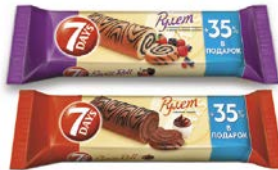
Рулет 7ДЭЙЗ с кремом какао/ с крем- ом лесные ягоды, 300 г