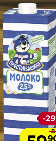
Молоко ПРОСТОКВАШИНО, стерилизованное, 2,5% (Юнимилк), 950 мл