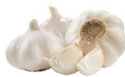
ЧЕШОК, 1 уп. (3 шт.)