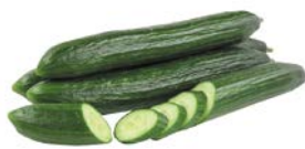
ОГУРЦЫ ДЛИННОПЛОДНЫЕ, 1 шт. (250 г)