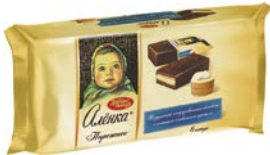
Пирожное бисквитное АЛЕНКА, 240 г