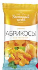
Абрикосы сушеные ВОСТОЧНЫЙ ГОСТЬ, 200 г