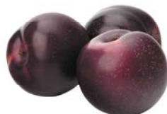
СЛИВА, 1 кг