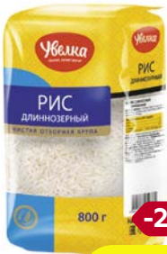
Рис УВЕЛКА , длиннозерный, классический, 800 г