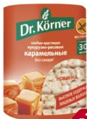
Хлебцы ДОКТОР КЁРНЕР, Кукурузно- рисовые карамельные, 90 г