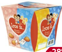
Печенье LOVE IS с предсказанием удачи, 42 г