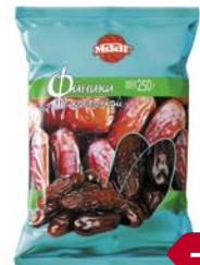
Финики МААГ, С косточкой, 250 г