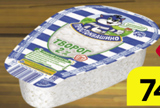
Творог ПРОСТОКВАШИНО, 2%, 220 г