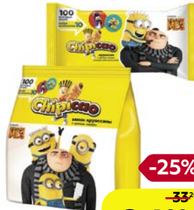
Круассаны ЧИПИКАО, Мини, крем Какао, 50 г/ Крем Какао, 60 г