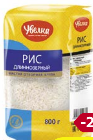
Рис УВЕЛКА , длиннозерный, классический, 800 г