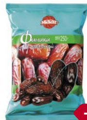
Финики МААГ, С косточкой, 250 г