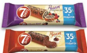
Рулет 7ДЭЙЗ с кремом какао/ с кремом лесные ягоды, 300 г