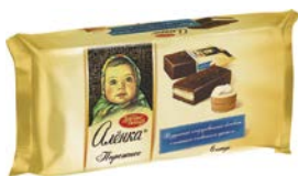
Пирожное бисквитное АЛЕНКА, 240 г