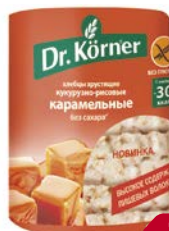
Хлебцы ДОКТОР КЁРНЕР, Кукурузно- рисовые карамельные, 90 г