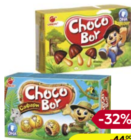
Печенье ЧОКО БОЙ, Грибочки, 45 г/ Сафари, 42 г