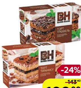
Торт БЕЙКЕР ХАУС, Бисквитный: Тирамису/ Трюфель, 350 г