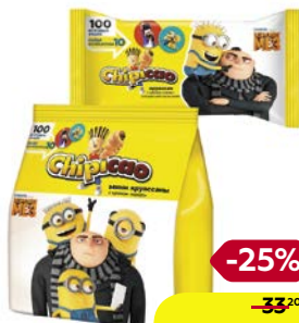
Круассаны ЧИПИКАО, Мини, крем Какао, 50 г/ Крем Какао, 60 г