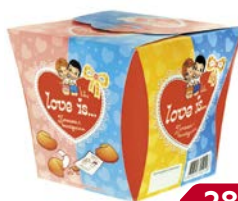
Печенье LOVE IS с предсказанием удачи, 42 г