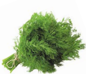
УКРОП, 1 уп. (100 г)