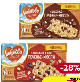
Печенье-мюсли ЛЮБИТОВО, Шоколад/ Клюква-изюм, 120 г