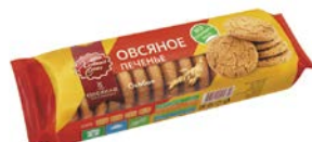
Печенье овсяное ХЛЕБНЫЙ СПАС, Особое, 250 г