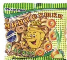
Сушки мини ЧИП&ПОЛИНКИ, с луком, 200 г