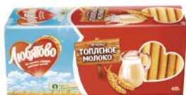
Печенье ЛЮБИТОВО, Топленое молоко, 400 г