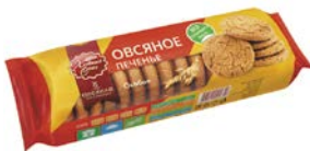
Печенье овсяное ХЛЕБНЫЙ СПАС, Особое, 250 г