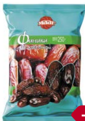
Финики МААГ, С косточкой, 250 г