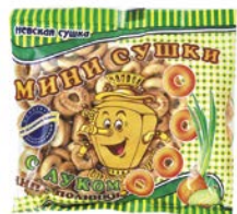
Сушки мини ЧИП&ПОЛИНКИ, с луком, 200 г