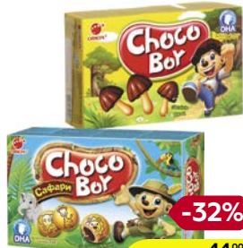
Печенье ЧОКО БОЙ, Грибочки, 45 г/ Сафари, 42 г