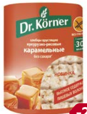
Хлебцы ДОКТОР КЁРНЕР, Кукурузно-рисовые карамельные, 90 г