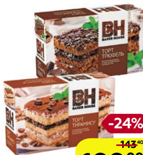
Торт БЕЙКЕР ХАУС, Бисквитный: Тирамису/ Трюфель, 350 г