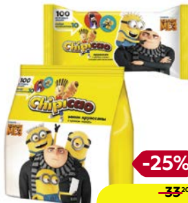
Круассаны ЧИПИКАО, Мими, крем Какао, 50 г/ Крем Какао, 60 г