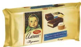
Пирожное бисквитное АЛЕНКА, 240 г