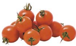
ТОМАТЫ ЧЕРРИ, 1 уп. (250 г)