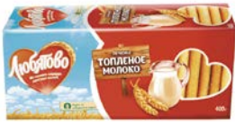
Печенье ЛЮБИТОВО, Топленое молоко, 400 г