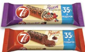
Рулет 7ДЭЙЗ с кремом какао/ с кремом лесные ягоды, 300 г