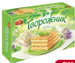
Торт ТВОРОЖНИК, Творожно- йогуртовый, 400 г