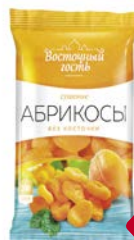
Абрикосы сушеные ВОСТОЧНЫЙ ГОСТЬ, 200 г