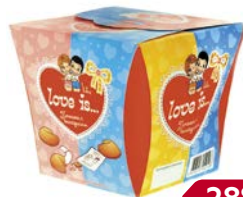
Печенье LOVE IS с предсказанием удачи, 42 г