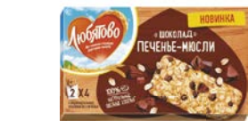
Печенье-мюсли ЛЮБИТОВО, Шоколад/ Клюква-изюм, 120 г