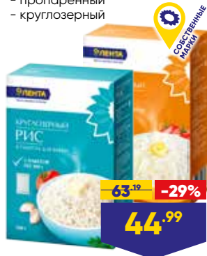
РИС ЛЕНТА, в пакетиках для варки, 100 г x 5 пак. в уп.: - пропаренный - круглозерный