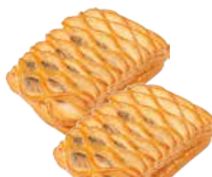
СЛОЙКА С МЯСОМ, 100 г