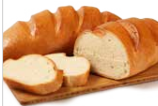
ХЛЕБ БАЛТИЙСКИЙ, 400 г