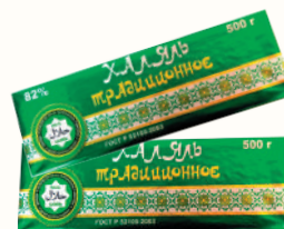
СПРЕД "ХАЛЯЛЬ ТРАДИЦИОННОЕ" РАСТИТЕЛЬНО-ЖИРОВОЙ 82%, 500 ГР