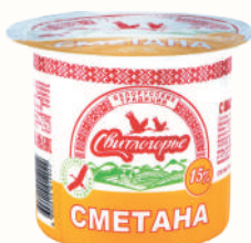
СМЕТАНА "СВИТЛОГОРЬЕ" 15%, 380 ГР