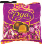
КОНФЕТЫ "РУА" ПАЗИР., 1 КГ