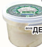
ПРОДУКТ МОЛОЧНЫЙ "ДЕРЕВЕНСКОЕ ПОДВОРЬЕ" 9%, 800 ГР