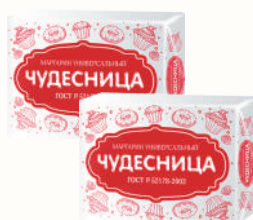
МАРГАРИН "ЧУДЕСНИЦА" УНИВЕРСАЛЬНЫЙ 55%, 180 ГР