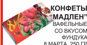
КОНФЕТЫ "МАДЛЕН" ВАФЕЛЬНЫЕ СО ВКУСОМ ФУНДУКА 8 МАРТА, 250 ГР