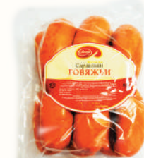
САРДЕЛЬКИ "ГОВЯЖЬИ" ОХЛ., АНКОМ, 1 КГ