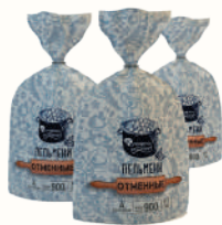
ПЕЛЬМЕНИ "ОТМЕННЫЕ" "КУЛИНАРНЫЕ РЕШЕНИЯ" КАТ. А, 900 ГР