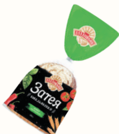
ХЛЕБ "ЗАТЯ" ИТАЛЬЯНСКАЯ "ДАРНИЦА", 350 ГР