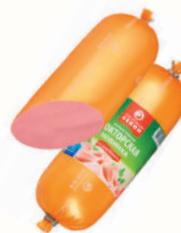
КОЛБАСА "ДОКТОРСКАЯ" НОВИНКА ВНМД, ВАР., 400 ГР