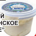
ПРОДУКТ МОЛОЧНЫЙ "ДЕРЕВЕНСКОЕ ПОДВОРЬЕ" 18%, 800 ГР