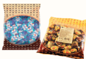
КАРАМЕЛЬ "ЛАКОМКА-СУПЕРМОЛОЧНАЯ", "ЛАКОМКА-СУПЕРКАКАО" С ЖЕЛЕЙНОЙ НАЧИНКОЙ, 250 ГР