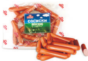
СОСИСКИ "ВЕНСКИЕ" ОХЛ., САВА, 1 КГ