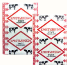
СПРЕД "КРЕСТЬЯНСКОЕ" РАСТИТЕЛЬНО-ЖИРОВОЙ, 60%, 180 ГР