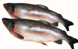
ГОРБУША С/М, 1 КГ