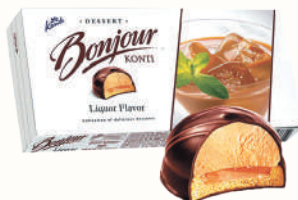
ДЕСЕРТ "БОНЖУР СУФЛЕ" ЛИКЕР, 232 ГР