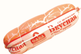
КОЛБАСА "ВКУСНАЯ СО ШПИКОМ" ВАР., САВА, 1 КГ