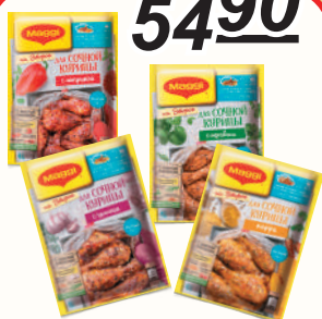
ПРИПРАВА "МАГГИ" ДЛЯ СОЧНОЙ КУРИЦЫ С ПАПРИКОЙ; С ТРАВАМИ; С ЧЕСНОКОМ; СОЧНОЙ КУРИЦЫ КАРРИ, 26-38 ГР