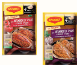
ПРИПРАВА "МАГГИ" ДЛЯ НЕЖНОГО ФИЛЕ КУРИНОЙ ГРУДКИ ПО-ИТАЛЬЯНСКИ; С ЧЕСНОКОМ И ТРАВАМИ, 30,6 ГР