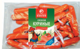
СОСИСКИ "КУРИНЫЕ" ОХЛ., ВНМД, 1 КГ