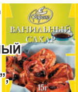
ВАНИЛЬНЫЙ САХАР "ФАРСИС" , 15 ГР