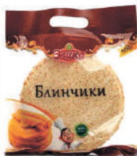
БЛИНЧИКИ БЕЗ НАЧИНКИ "ЭЛИКА", 500 ГР Продажа только на Косыгина, 21