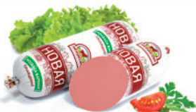
КОЛБАСА "НОВАЯ" САВА, ВАР., 1 КГ