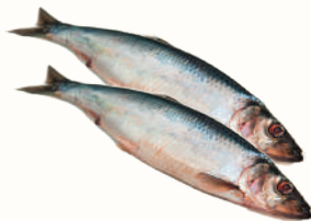
СЕЛЬДЬ С/М, 1 КГ