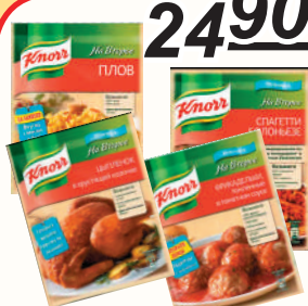
ПРИПРАВА "КНОРР" ДЛЯ ПРИГОТОВЛЕНИЯ ПЛОВА; СПАГЕТТИ БОЛОНЬЕЗЕ; ФРИКАДЕЛЕК В ТОМАТ. СОУСЕ; ЦЫПЛЕНКА В ХРУСТ. КОРОЧКЕ, 25-44 ГР