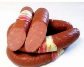
КОЛБАСА "ОДЕССКАЯ" П/К, АНКОМ, 1 КГ