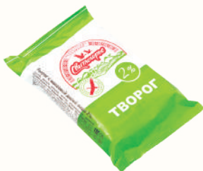
ТВОРОГ "СВИТЛОГОРЬЕ" 2%, 180 ГР