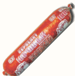
СЕРВЕЛАТ "НАРОДНЫЙ" ЕВРОКОМ, В/К, 1 КГ