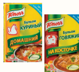
БУЛЬОН "КНОРР" КУРИНЫЙ ДОМАШНИЙ; ГОВЯЖИЙ НА КОСТОЧКЕ 8X10 ГР, 80 ГР