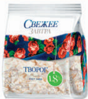
ТВОРОГ "СВЕЖЕЕ ЗАВТРА", 1,8%, 400 ГР