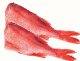
ОКУНЬ МОРСКОЙ Б/Г С/М, 1 КГ