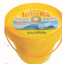
СМЕСЬ ТОПЛЕНАЯ "ХАЛЯЛЬ ТОПЛЕНОЕ" РАСТ.-ЖИРОВАЯ 99,7%, 800 ГР