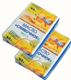
МАСЛО "СЛИВОЧНОЕ" РАСТИТЕЛЬНО-СЛИВОЧНОЕ 80%, 180 ГР