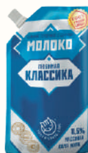
МОЛОКО СГУЩЕННОЕ "ЛЮБИМАЯ КЛАССИКА" ЦЕЛЬНОЕ С САХАРОМ 8,5%, 270 ГР