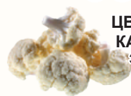
ЦВЕТНАЯ КАПУСТА ЗАМ., 1 КГ