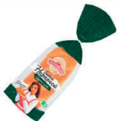
БАТОН "АЛАДУШКИН" НАРЕЗНОЙ "ДАРНИЦА", 350 ГР