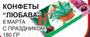
КОНФЕТЫ "ЛЮБАВА" 8 МАРТА С ПРАЗДНИКОМ, 180 ГР