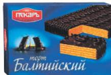
ТОРТ ВАФЕЛЬНЫЙ "БАЛТИЙСКИЙ" ГЛАЗИРОВАННЫЙ КОНДИТ. ГЛАЗУРЬЮ, 320 ГР