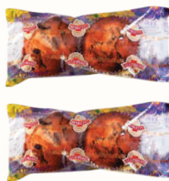
КЕКС "СТОЛИЧНЫЙ" "ДАРНИЦА", 2 ШТ. X 75 ГР