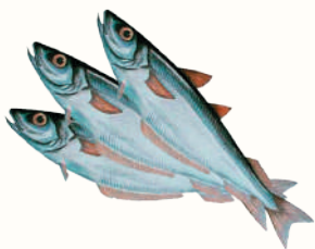
ПУТАССУ С/М, 1 КГ