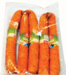
КОЛБАСА "СВИНАЯ" П/К, ВНМД, 1 КГ Продажа только на Косыгина, 21