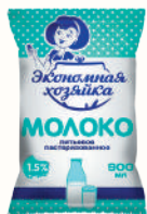
МОЛОКО ПИТЬЕВОЕ "ЭКОНОМНАЯ ХОЗЯЙКА" 1,5%, 900 ГР