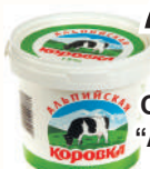
ПРОДУКТ СМЕТАННЫЙ "АЛЬПИЙСКАЯ КОРОВКА" 15%, 900 ГР