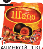
КОНФЕТЫ "ШАДО ВИШНЕВОЕ" , С ЖЕЛЕЙНОЙ НАЧИНКОЙ, 1 КГ