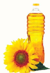
МАСЛО ПОДСОЛНЕЧНОЕ РАФ., ДЕЗ., 0,8-0,9 Л