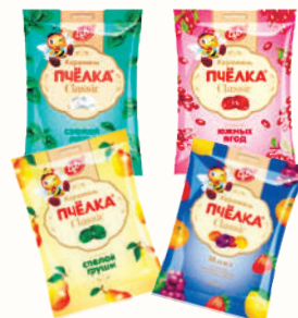
КАРАМЕЛЬ ЛЕДЕНЦОВАЯ "ПЧЁЛКА" В АССОРТИМЕНТЕ, 180 ГР