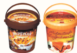
СГУЩЕНКА "ВАРЕНАЯ С САХАРОМ" 12%, 950 ГР; "МЯГКАЯ КАРАМЕЛЬ" 5%, 950 ГР