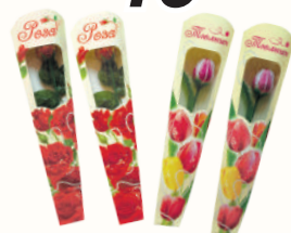
ИЗДЕЛИЕ ФИГУРНОЕ ИЗ КОНДИТЕРСКОЙ ГЛАЗУРИ НА ПАЛОЧКЕ В АССОРТИМЕНТЕ, 20 ГР