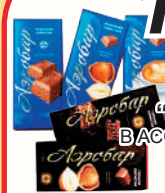
ШОКОЛАД "АЭРОБАР" В АССОРТИМЕНТЕ, 65 ГР