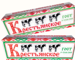
СПРЕД "КРЕСТЬЯНСКОЕ" РАСТИТЕЛЬНО-ЖИРОВОЙ, 60%, 450 ГР