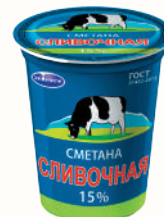
СМЕТАНА "СЛИВОЧНАЯ" 15%, 400 ГР