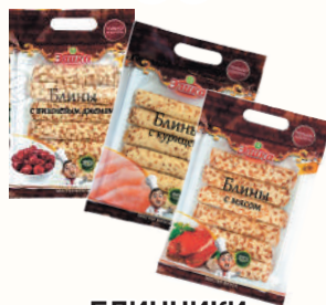
БЛИНЧИКИ С НАЧИНКОЙ "ЭЛИКА", В АССОРТИМЕНТЕ, 420 ГР Продажа только на Косыгина, 21