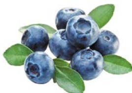
ГОЛУБИКА, 1уп. (125г)