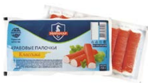
Палочки крабовые КЛАССИКА , охлажденные (Мирамар), 200 г