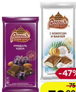
Шоколад РОССИЯ , в ассортименте***, 90 г/82 г