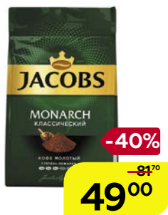
Кофе ЯКОБС, Монарх, жареный, в зернах, 230 г