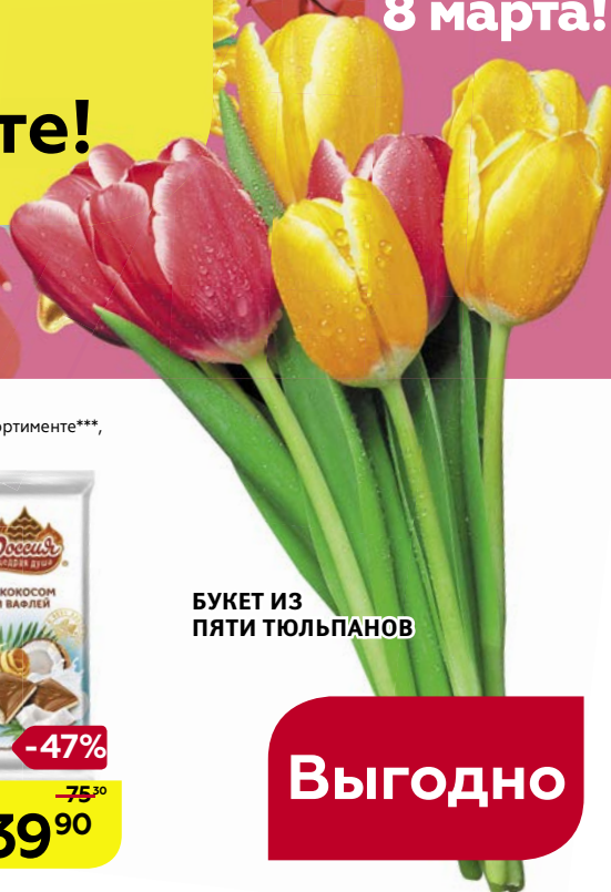
БУКЕТ ИЗ ПЯТИ ТЮЛЬПАНОВ