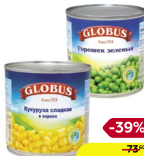
ГЛОБУС , Горошек зеленый, Нежный/Кукуруза сладкая, в зернах, 425 мл