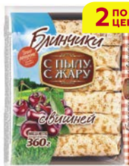
Блинчики С ПЫЛУ С ЖАРУ , с вишней, 360 г