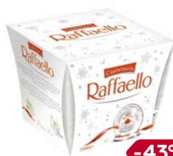
Конфеты РАФФАЭЛЛО , 150 г