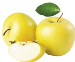
ЯБЛОКИ ГОЛДЕН, 1кг