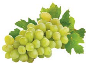
ВИНОГРАД БЕЛЫЙ, 1кг