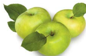
ЯБЛОКИ СИМИРЕНКО, 1кг