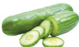
ОГУРЦЫ ГЛАДКИЕ, 1уп. (600г)