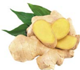
КОРЕНЬ ИМБИРЯ, 1кг