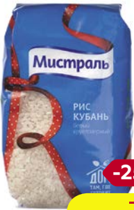
Рис МИСТРАЛЬ , Кубань, 900 г