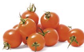
ТОМАТЫ ЧЕРРИ, 1уп. (500г)