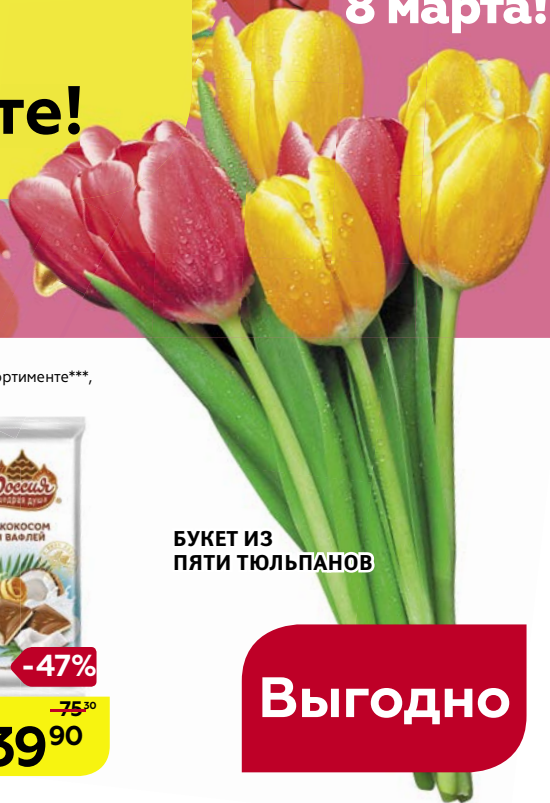
БУКЕТ ИЗ ПЯТИ ТЮЛЬПАНОВ