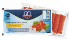
Палочки крабовые КЛАССИКА, охлажденные (Мирамар), 200 г