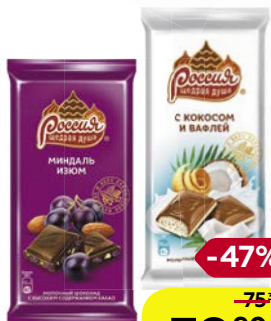
Шоколад РОССИЯ, в ассортименте**, 90 г/ 82 г