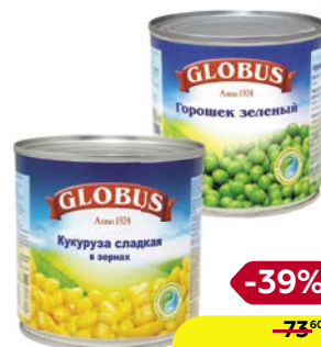
ГЛОБУС, Горошек зеленый, Нежный/ Кукуруза сладкая, в зернах, 425 мл