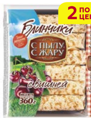
Блинчики С ПЫЛУ С ЖАРУ, с вишней, 360 г