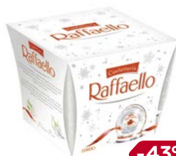
Конфеты РАФФАЭЛЛО, 150 г