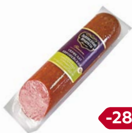
Сервелат ЕВРОПЕЙСКИЙ , Заповедные продукты, Варено-копченый (Дмитровские колбасы), 400 г