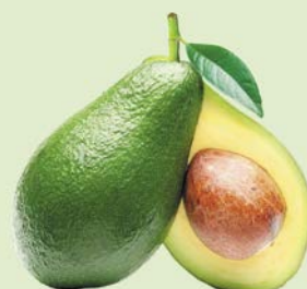
АВОКАДО, 100 г