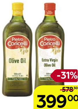
Масло оливковое ПЬЕТРО КОРИЧЕЛЛИ рафинированное/ экстра верджин, 500 мл