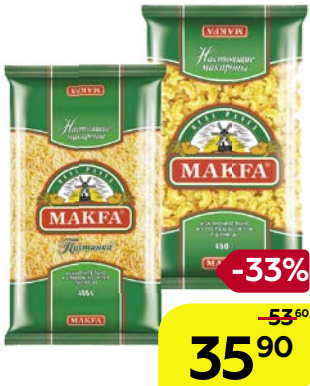
Макаронные изделия МАКФА ®, Макароны длинные, 500 г; Вермишель, Короткая тонкая/ Спираль/ Петушиные грешки/ Улитки, 450 г