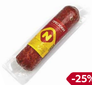
Колбаса ПРЕСИЖН , По-останкински, сырокопченая (ОМПК), 250 г