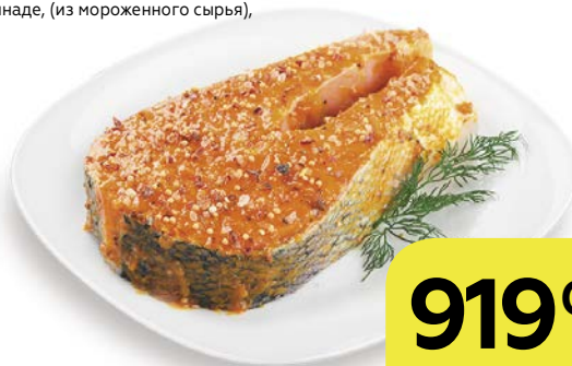
Полуфабрикат из рыбы СТЕЙК ИЗ ЛОСОСЯ, в маринаде, (из мороженого сыра), 1 кг