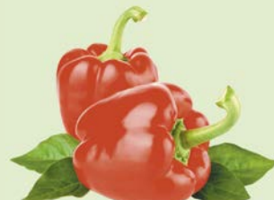
ПЕРЕЦ КРАСНЫЙ, 1кг