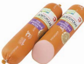
Колбаса ДОКТОРСКАЯ , ГОСТ (МД Бородина), 100 г