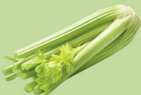
СЕЛЬДЕРЕЙ СТЕБЕЛЬ, 1 уп. (300-600 г)