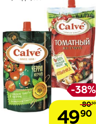
Кетчуп КАЛЬВЕ , Бразильский/ Томатный/ Черри, 350 г