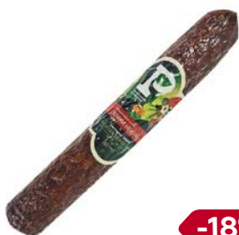
Салями НЕЖНАЯ , из мяса птицы, сырокопченая, мини (Раменский), 100 г