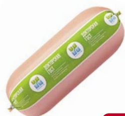
Колбаса ДОКТОРСКАЯ , Украина (Богородский МД), 100 г