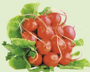
РЕДИС, 1 уп. (500 г)