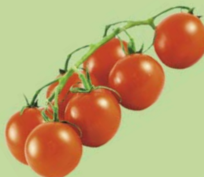
ТОМАТ ЧЕРРИ коктейль, 1 уп. (450г)