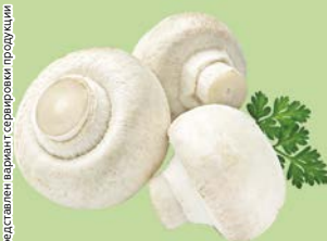
ШАМПИНЬОНЫ Сельская Ярмарка, 1кг

Представлен вариант сервировки продукции