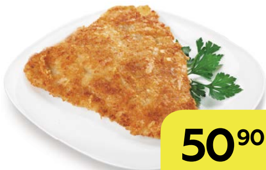
Рыба БАТЕРФЛЯЙ, жареная, 100 г