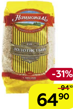
Рис НАЦИОНАЛЬ , Золотистый, 900 г