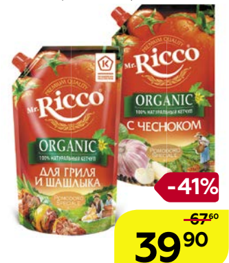
Кетчуп МИСТЕР РИККО , Помodoro Специале: Для гриля и шашлыка/ Томатный/ С чесноком, 350 г