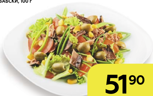
Салат ПО-ШВАБСКИ, 100 г