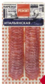
Колбаса ИТАЛЬЯНСКАЯ , Классик, сырокопченая, нарезка (Ремит), 70 г