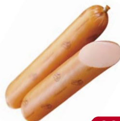
Колбаса ДОКТОРСКАЯ (Мясницкий ряд), 100 г