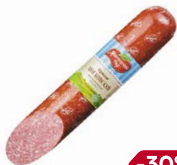
Сервелат МОСКОВСКИЙ , Варено-копченый (Мясницкий ряд), 100 г