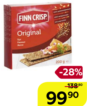
Сухарики ржаные ФИНН КРИСП , Ориджинал, 200 г