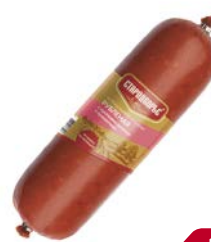
Колбаса РУБЛЕНАЯ , Стародворье, варено-копченая (Стародворские колбасы), 350 г