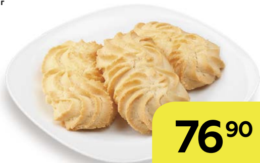
Печенье ВЕНСКОЕ, сдобное 300 г