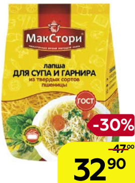
Лапша МАКСТОРИ , Для супа и гарнира, 250 г