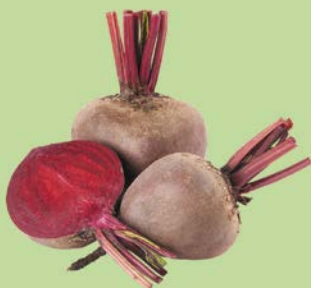
СВЕКЛА, 1уп. (1 кг)