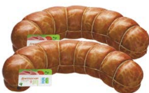
Колбаса ДОКТОРСКАЯ , (Богородский МПЗ), 100 г