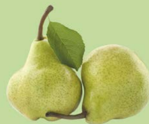
ГРУША ВИЛЬЯМС/ПАКХАМС, 1кг