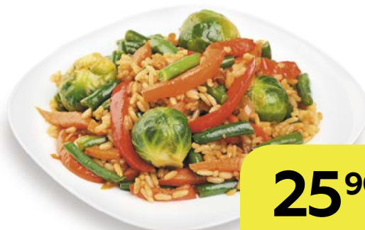
Овощи ПО-ТАЙСКИ, 100 г