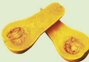
ТЫКВА БАТТЕРНАТ, 1кг