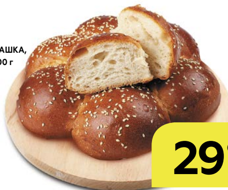
Булочка РОМАШКА, с кунжутом, 300 г