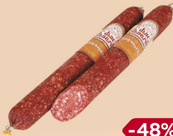
Колбаса ПРЕМЬЕРА , Дым Дымычъ, сырокопченая, мини (Агротэк), 200 г