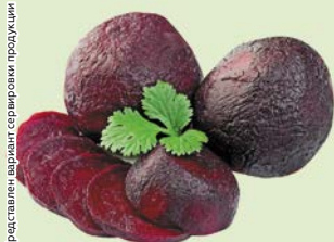
СВЕКЛА вареная, в/у, 1уп. (500 г)