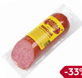
Сервелат ФИНСКИЙ , Папа Может, варено-копченый (ОМПК), 420 г