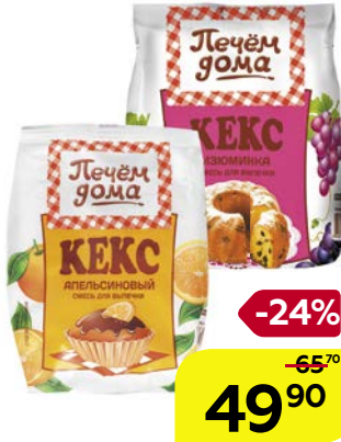
Кекс ПЕЧЕМ ДОМА , апельсиновый/ Изюминка, 400 г