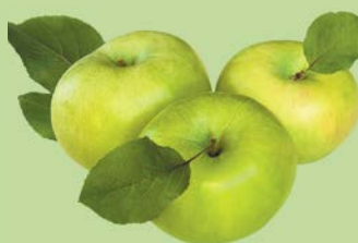
ЯБЛОКИ СИМИРЕНКО, 1кг