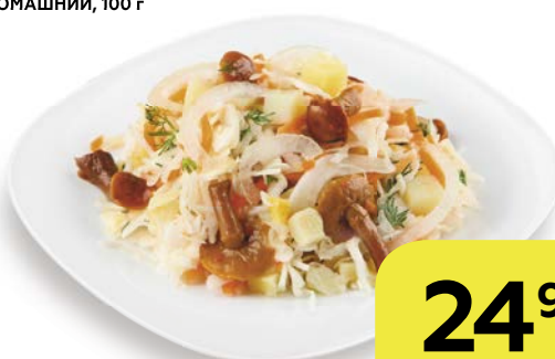
Салат ДОМАШНИЙ, 100 г