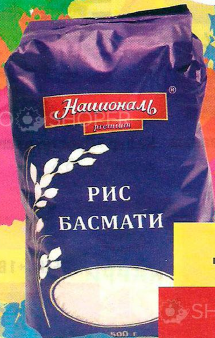
Рис «Басмати», 500г «Националь premium»