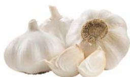
ЧЕСНОК, 1уп. (3 шт.)