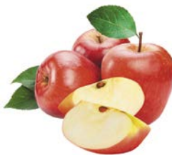
ЯБЛОКИ КРАСНЫЕ, 1кг