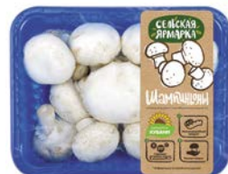
ШАМПИньОНЫ ФАСОВАННЫЕ, Сельская ярмарка, 1кг