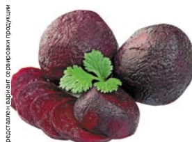
СВЕКЛА вареная, в/у, 1уп. (500 г)

Представлен и маркирует сертифицированную продукцию