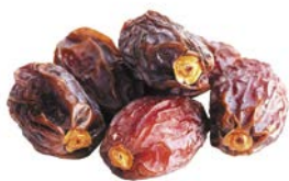
ФИНИКИ, 1уп. (200 г)