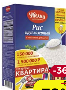
Рис УВЕЛКА , Круглозерный шлифованный, 5 пакетиков x 80 г