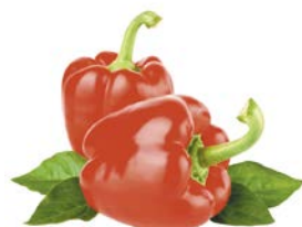
ПЕРЕЦ КРАСНЫЙ, 1кг