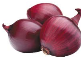
ЛУК РЕПЧАТЫЙ, красный, 1кг