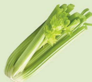
СЕЛЬДЕРЕЙ СТЕБЕЛЬ, 1уп. (300-600 г)