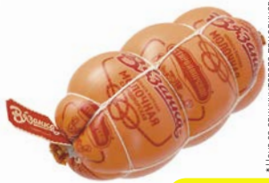
Колбаса МОЛОЧНАЯ, вязанка, мини (Стародворские колбасы), 500 г