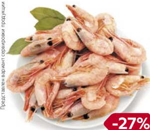
КРЕВЕТКИ, Варено-морожены в панцире, 1кг

Представлен вариант сервировки продукции