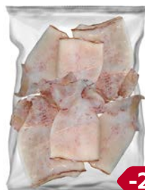
КАЛЬМАР, Тушка, неочищенный свежемороженный, 500г