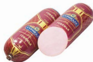
Колбаса ГОВЯЖЬЯ, вареная (Гурман), 100 г