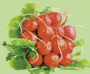
РЕДИС, 1уп. (500 г)