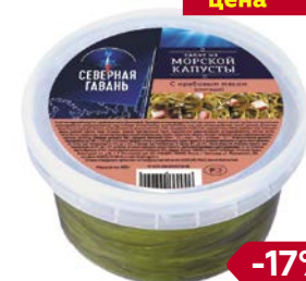
Салат из морской капусты СЕВЕРНАЯ ГАВАНЬ, с крабовым мясом, 400г