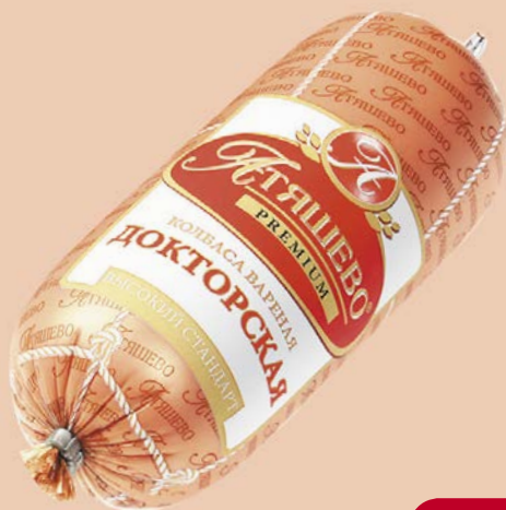
Колбаса ДОКТОРСКАЯ, Премиум, мини (МПК Атышевский), 500 г