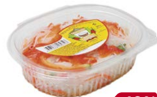
Салат КОРЕЯНА, Фунчоза по-корейски (Сакура), 200 г