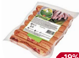
Сосиски БАВАРСКИЕ, Вареные (Чебаркульская птица), 400 г