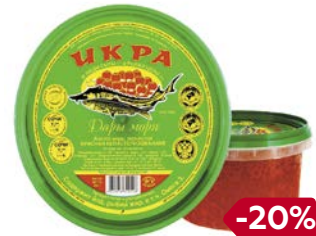
Икра красная ДАРЫ МОРЯ, имитированная, 450г