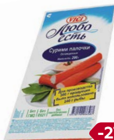
Сурими палочки ВИЧИ, Любо есть, охлажденные, 200г