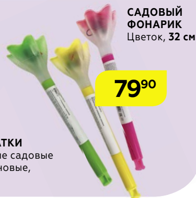
САДОВЫЙ ФОНАРИК Цветок, 32 см