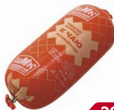
Колбаса К ЧАЮ, Вареная (Ишимский МК), 500 г