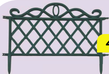
ЗАБОРЧИК САДОВЫЙ, классический, 1 секция