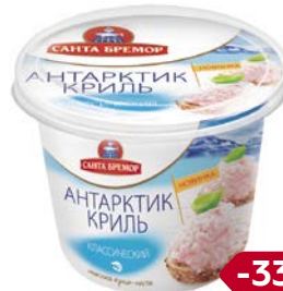
Паста из морепродуктов АНТАРКТИК КРИЛЬ, Классическая, 150г