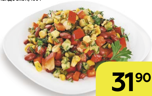
Салат КАЛЕЙДОСКОП , 100 г