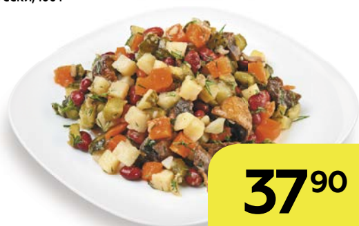
Салат ПО-РУССКИ , 100 г