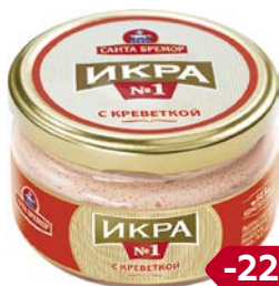
Икра мойвы САНТА БРЕМОР, с креветкой, 180г