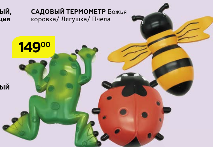
САДОВЫЙ ТЕРМОМЕТР Божья коровка/ Лягушка/ Пчела