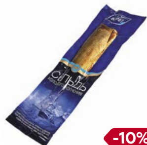
Сельдь БАЛТИЙСКИЙ БЕРЕГ холодного копчения, неразделанная, 260г