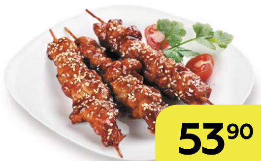
Курица ПО-АЗИАТСКИ , 100 г