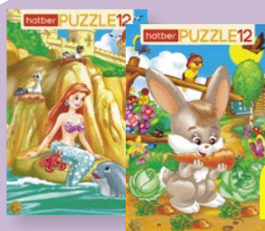
Пазлы 12 ЭЛЕМЕНТОВ, в рамке, 200x300 мм