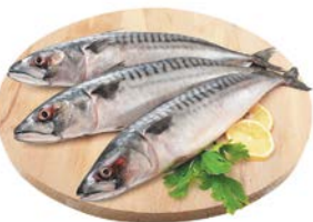
СКУМБРИЯ**, Полуфабрикат из замороженного сырья, 1кг

Представлен вариант сервировки продукции