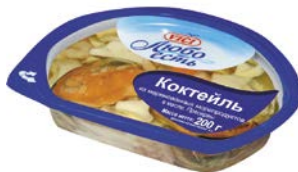
Коктейль из морепродуктов ВИЧИ, В масле, 200г