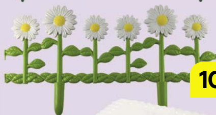
ЗАБОРЧИК САДОВЫЙ Ромашки, 1 секция, 31,5x61,7 см