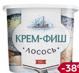
Лосось КРЕМ-ФИШ, 150г