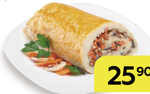
РУЛЕТ КАРТОФЕЛЬНЫЙ С ГРИБАМИ, 100 г