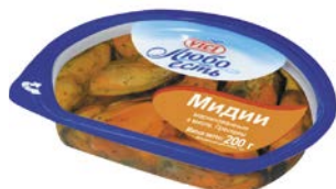
Мидии ВИЧИ, Маринованные, в масле, 200г