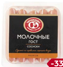
Сосиски МОЛОЧНЫЕ, ГОСТ (ЧМПЗ), 500 г