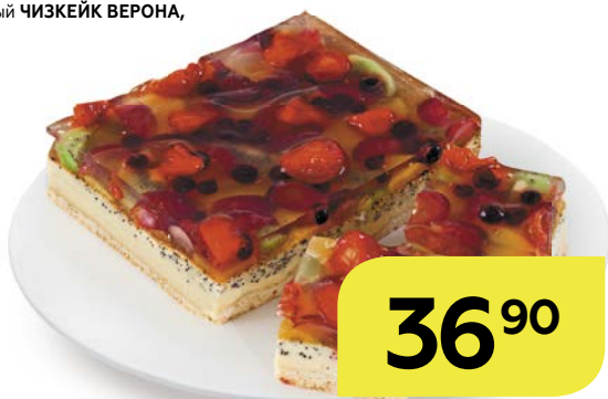
Торт песочный ЧИЗКЕЙК ВЕРОНА , 100 г