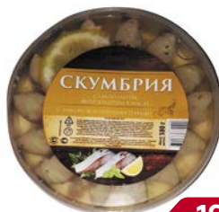
Скумбрия МАРТИ, филе кусочки слабосоленые, в масле с лимоном, 180г