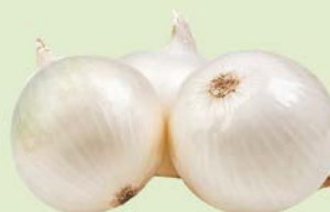
ЛУК РЕПЧАТЫЙ белый, 1кг