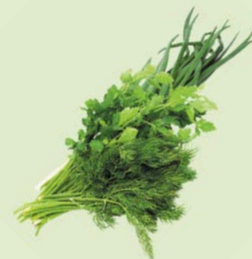
ЗЕЛЕНЬ АССОРТИ, 1уп. (100 г)