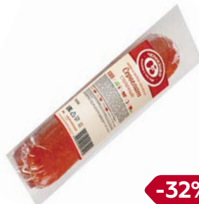
Сервелат СТОЛИЧНЫЙ, (ЧМПЗ), 400 г