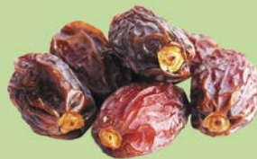
ФИНИКИ, 1уп. (200 г)