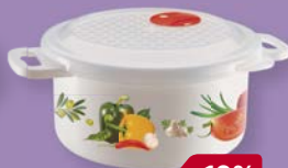
ЕМКОСТЬ ДЛЯ ХОЛОДИЛЬ- НИКА И СВЧ, с декором, 0,9 л