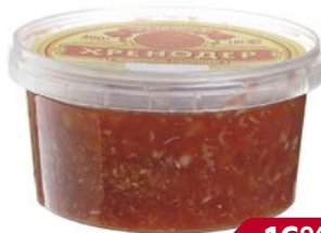
ХРЕНОДЕР (Уральский разносол), 400 г