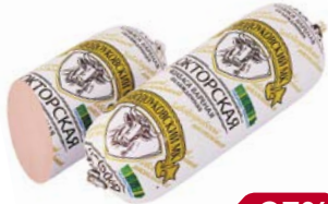
Колбаса ДОКТОРСКАЯ, мини (ПурагроУк), 1 кг