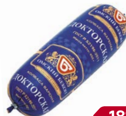
Колбаса ДОКТОРСКАЯ (Омский бекон), 450 г