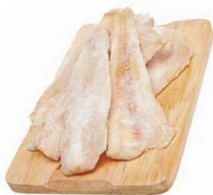
МИНТАЙ** филе из замороженного сырья, 1кг