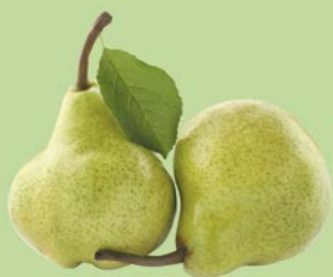
ГРУША ВИЛЬЯМС/ ПАКХАМС, 1кг

ЦЕНА НА ТОВАР ДЕЙСТВУЕТ В ПЕРИОД С 27.03.2019 ПО 02.04.2019