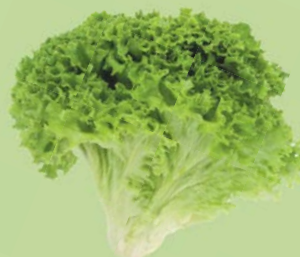
САЛАТ ЛИСТОВОЙ, 1уп. (100 г)