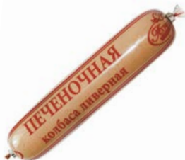
Колбаса ПЕЧЕНОЧНАЯ, ливерная, мини (МПК Атышевский), 250 г