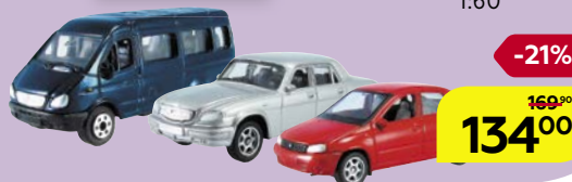
АВТО РФ легковые гражданские, 1:60