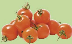
ТОМАТЫ ЧЕРРИ, 1уп. (500 г)