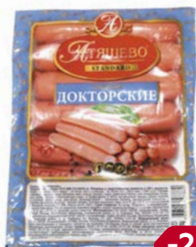
Сосиски ДОКТОРСКИЕ (МПК Атышевский), 600 г

* Цена за единицу товара при одновременной покупке 2 одинаковых акционных товаров