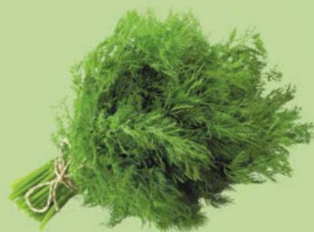
УКРОП, 1уп. (100 г)