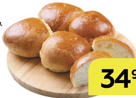
ПАМПУШКИ С ЧЕСНОКОМ, 300 г