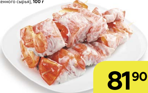
Полуфабрикат из рыбы ШАШЛЫК ИЗ ЛОСОСЯ , (из мороженого сыря), 100 г