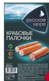
Палочки крабовые РУССКОЕ МОРЕ, охлажденные, 200г