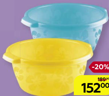
ТАЗ прозрачный цветной, с рисунком, 14 л