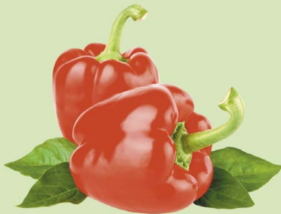
ПЕРЕЦ КРАСНЫЙ, 1кг