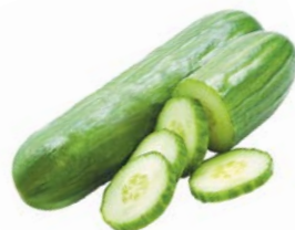
ОГУРЦЫ ГЛАДКИЕ, 1уп. (600г)