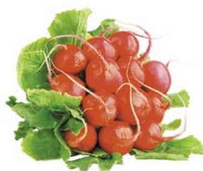
РЕДИС, 1уп. (500г)