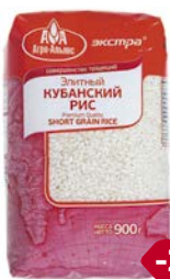
Рис ЭКСТРА, Кубанский, Элитный (Агро-Альянс), 900 г