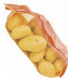
КАРТОФЕЛЬ, МЫТЫЙ, Экстра класса, 1уп. (2,5 кг)