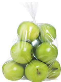
ЯБЛОКИ Кубанские, 1кг