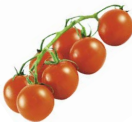
ТОМАТЫ КОКТЕЙЛЬНЫЕ, 1уп. (450г)