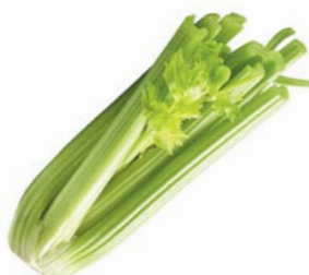
СЕЛЬДЕРЕЙ СТЕБЕЛЬ, 1уп. (300-600г)