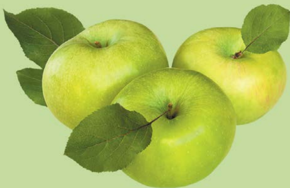
ЯБЛОКИ СИМИ-РЕНКО, 1кг