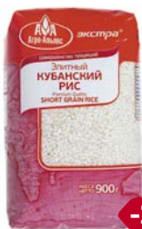
Рис ЭКСТРА, Кубанский, Элитный (Агро-Альянс), 900 г