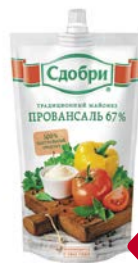
Майонез СДОБРИ, Провансаль, 67%, 400 г