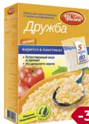
Смесь риса и пшена УВЕЛКА, Дружба, 5 пакетиков x 80 г