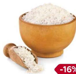
РИС, Круглозерный, 800 г