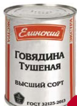
ГОВЯДИНА ТУШЕНАЯ, Высший сорт, ГОСТ (Елиноский ПК), 338 г