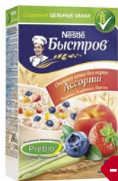
Каша овсяная БЫСТРОВ, Ассорти: Черника, клубника, персик, 6 пакетиков x 40 г