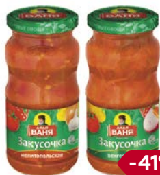
Закуска ДЯДЯ ВАНЯ: Мелитопольская/ Венгерская, 460 г