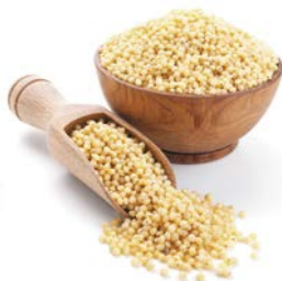
Крупа ПШЕНО, 800 г