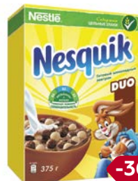
Завтрак готовый НЕСКВИК, Дуо, 375 г