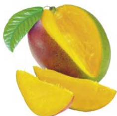
МАНГО, 100 г