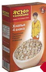
Хлопья ЯСНО СОЛНЫШКО 4 злака, 375 г