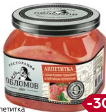
Аппетитка РЕСТОРАЦИЯ ОБЛОМОВ С Бакинскими томатами и перчиком пепперони, 420 г