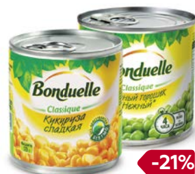
БОНДЮЭЛЬ, Кукуруза/ Горошек зеленый, 170 г