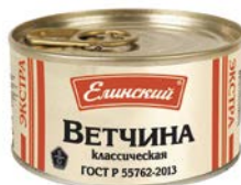
ВЕТЧИНА, классическая, ГОСТ (Елиноский ПК), 325 г