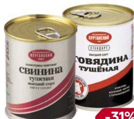
СТАНДАРТ, высший сорт, тушеная: Свинина/ Говядина (Курганский МК), 338 г