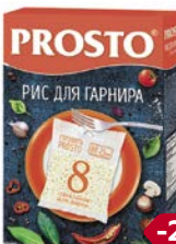
Рис ПРОСТО среднезерный для гарнира, 500г