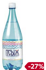
Вода минеральная ПСЫЖ, Негази- рованная, 1 л