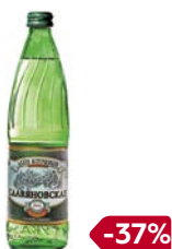
Вода минеральная СЛАВЯНОВСКАЯ, газированная, 500 мл