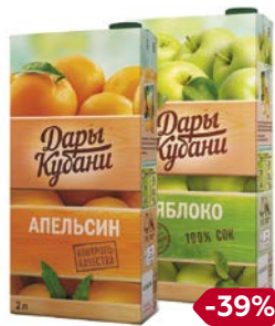
Соки и нектары ДАРЫ КУБАНИ, в ассортименте**, 2 л