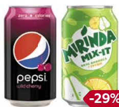
Газированный напиток ПЕПСИ/ МИРИНДА, в ассортименте***, 330 мл