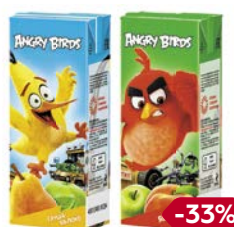
Нектар ЭНГРИ БЕРДС, в ассорти- менте***, 200 мл