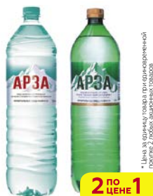
Вода минеральная АРЗА Газированная/ №1 Лечебная газированная, 1,5 л