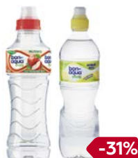
Вода питьевая БОН АКВА, Вива, негазированная: Яблоко/ Лимон, 500 мл