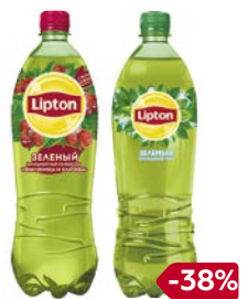
Чай холодный ЛИПТОН, Лимон/ Зеленый/ зеленый/ Земляника и клюква, 1 л