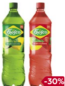
Напиток безалко- гольный ЭЛЬФРЕСКО, Мохито: Классика/ Клубника, 1,25 л