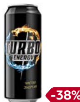
Напиток эне- ргетический ТУРБО ЭНЕРДЖИ, 450 мл