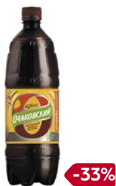
Квас ОЧАКОВСКИЙ, 1 л