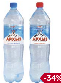
Вода ЛЕГЕНДА ГОР АРХЫЗ, Природная: Гази- рованная/ Негази- рованная, 1,5 л

* Цена за единицу товара при параллельном покупке 2 разных экземпляров товаров