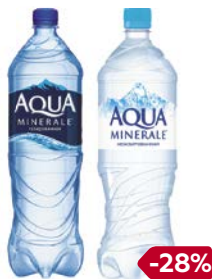
Вода питьевая АКВА МИНЕРАЛЕ газированная/ негазированная, 1,5 л