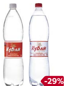
Вода питьевая КУБАЙ, Негазированная/ Газированная, 1,5 л