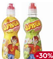
Напиток ДЖАМПЕР, Негазированный: виноград-яблоко/ банан-персик/ клуб- ника-ананас, 330 мл