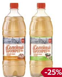
Квас СЕМЕЙНЫЙ СЕКРЕТ, классиче- ский/ для окрошки с хреном, 1 л