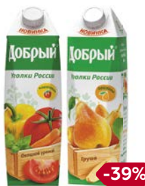
Нектар ДОБРЫЙ, в ассортименте**, 1 л