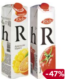
Соки и нектары РИЧ, в ассорти- менте**, 1 л