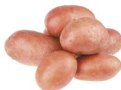
КАРТОФЕЛЬ, красный, 1 кг