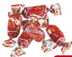
Карамель МОСКВИЧКА (Рот Фронт), 100 г