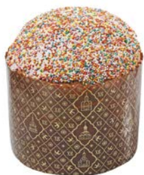
КУЛИЧ, 1 шт.