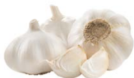
ЧЕСНОК, 1 кг