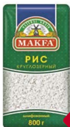
Рис МАКФА, круглозерный шлифованный, 800г