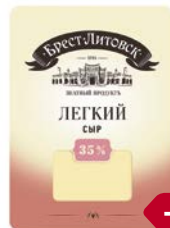
Сыр БРЕСТ-ЛИТОВСК , Легкий, 35%, Нарезка, 150 г