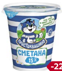
Сметана ПРОСТОВАШИНО , 15%, 315 г