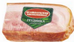
Грузинка ОХОТНИЧЬЯ , Варено-копченая (Великолукский МК), 300 г