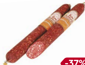
Колбаса ПРЕМЬЕРА , Дым Дымыч, сырокопче- ная, мини (МК Родина), 200 г