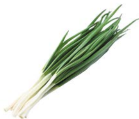
ЛУК ЗЕЛЕНый, 1 уп (100 г)