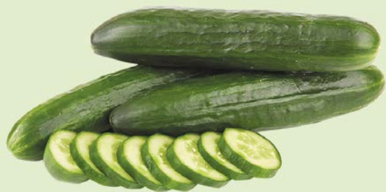
ОГУРЦЫ СРЕД- НЕПЛОДНЫЕ, 1 шт. (180 г)