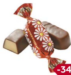
Конфеты РОМАШКИ , шоколадные (Рот Фронт), 100 г