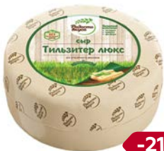
Сыр ТИЛЬЗИТЕР , Люкс (Радость вкуса), 100 г