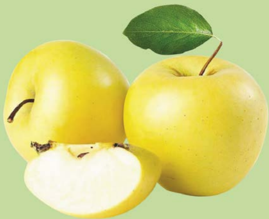
ЯБЛОКИ ГОЛДЕН, 1 кг