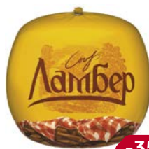
Сыр ЛАМБЕР , 50%, 100 г