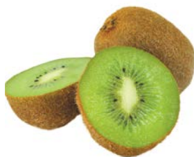
КИВИ, 1 кг