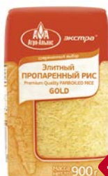
Рис АГРО-АЛЬЯНС, Пропаренный, элитный, 900г