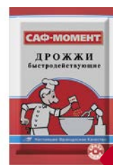
Дрожжи САФ-МОМЕНТ , быстродействующе- щие, 11 г