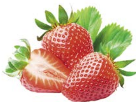
КЛУБНИКА ФАСОВАННАЯ, 100 г