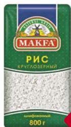
Рис МАКФА, круглозерный шлифованный, 800г