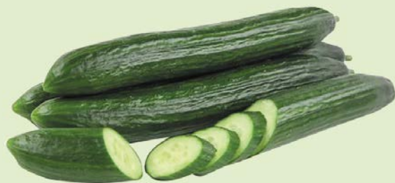
ОГУРЦЫ ДЛИН- НОПЛОДНЫЕ, 1 шт. (250 г)