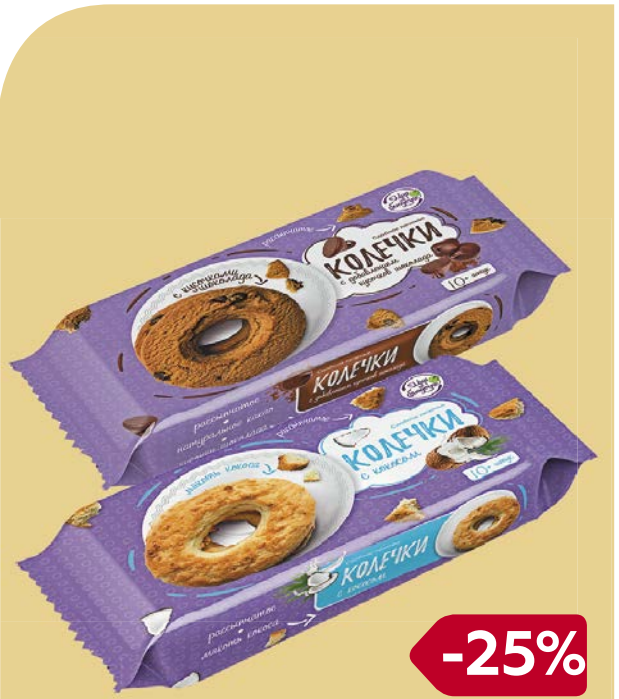
Печенье МИР НА БЛЮДЕЧКЕ, Колечки с коко- сом/ Колечки с шоколадом, 180 г