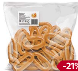
Сушки ЗОЛОТОЙ КОЛОБОК, челночок, 300 г