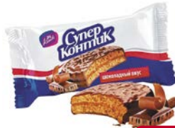
Печенье СУПЕР КОНТИК, шоколадное, 100 г