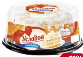
Торт УСЛАДОВ, Пломбирный (Хлебпром ОАО), 700 г