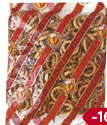
Колечки ЗОЛОТОЙ КОЛОБОК, с солью, 200 г