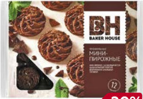
Мини-пирожные БЭЙКЕР ХАУС, Трюфель, 240 г