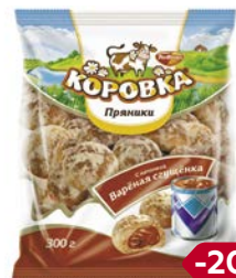
Пряники КОРОВКА, С начинкой Вареная сгущенка (Рот Фронт), 300 г