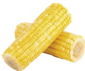
КУКУРУЗА, вареная в/у, 1уп. (450 г)