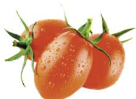
ТОМАТЫ, СЛИВОВИДНЫЕ, 1уп. (600г)