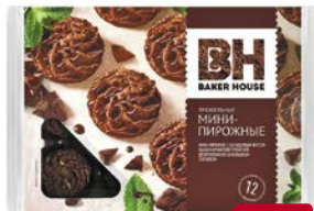
Миши-пирожные БЭЙКЕР ХАУС , Трюфель, 240 г