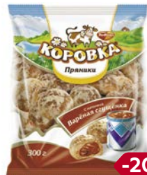
Пряники КОРОВКА , С начинкой Вареная сгущенка (Рот Фронт), 300 г