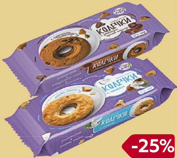
Печенье МИР НА БЛЮДЕЧКЕ , Колечки с коко- сом/ Колечки с шоколадом, 180 г