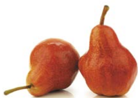
ГРУША КРАСНАЯ, Урожай, 1кг