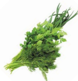
ЗЕЛЕНЬ АССОРТИ, 1уп. (100 г)