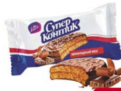
Печенье СУПЕР КОНТИК , шоколадное, 100 г