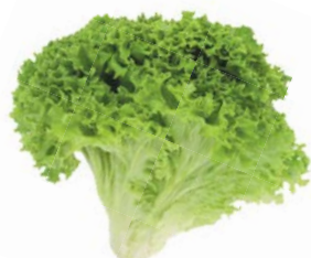
САЛАТ ЛИСТОВОЙ, 1уп. (100 г)