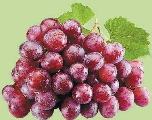
ВИНОГРАД, РЕД ГЛОБ, красный, 1кг