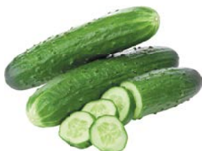
ОГУРЦЫ, ПУПЫР- ЧАТЫЕ, 1кг