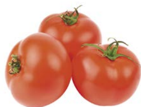
ТОМАТ, 1уп. (600г.)