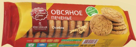
Печенье овсяное ХЛЕБНЫЙ СПАС , Особое, 250 г