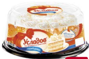
Торт УСЛАДОВ , Пломбирный (Хлебпром ОАО), 700 г