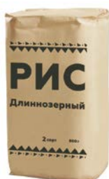
Рис длиннозерный, 800 г