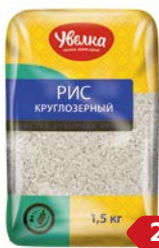
Рис круглозерный УВЕЛКА, шлифованный, 1500 г