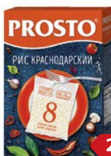
Рис ПРОСТО, Краснодарский, 8 пакетиков x 62,5 г