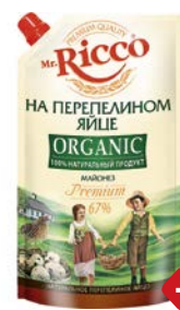
Майонез МИСТЕР РИККО, Органик, на перепелином яйце, 67%, 400 мл