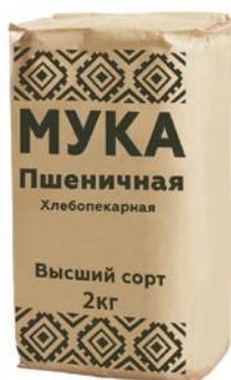
МУКА, пшеничная, хлебопекарная, Высший сорт, 2 кг