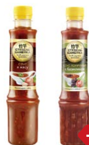
Соус СТЕБЕЛЬ БАМБУКА, чили/ к мясу/ с базили- ком, 280 г