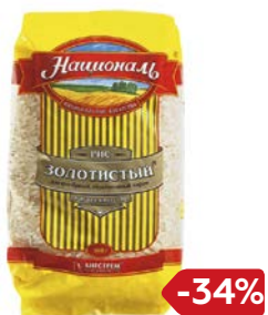
Рис НАЦИОНАЛЬ, Золотистый, 900 г