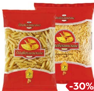
Макаронные изде- лия ШЕБЕКИНСКИЕ, в ассортименте***, 450 г