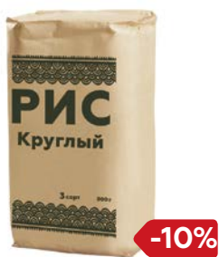
РИС, Круглозер- ный, 800 г