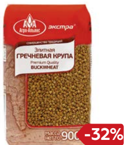
Крупа гречневая ЭКСТРА, Элитная (Агро-Альянс), 900 г