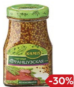
Горчица КАМИС, Французская, зернистая, 185 г