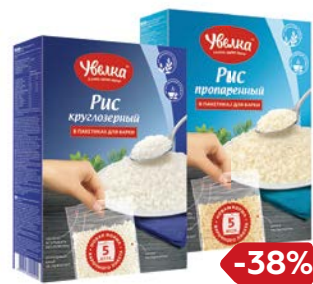
Рис УВЕЛКА, Пропаренный длин- нозерный/ Круглый шлифованный, 5 пакетиков x 80 г