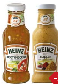
Соус ХАЙНЦ, Экзо- тический 250 мл/ Чесночный 260 мл/ Карри 270 мл