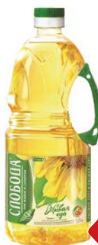
Масло подсолнеч- ное СЛОБОДА, рафинированное, дезодорирован- ное, 1,8 л