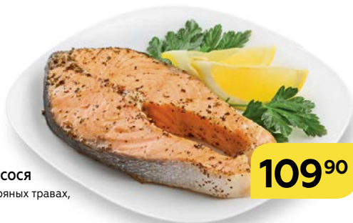
СТЕЙК ИЗ ЛОСОСА в специях и пряных травах, 100 г