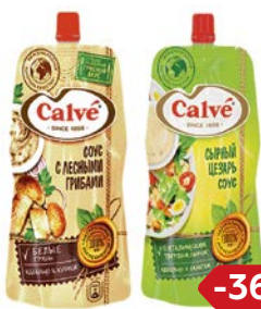
Соус КАЛЬВЕ, В ассортименте***, 230 г