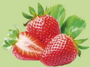
КЛУБНИКА ФАСОВАННАЯ, 100 г

ЦЕНА НА ТОВАР ДЕЙСТВУЕТ В ПЕРИОД С 08.05.2019 ПО 14.05.2019