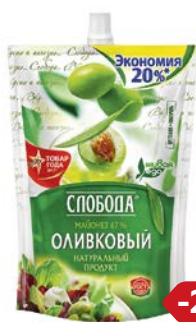
Майонез СЛОБОДА, Оливковый, 67%, 750 г