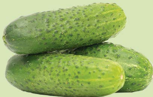
ОГУРЦЫ КОРОТКОПЛОДНЫЕ, 1кг