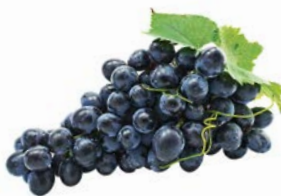
ВИНОГРАД ЧЕРНЫЙ, 1кг