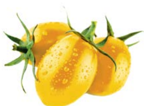
ТОМАТ СЛИВКА желтая 1уп. (350 г)