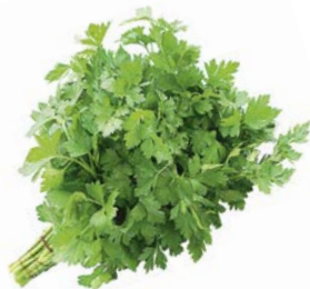
ПЕТРУШКА, 1уп. (100 г)