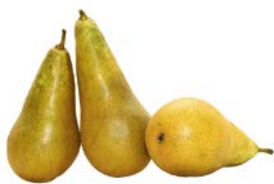
ГРУША АББАТ, 1кг