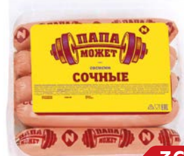
Сосиски СОЧНЫЕ, Папа может (ОМПК), 450 г