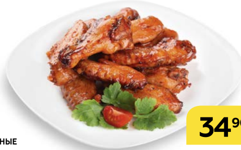
КРЫЛЬЯ КУРИНЫЕ в соусе «Кисло-сладкий», 100 г