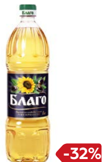
Масло растительное БЛАГО, Подсолнечно-оливковое, 1 л