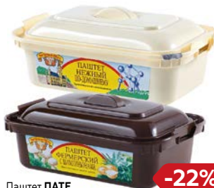
Паштет ПАТЕ ГРАНД-МЭР печеночный: фермерский с шампиньонами/ нежный по-домашнему, 150 г