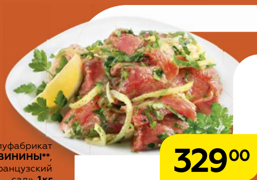
Полуфабрикат ШАШЛЫК ИЗ СВИНИНЫ** , в маринаде «Французский сад», 1 кг