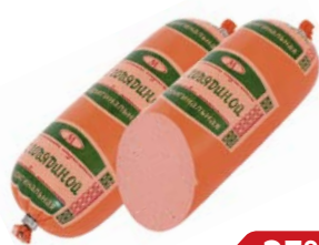
Колбаса ОРИГИНАЛЬНАЯ, Вареная, с говядиной (Микоян), 400 г