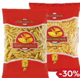
Макаронные изделия ШЕБЕКИНСКИЕ, в ассортименте***, 450 г