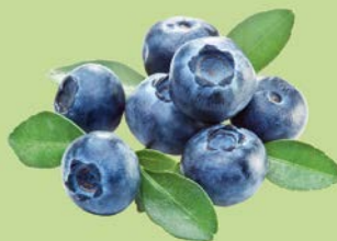
ГОЛУБИКА, 1уп. (125 г)