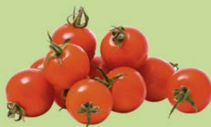
ТОМАТЫ, ЧЕРРИ, 1уп. (250г)