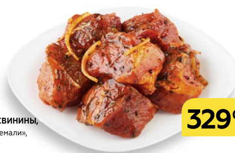
Полуфабрикат ШАШЛЫК ИЗ СВИНИНЫ , в маринаде «Ткемали», из лопатки, 1 кг