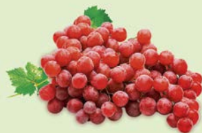
ВИНОГРАД КРАСНЫЙ, 1кг