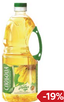
Масло подсолнечное СЛОБОДА, рафинированное, дезодорированное, 1,8 л