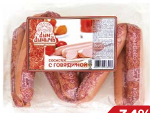
Сосиски ДЫМ ДЫМЫЧЬ, С говядиной (Агротэк), 400 г