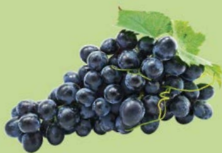
ВИНОГРАД ЧЕРНЫЙ, 1кг