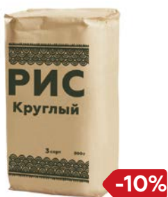
РИС, Кружлозерный, 800 г