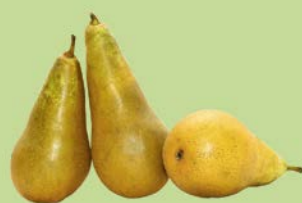
ГРУША АББАТ, 1кг