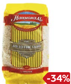
Рис НАЦИОНАЛЬ, Золотистый, 900 г