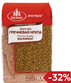
Крупа гречневая ЭКСТРА, Элитная (Агро-Альянс), 900 г