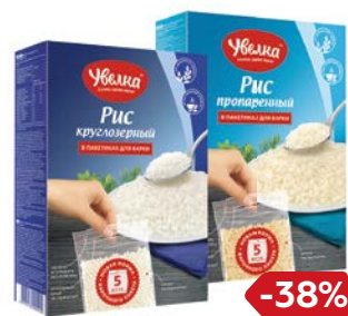
Рис УВЕЛКА, Пропаренный длиннозерный/Кружлый шлифованный, 5 пакетиков x 80 г