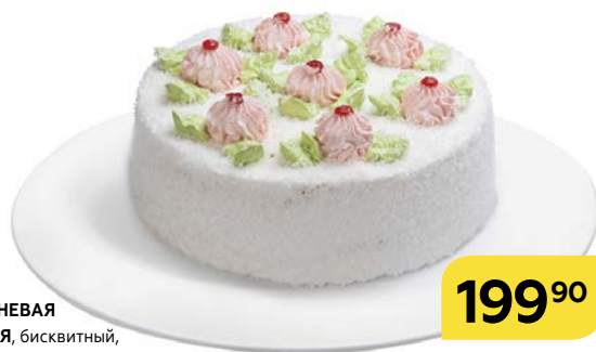
Торт ВИШНЕВАЯ ФАНТАЗИЯ , бисквитный, 700 г