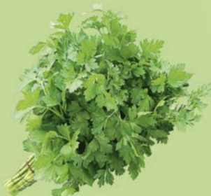
ПЕТРУШКА, 1 уп. (100 г)