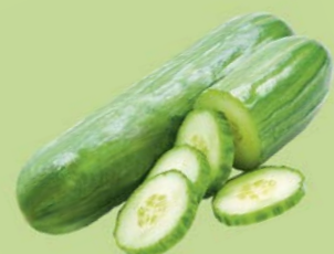
ОГУРЦЫ ГЛАДКИЕ, 1уп. (600г)