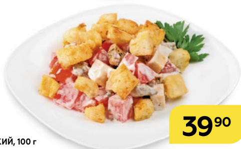
Салат БАВАРСКИЙ , 100 г