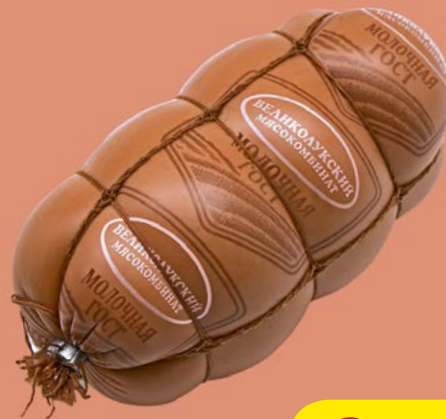
Колбаса МОЛОЧНАЯ, ГОСТ, вареная (Великолукский МК), 500 г