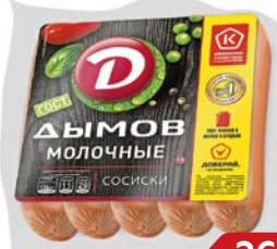
Сосиски МОЛОЧНЫЕ, ГОСТ (Дымов), 300 г