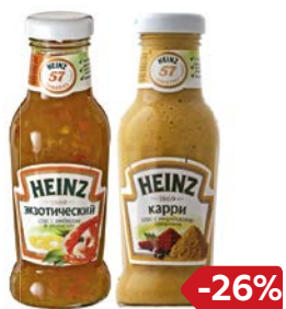
Соус ХАЙНЦ, Экзотический 250 мл/Чесночный 260 мл/Карри 270 мл