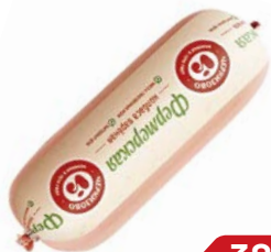
Колбаса ФЕРМЕРСКАЯ, Вареная, (ЧМПЗ), 500 г

* Цена за единицу товара при единовременной покупке 2 одинаковых акционных товаров