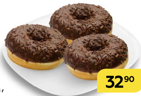
Пончик К ЧАЮ , глазированный, 53 г