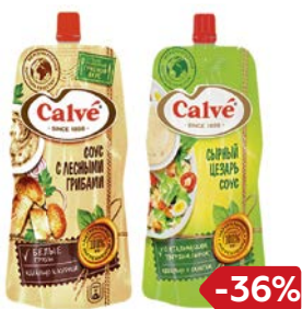
Соус КАЛЬВЕ, В ассортименте***, 230 г