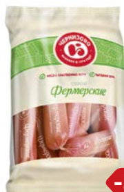
Сосиски ФЕРМЕРСКИЕ, Из мяса птицы (ЧМПЗ), 650 г