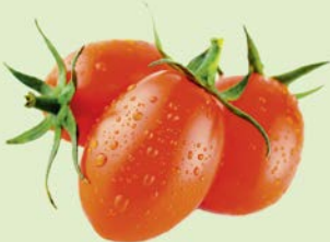
ТОМАТЫ, СЛИВОВИДНЫЕ, 1уп. (600г)