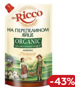
Майонез МИСТЕР РИККО, Органик, на перепелином яйце, 67%, 400 мл