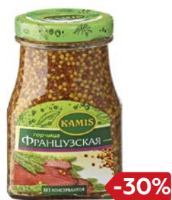
Горчица КАМИС, Французская, зернистая, 185 г