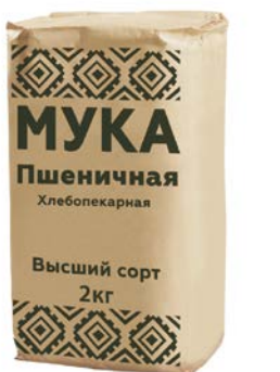
МУКА, пшеничная, хлебопекарная, Высший сорт, 2 кг