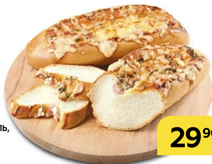
Батон ПРОВАНСАЛЬ , с ветчиной, 150 г