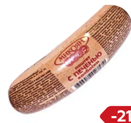
Паштет С ПЕЧЕНЬЮ, Колбаски (Микояновский МК), 250 г