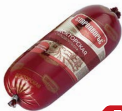
Колбаса ДОКТОРСКАЯ, Стародворье, вареная (Стародворские Колбасы), 500 г