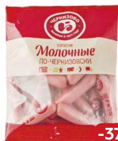
Сосиски МОЛОЧНЫЕ, По-черкизовски (ЧМПЗ), 650 г