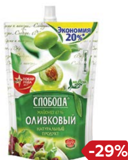
Майонез СЛОБОДА, Оливковый, 67%, 750 г