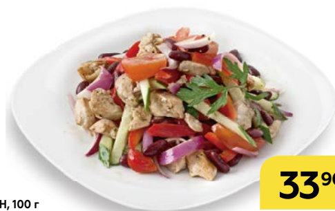
Салат МЮНХЕН , 100 г