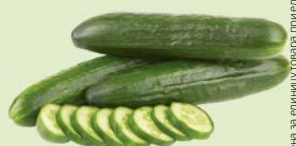
ОГУРЦЫ для окрошки, 1шт. (180г)