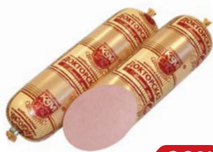
Колбаса ДОКТОРСКАЯ (Кировский МК), 400 г