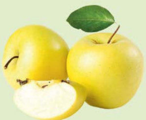
ЯБЛОКИ ГОЛДЕН, 1кг

ЦЕНА НА ТОВАР ДЕЙСТВУЕТ В ПЕРИОД С 15.05.2019 ПО 21.05.2019