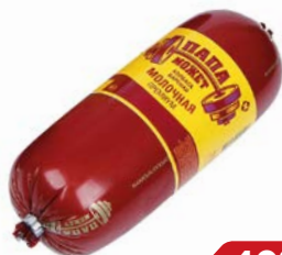
Колбаса МОЛОЧНАЯ Папа может, Премиум (ОМПК), 500 г