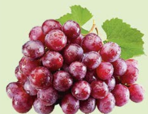
ВИНОГРАД, РЕД ГЛОБ, красный, 1кг