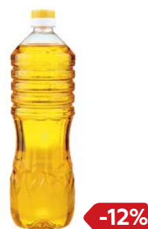
МАСЛО РАСТИТЕЛЬНОЕ, Подсолнечное, рафинированное, дезодорированное, 900 мл