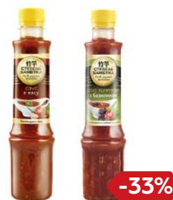
Соус СТЕБЕЛЬ БАМБУКА, чили/ к мясу/ с базили- ком, 280 г