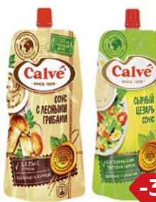
Соус КАЛЬВЕ, В ассортименте***, 230 г