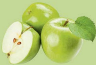
ЯБЛОКИ ГРЕННИ СМИТ, 1кг