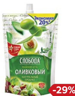
Майонез СЛОБОДА, Оливковый, 67%, 750 г