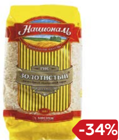
Рис НАЦИОНАЛЬ, Золотистый, 900 г