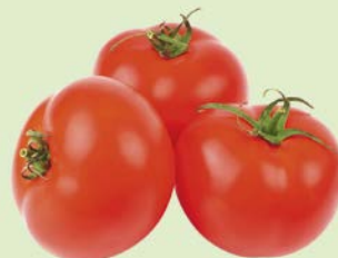
ТОМАТ, 1уп. (600 г.)