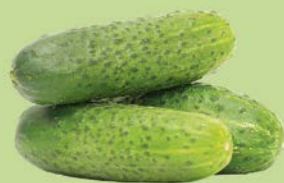
ОГУРЦЫ КОРОТ- КОПЛОДНЫЕ, 1кг