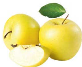
ЯБЛОКИ ГОЛДЕН, 1кг