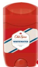
Дезодорант-стик OLD SPICE® , Вайт Вотер, 50 мл