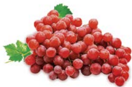
ВИНОГРАД КРАСНЫЙ, 1кг