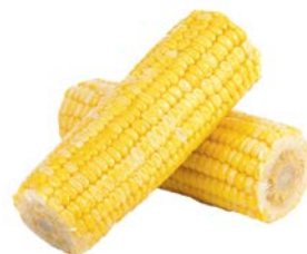
КУКУРУЗА, вареная в/у, 1уп. (450г)