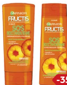
FRUCTIS® , Шампунь, 400 мл/ Бальзам, 387 мл, в ассортименте***