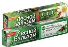
Паста зубная ЛЕСНОЙ БАЛЬЗАМ , Ромашка и обле- пиха/ С экстрактом коры дуба и пихты, 75 мл