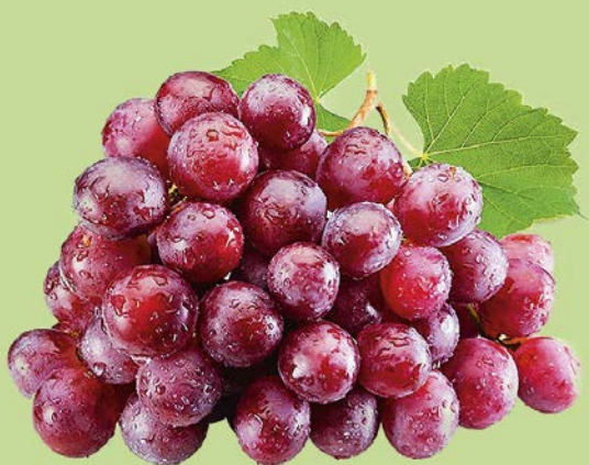
ВИНОГРАД, РЕД ГЛОБ, красный, 1кг