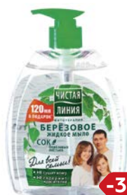
Мыло жидкое ЧИСТАЯ ЛИНИЯ , Березовое, для всей семьи, 520 мл