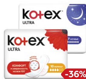
Прокладки KOTEX® , Ультра: Нормал, 10 шт./ Супер, 8 шт./ Ночные, 7 шт.