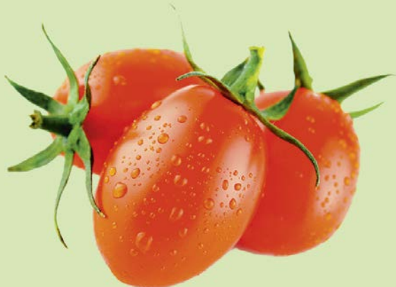
ТОМАТЫ, СЛИВОВИДНЫЕ, 1уп. (600г)