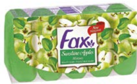
Мыло ФАКС , Яблоко, 5 шт. x 70 г