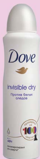
Дезодорант-спрей DOVE® , Невиди- мый, 150 мл