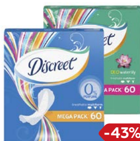
Прокладки ежедневные DISCREET® , Дышащие/Водная лилия, 60 шт.