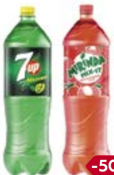
Напиток газированный 7АП/ ПЕПСИ/ МИРИНДА в ассортименте***, 1,5 л