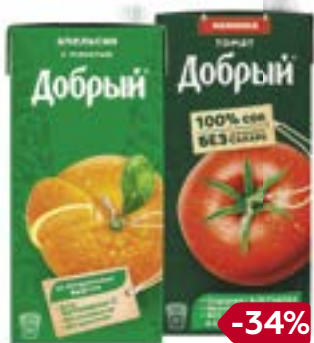
Соки и нектары ДОБРЫЙ , в ассортименте***, 2 л