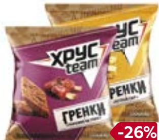
Гренки ХРУСТИМ , Острый сыр/Копченый лосось/Ребрышки на гриле, 105 г