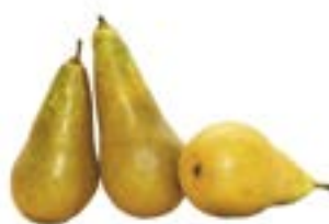
ГРУША АББАТ, 1кг