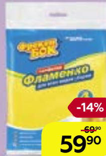
Салфетка ФРЕКЕН БОК, Фламенко, вискоза, 12 x 3,5, 5 шт.