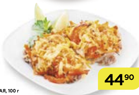
Свинина ЛЮБИТЕЛЬСКАЯ , 100 г