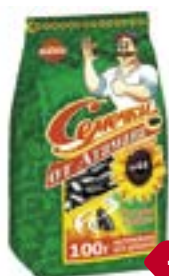
Семечки подсолнечные ОТ АТАМАНА , Отборные жареные, 100 г