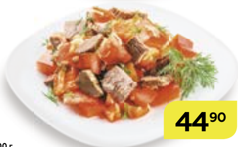
Салат САЛАМ , 100 г