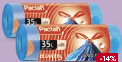
Мешки с завязками ПАКЛАН Экономи, 35 л, 19 мкн, 20 шт.