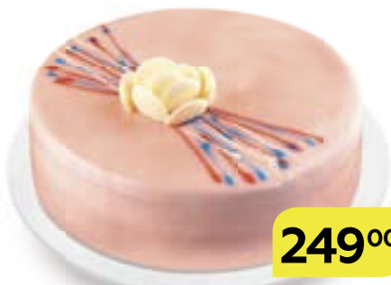
Торт ЗЕРКАЛО , бисквитный, 800 г