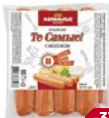
Сосиски ТЕ САМЫЕ, с молоком (Фамильные колбасы), 400 г