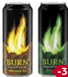
Напиток энергетический БЕРН , газированный, в ассортименте***, 500 мл