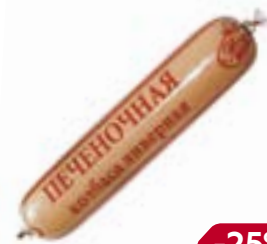
Колбаса ПЕЧЕНОЧНАЯ, ливерная, мини (МПК Атяшев- ский), 250 г