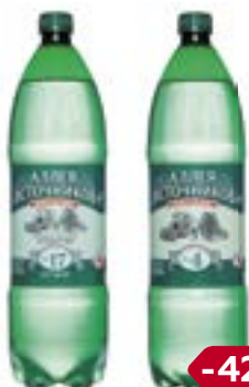
Вода минеральная АЛЛЕЯ ИСТОЧНИКОВ , №4/ №17, 1,5 л