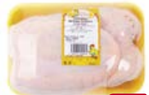
Грудка цыпленка-бройлера НАШ ЗОЛОТОЙ ЦЫПЛЕНОК , охлажденная (Уральский бройлер), 1кг