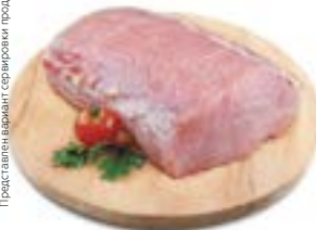
КАРБОНАД без кости, охлажденный, 1кг

Представлен вариант сервировки продукции