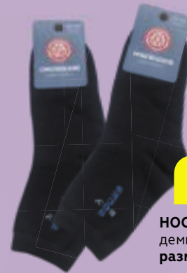
НОСКИ детские, демисезонные, размер - 20-22