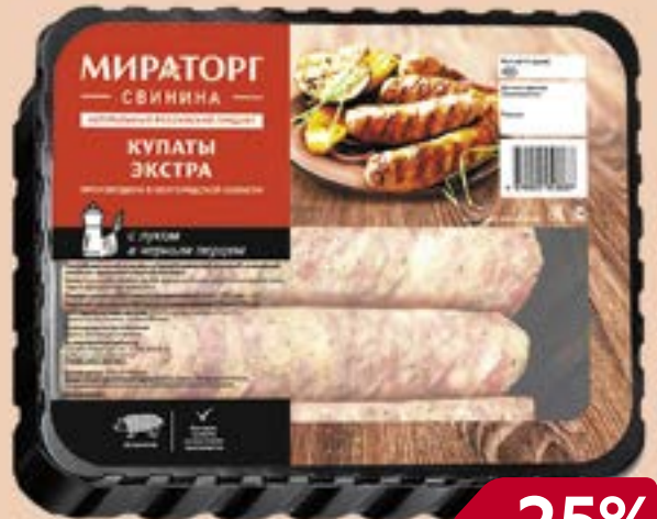
Купаты свиные МИРАТОРГ, Экстра , охлажденные, 400г