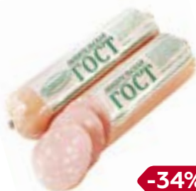
Колбаса ЛЮБИТЕЛЬСКАЯ, ГОСТ, вареная (Великолукский МК), 500 г