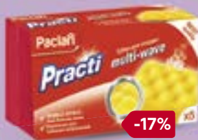
Губки для посуды ПАКЛАН, Мульти-вейв, 5 шт.