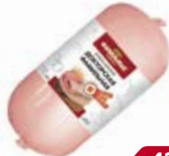
Колбаса ДОКТОРСКАЯ ФАМИЛЬНАЯ (Фамильные колбасы), 400 г