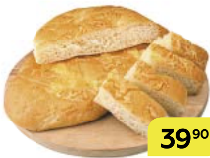
Хлеб ФОКАЧО , с сыром, 300 г