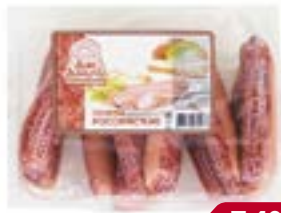
Сосиски, РОССИЙСКИЕ, Дым Дымыч (Агротэк), 500 г