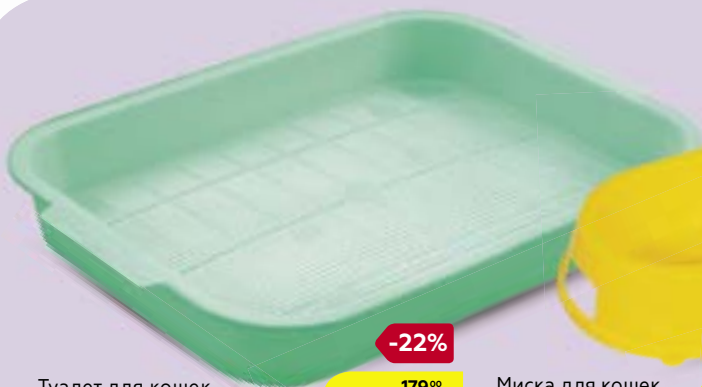
Туалет для кошек ГАММА, средний, с сеткой, в ассортименте***