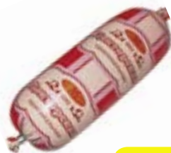
Колбаса ДОКТОРСКАЯ, Оригинальная, мини (Микоян), 400 г