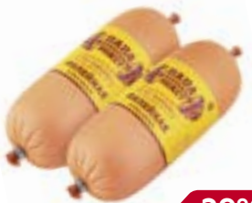
Колбаса ФИЛЕЙНАЯ, Папа мошет, Вареная (ОМПК), 500 г

* Цена за единицу товара при сортированной покупке 2-х одинаковых акционных товаров