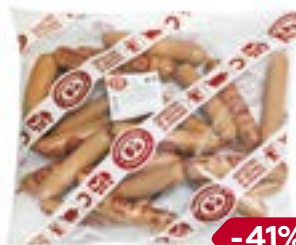
Сосиски СЛИВОЧНЫЕ, По-черкизовски (ЧМПЗ), 650 г