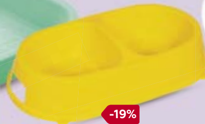
Миска для кошек ГАММА, пластик, двойная, 2 x 0,26 л