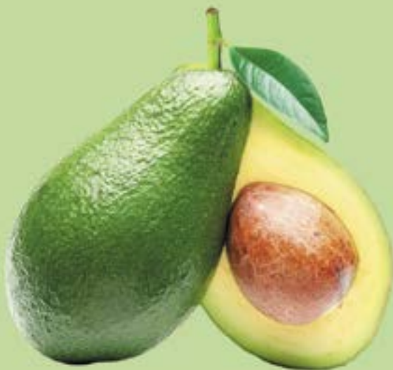
АВОКАДО, 100 г