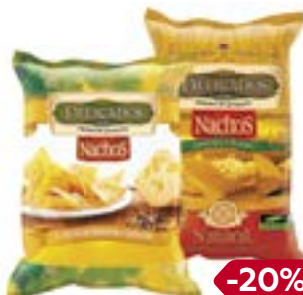
Чипсы кукурузные ДЕЛИКАДОС , Оригинальные/С сыром, 150 г