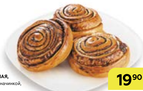
Сдоба ЛЮБИМАЯ , с шоколадной начинкой, 100 г