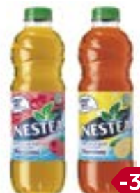
Чай NESTLE , в ассортименте***, 500 мл