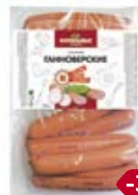
Сосиски ГАННОВЕРСКИЕ, Мини (Фамильные колбасы), 100 г