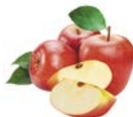
ЯБЛОКИ КРАСНЫЕ, 1кг