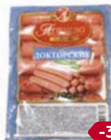
Сосиски ДОКТОРСКИЕ (МПК Атяшев- ский), 600 г