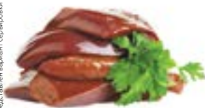
ПЕЧЕНЬ ГОВЯЖЬЯ** , полуфабрикат из замороженного сырья, 1кг

Представлен вариант сервировки продукции