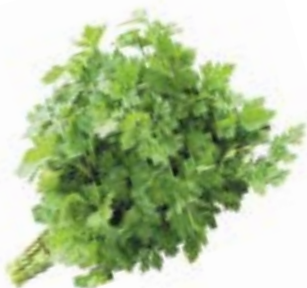
ПЕТРУШКА, 1 уп. (100 г)