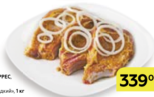
Полуфабрикат ШАШЛЫК ТОРРЕС , в маринаде «Горчично-сладкий», 1 кг