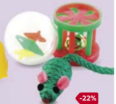
Набор игрушек ТРИОЛ, для кошек, в ассортименте***