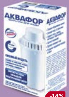
Сменный модуль АКВАФОР, D5