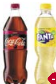
Напиток сильногазированный КОКА-КОЛА/ СПРАЙТ/ ФАНТА , в ассортименте***, 500 мл