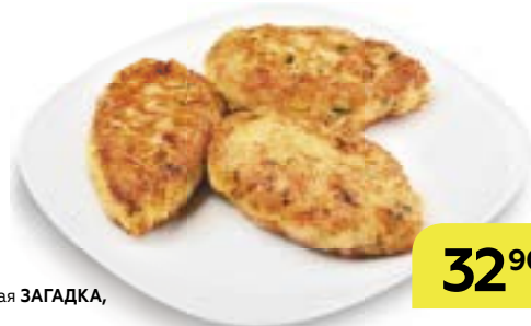
Котлета куриная ЗАГАДКА , 100 г