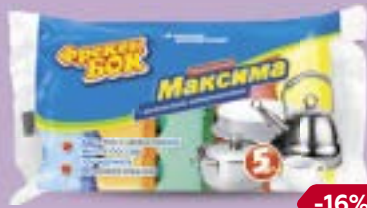
Губка для посуды ФРЕКЕН БОК, Максима, 5 шт.