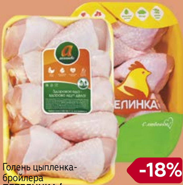
Голень цыпленка-бройлера ПЕТЕЛИНКА/ УРАЛЬСКИЙ БРОЙЛЕР/ АКАШЕВСКАЯ ПТФ охлажденная, 1кг