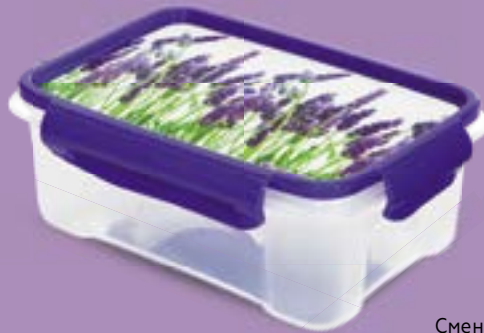
Контейнер ЛОК ДЕКОР, для СВЧ-печи, 0,75 л