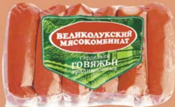
Сардельки ГОВЯЖЬИ, Традиционные, (Великолукский МК), 600 г