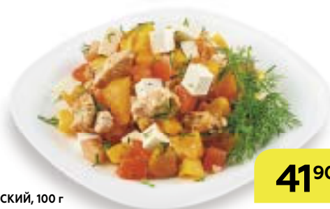
Салат БЕЛЬГИЙСКИЙ , 100 г