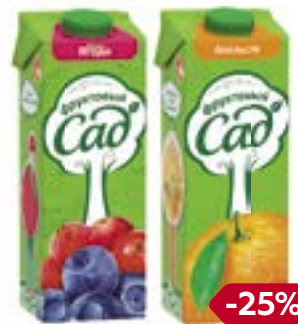
Соки и нектары ФРУКТОВЫЙ САД , в ассортименте***, 950 мл