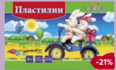
ПЛАСТИЛИН со стеклом, 18 цветов