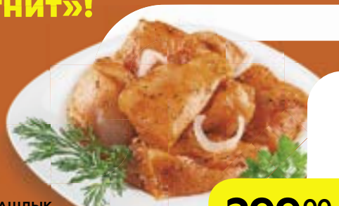
Полуфабрикат ШАШЛЫК ИЗ КУРИНОГО ФИЛЕ **, в маринаде «Харисса», 1 кг

Семья магазинов «Магнит» желает вам вкусной весны!