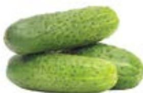
ОГУРЦЫ КОРОТКОПЛОДНЫЕ, 1кг