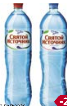
Вода питьевая СВЯТОЙ ИСТОЧНИК , Газированная/Негазированная, 1,5 л