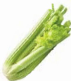
СЕЛЬДЕРЕЙ СТЕБЕЛЬ, 1 уп. (300-600 г)