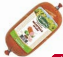
Колбаса МОЛОЧНАЯ ПРАЙМ, Вареная, Хуторок (Регионэ- копродукт), 450 г