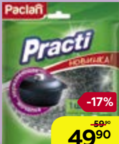
ГУБКА ДЛЯ ПОСУДЫ металлическая, 1 шт.