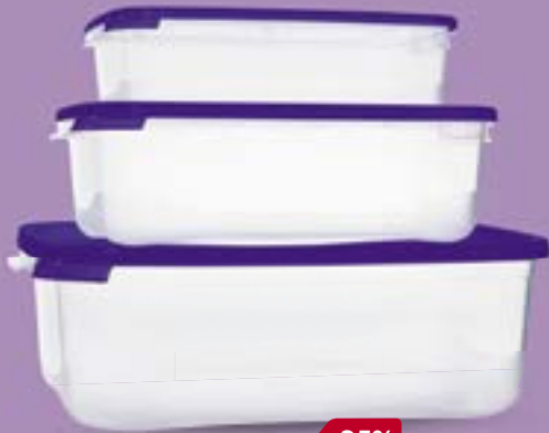
НАБОР КОНТЕЙНЕРОВ Каскад, для СВЧ-печи, 3 шт. в наборе, 0,7 л+1,2 л+2,2 л