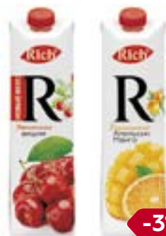
Соки и нектары РИЧ , в ассортименте***, 1 л