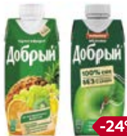
Соки и нектары ДОБРЫЙ , в ассортименте***, 330 мл