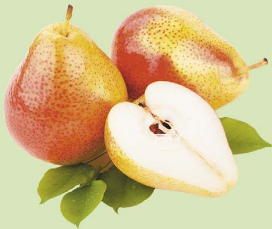
ГРУША ФОРЕЛЬ, 1кг