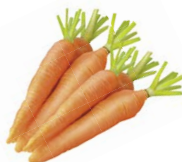
МОРКОВЬ, МЫТАЯ, 1кг