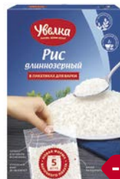
Рис УВЕЛКА , Длиннозерный, шлифованный, 5 пакетиков x 80 г