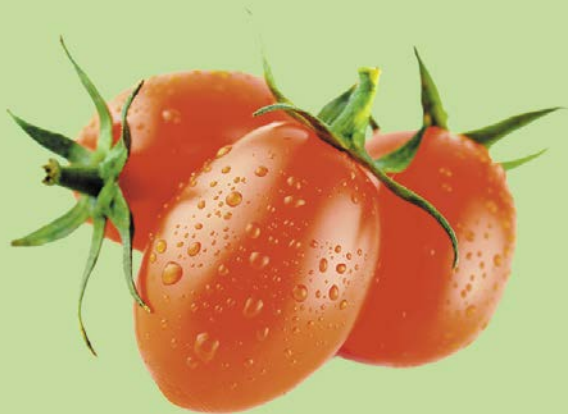
ТОМАТЫ, СЛИВОВИДНЫЕ, 1уп. (600г)