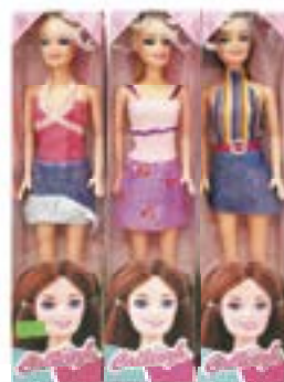
КУКЛА, 29 см, в ассортименте***