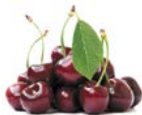
ЧЕРЕШНЯ, 1 кг