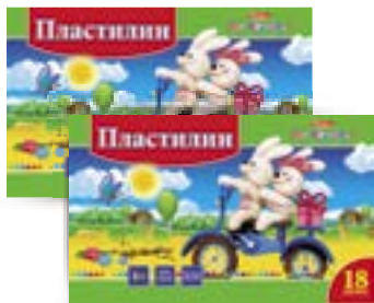
ПЛАСТИЛИН, 18 цветов, со стеклом