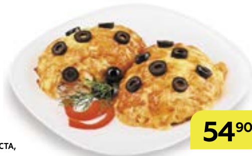
Свинина ФИЕСТА, 100 г