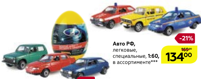
Авто РФ, легковые, специальные, 1:60, в ассортименте***