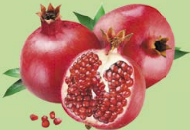
ГРАНАТ, 1 кг