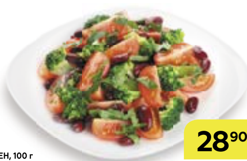
Салат МАНХЭТТЕН, 100 г