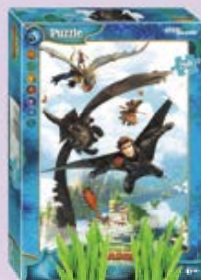
Пазлы КАК ПРИУЧИТЬ ДРАКОНА 3 , 260 элементов, в ассортименте***