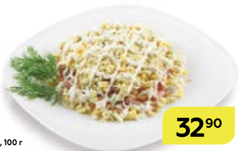
Салат ЦАРСКИЙ, 100 г