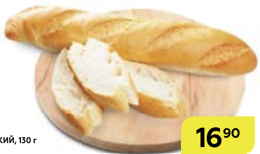
Мини-багет ФРАНЦУЗСКИЙ, 130 г