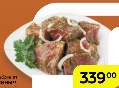
Полуфабрикат ШАШЛЫК ИЗ СВИНИНЫ** в маринаде «Французский сад», 1 кг