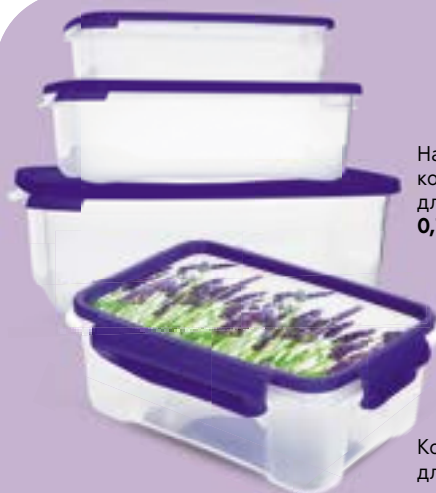
Набор контейнеров КАСКАД , для СВЧ-печи, 0,7 л+1,2 л+2,2 л, 3 шт.