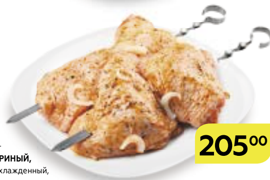
Полуфабрикат ШАШЛЫК КУРИНЫЙ, в маринаде, охлажденный, 1 кг