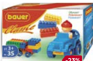
Конструктор БАУЕР , Классик, 35 элементов