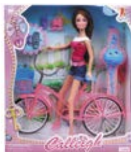
КУКЛА с велосипедом, 29 см