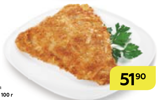
Рыба жареная БАТЕРФЛЯЙ, 100 г