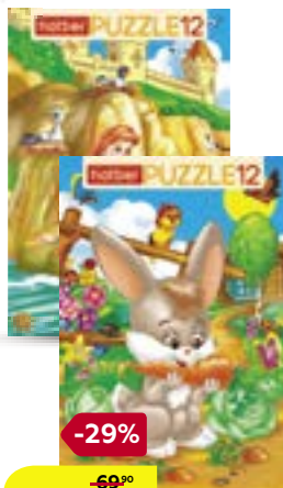
ПАЗЛЫ, 12 элементов, А4, в рамке, 200x300 мм, в ассортименте***