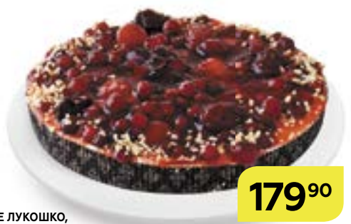
Торт песочный ФЛАН ЯГОДНОЕ ЛУКОШКО, 620 г