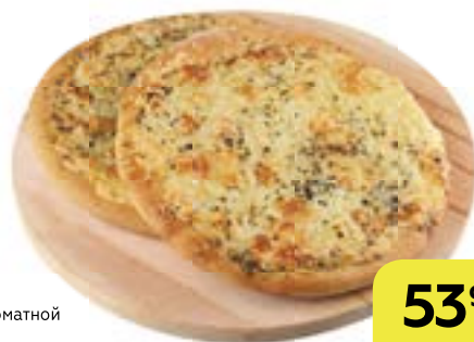
Булочка ЧИКО, с томатной начинкой, 174 г