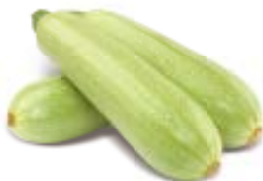
КАБАЧКИ, 1 кг